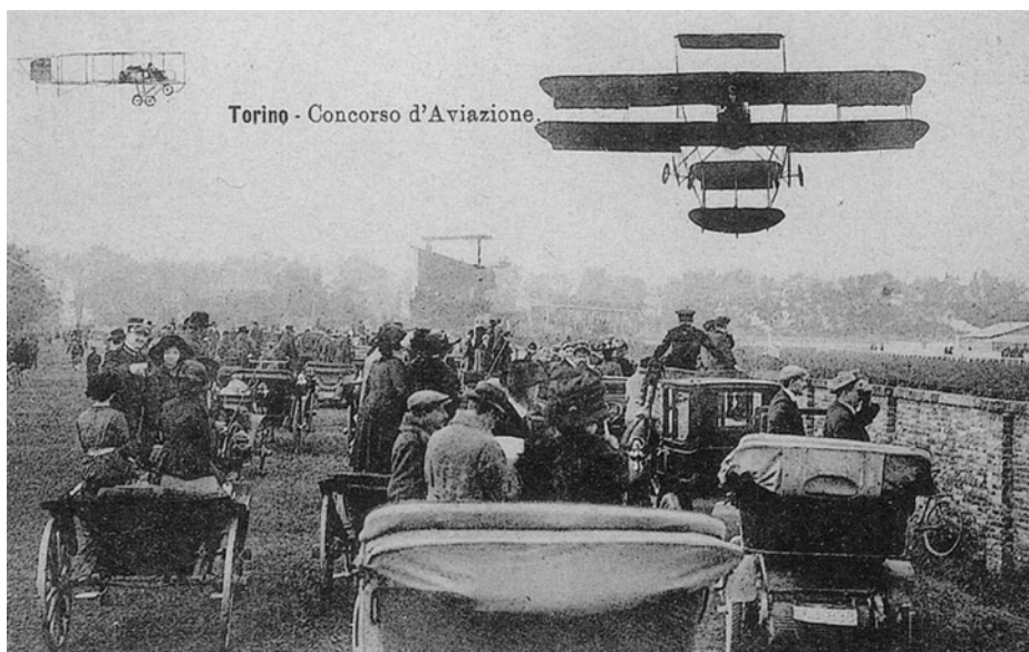
Torino - Concorso d'Aviazione. Cartolina [1913?] (collezione privata).