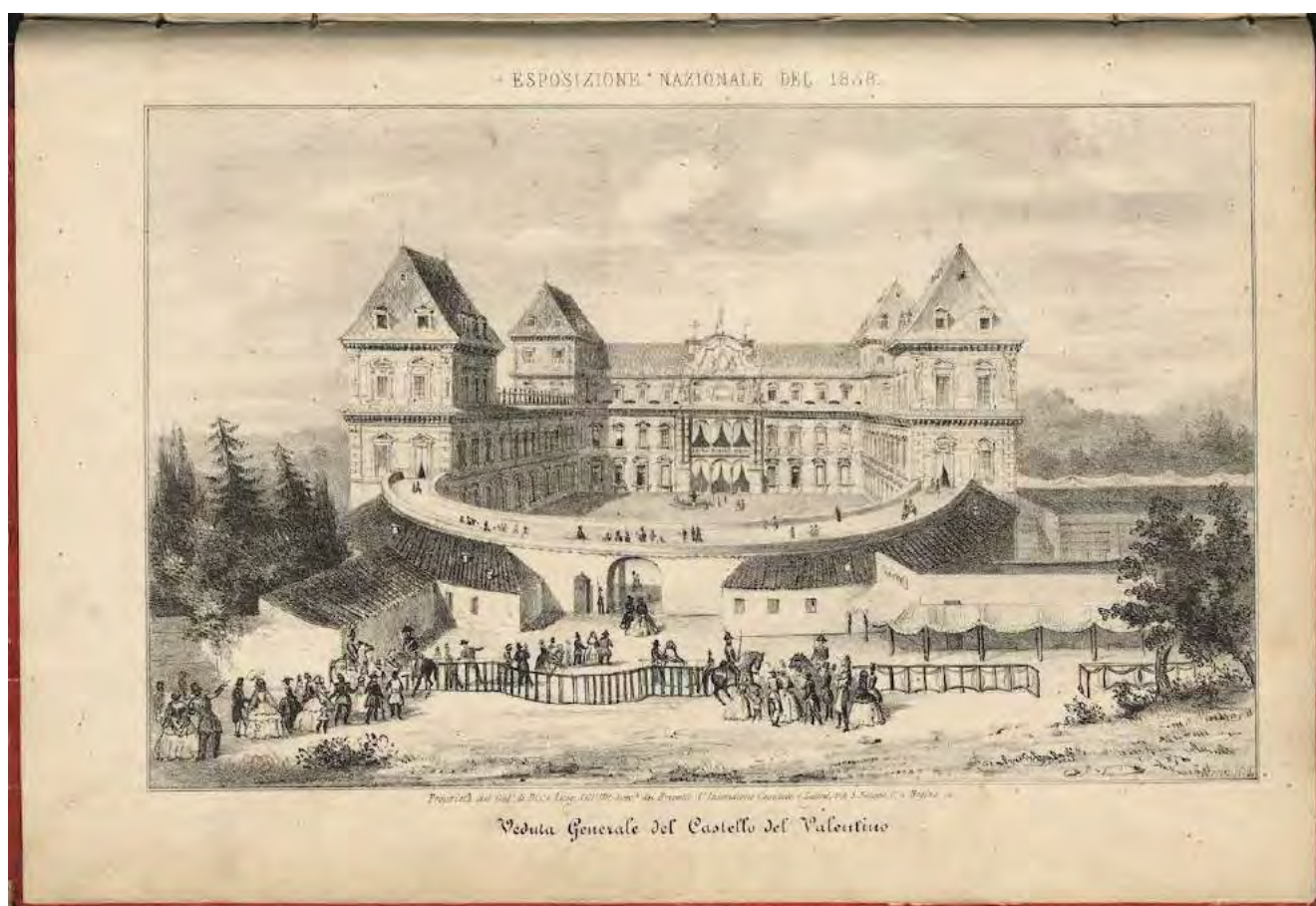
4: Esposizione Nazionale del 1858. Veduta generale del Castello del Valentino. Litografia «del Gab.o di dis.o e Litog. Dell'Uff. Spec.le dei Brevetti d'Invenzione Cappuccio e Latini», in Album descrittivo dei principali oggetti esposti al Real Castello del Valentino in occasione della sesta Esposizione Nazionale di prodotti d'industria nell'anno 1858 , Torino, Presso l'Ufficio speciale dei Brevetti d'invenzione con Gabinetto di Disegno industriale e Litografia diretto da G. Capuccio ingegnere e M. Latini, 1858.

distinte, legate ai militari, come il cappellano, e alla corte. I due padiglioni verso la città, unitamente alle camere ricavate nell'emiciclo, sono riservate al personale di servizio o ad altre figure che necessitano di trovare alloggio al Valentino. È il caso del «capo» o della disegnatrice dell'Orto Botanico, due personaggi legati all'ente della Regia Università degli Studi di Torino cui, già nel 1729, Vittorio Amedeo II aveva ceduto l'area a nord del palazzo. Scorrendo i documenti di archivio, il cappellano risiede nel padiglione sud-ovest, mentre la cappella è in quello di fronte, detto dell'Orto Botanico (perché confinante), in un locale non grande al piano terreno, collegato da due aperture alla retrostante sacrestia. Intitolata dalle carte ottocentesche al Beato Amedeo e alla Beata Margherita di Savoia, la cappella è stata da poco datata con riferimento a una prima scelta di Cristina di Francia, seguita da un più importante lavoro promosso dalla seconda Madama Reale Maria Giovanna Battista di Savoia Nemours [Cattaneo M.V., 2014 e 2017].