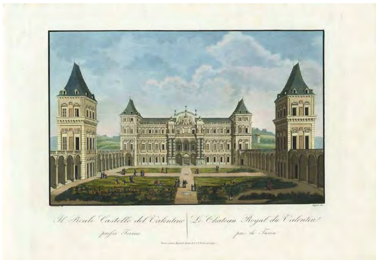
3: Il Reale Castello del Valentino presso Torino, incisione di Alessandro Angeli su disegno di Marco Nicolosino pubblicato in Vedute de i dintorni di Torino. Parte II delle XII vedute interne di detta Città , Torino, Reycend, 1824.

ed un terzo per la liscivazione», «due camere da letto per abitazione» 5 ; alle stesse funzioni residenziali e lavorative sono destinati anche alcuni spazi del secondo e del terzo piano dove sono ricavate «tre camere (...) ad uso abitazione» e un «camerone di stendaggio partito in due» 6 .