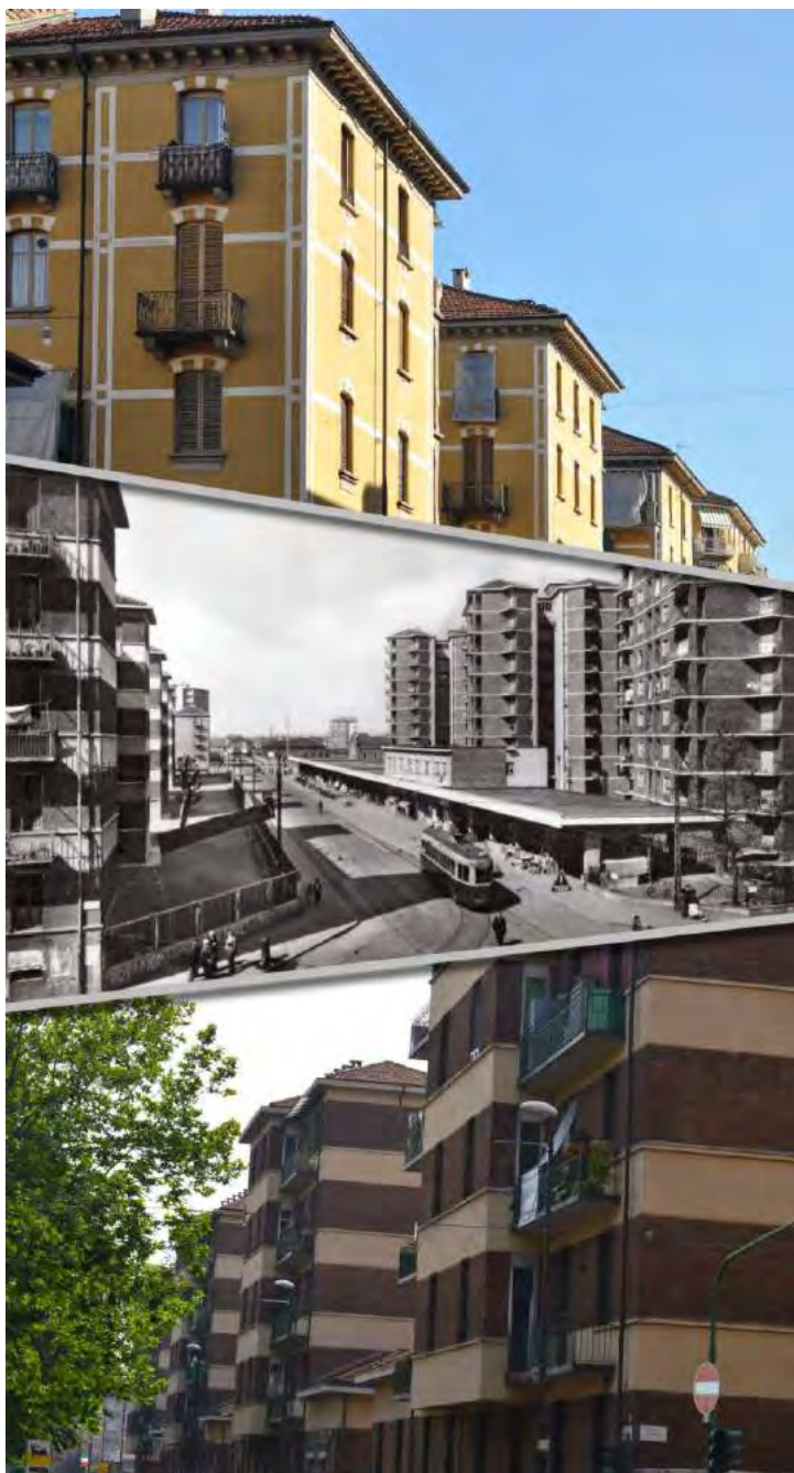
6: Il quartiere di edilizia popolare Cascina Colombè e il Quartiere 16 IACP progettato da Umberto Cuzzi nel 1927, in una vista degli anni cinquanta e in una odierna. Elaborazione grafica di Pia Davico.

Nella fase di saturazione del tessuto urbano che nel Novecento ha configurato una nuova immagine delle zone periferiche di Torino, non solo gli opifici, ma pure i complessi di case popolari sono stati i motori morfogenetici del nuovo assetto. Masse edificate di notevole valore ambientale per il loro 'ordine' urbanistico, in genere erano costituite da blocchi edilizi di grandi dimensioni organizzati in più isolati. Le architetture, pur adeguate a investimenti economici limitati, propongono un controllato rigore compositivo, spesso con esempi di alto livello progettuale. Un esempio già citato, pregevole per le decorazioni pittoriche di gusto Secessione viennese, è il quartiere "Cascina Colombè" in via Villar, uno dei primi realizzati in Torino (il "Q6" dell'Istituto Case Popolari), su progetto del 1910. Di maggior impatto urbano, per dimensioni e novità tecnologiche, è poi il Quartiere 16° IACP "Vittorio Veneto", celebrato dalla pubblicistica coeva, nel grande quadrilatero prospettante corso Grosseto, su progetto di Umberto Cuzzi (1927).