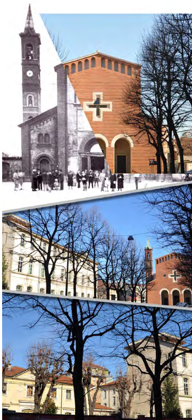
4: La chiesa parrocchiale di Madonna di Campagna prima del bombardamento e nella configurazione odierna, progettata nel 1952, affiancata dalle due scuole del 1880 e 1887. Elaborazione grafica di Pia Davico.

Nonostante la difficoltà nel ritrovare la configurazione ambientale del borgo, ricco di spazi d'incontro comunitari oggi perduti, è stranamente vero che Madonna di Campagna risulta invece uno dei quartieri torinesi in cui gli abitanti si identificano, costituendone la forte identità