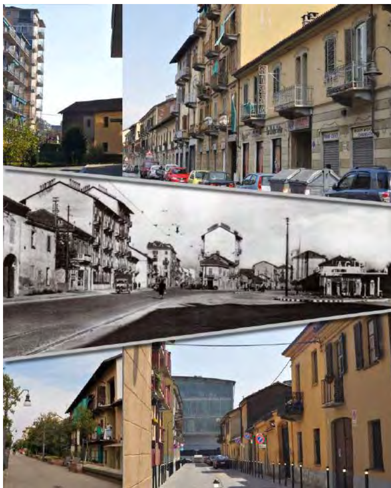
3: Scorci con le tipiche case delle due realtà borghigiane, oggi e in un'immagine di inizio anni cinquanta del Novecento. Elaborazione grafica di Pia Davico.

città di Torino. Una storia in cui i segni che permangono nel costruito, al di là di ogni giudizio estetico, possono dare un significato alle tessere di un mosaico, fondamentali come riferimenti della cultura locale [Davico, Devoti 2017].