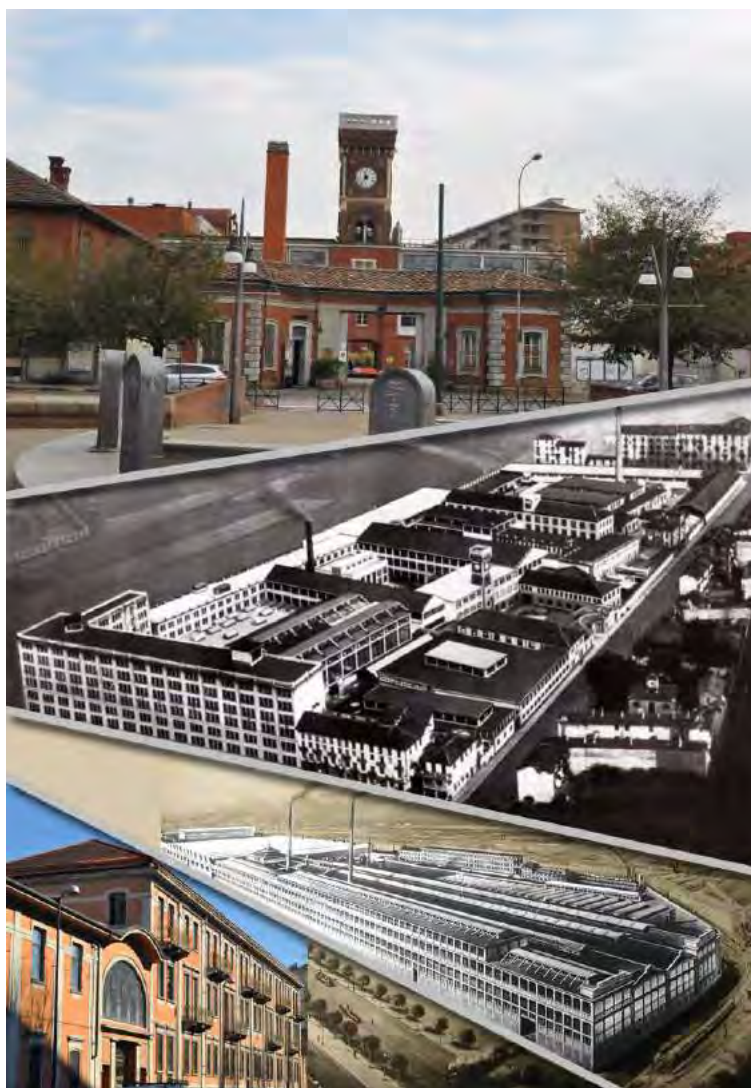
5: L'ingresso odierno delle ex Concerie Italiane Riunite e il complesso quando era attivo; le Officine Savigliano ; l'ingresso dell'ex fabbrica Superga . Elaborazione grafica di Pia Davico.

l'aggregato di case antiche si affaccia su un nuovo settore creato dagli interventi urbanistici sulla Spina 3 . Un settore urbano dall'identità autonoma, con edifici isolati, alti e colorati, che configura un contrasto netto tra i due ambienti in affaccio, generando lungo la via una totale cesura. Lungo via Cesalpino, già sede del sedime ferroviario, si aprono invece interessanti visuali sull'antico tessuto urbano, in particolare sulla fascia ovest costituita dal retro delle case di via Giachino. In una ideale ricostruzione dell'antico percorso che univa borgata Vittoria a borgo Madonna di Campagna, si può immaginare il nucleo assiato sulle vie Stradella e Cesalpino (nonostante la cesura, funzionale e visiva, dell'impattante snodo stradale a nord-ovest) in continuità con il settore incardinato sull'asse di via Venaria.