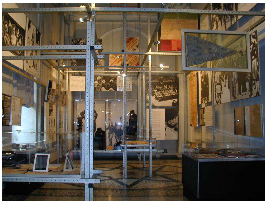
Allestimento del Museo della Resistenza in palazzo Carignano a Torino (© studio Gianfranco Cavaglia)