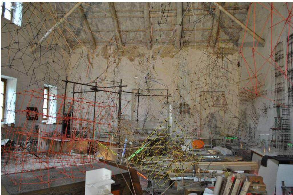
Atelier di Leonardo Mosso a Pino Torinese