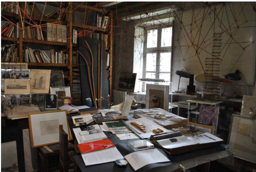
Una sala dell'Istituto Alvar Aalto – MAAAD (Museo dell'Architettura Arti Applicate e Design) a Pino Torinese