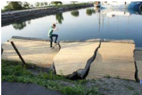
• Kavakava Architects | The Pier | 2011