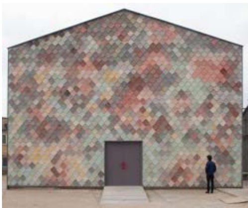
• Assemble | Yardhouse | 2014