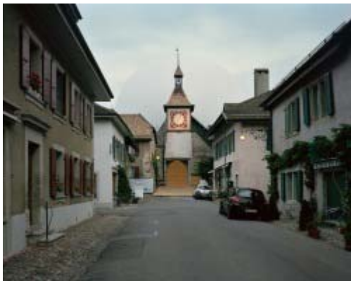
• Atelier Alice / EPFL | Luna St Prex | 2012