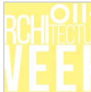
OII+ ARCHITECTURE WEEK