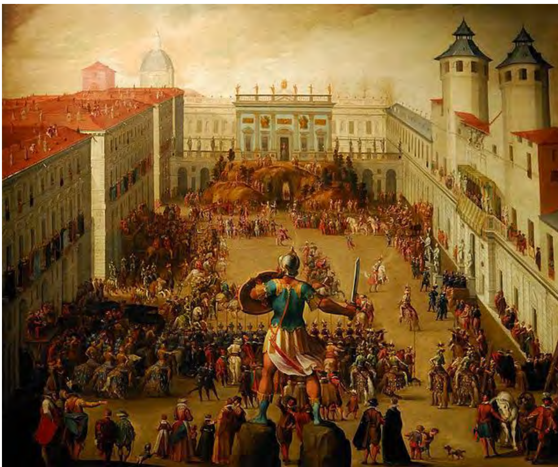
Fig. 4 Antonio Tempesta, Torneo in Piazza Castello per le nozze di Vittorio Amedeo I e Cristina di Francia , 1620, Galleria Sabauda Torino, ©Musei Reali

scenografico il prospetto del castello 15 abbellito da drappi e architetture effimere, dove prendevano posto i sovrani per assistere alle celebrazioni.