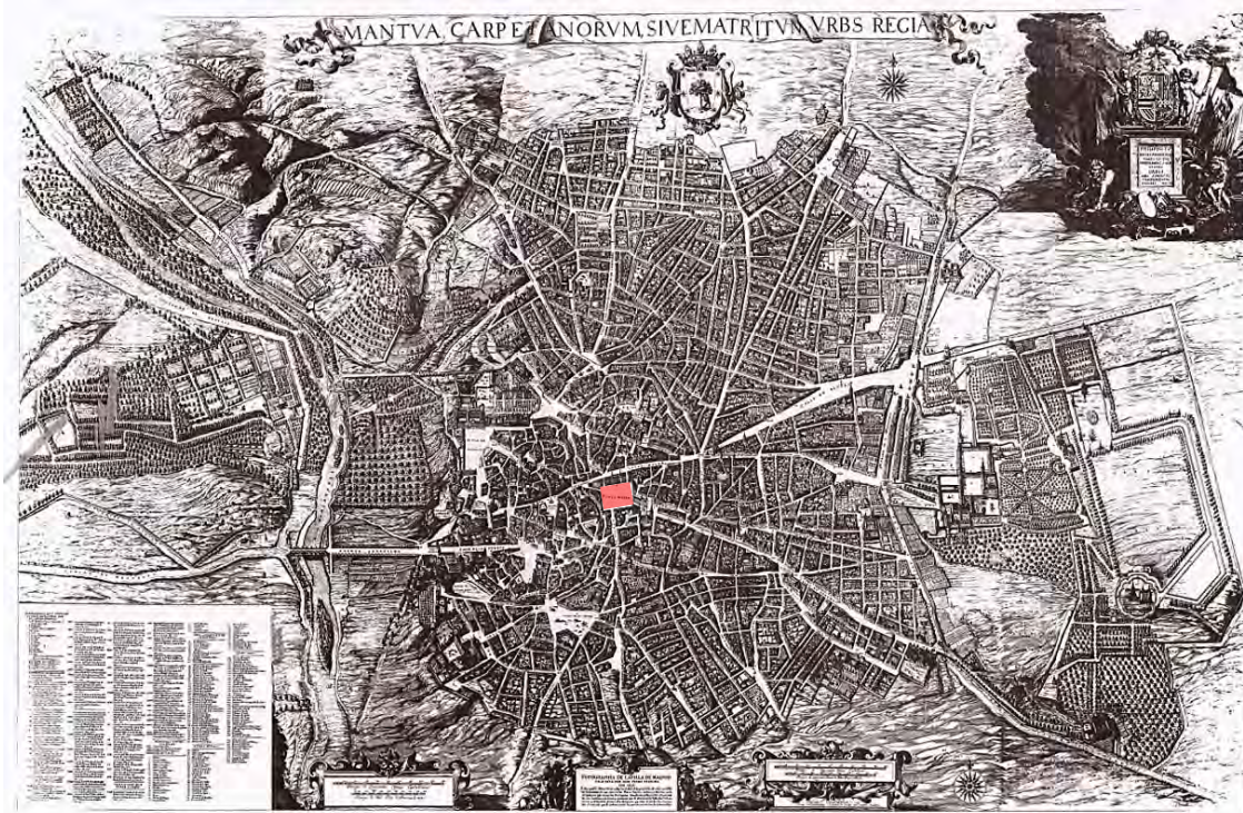
Fig. 1 Topographia de la Villa de Madrid en el Plano de Teixeira o de Texeira (Anversa 1656), Archivio Digitale della Biblioteca Nazionale Spagnola. In rosso la plaza Mayor

politico – sociale, dove l’approccio artistico diveniva il deus ex machina della pratica del potere: la vita del cittadino si animava, permettendo sfuggire dai problemi quotidiani, mentre l’immagine del monarca si consolidava assicurandosi rispetto da parte degli stessi abitanti.