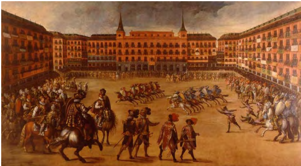
Fig. 2 Juan de la Corte, Juego de Cañas en la Plaza Mayor de Madrid, Madrid 1623 . l Museo de Historia de Madrid .

Pur essendo utilizzata per altre celebrazioni, come auto da fè o juegos de cañas , plaza Mayor perde così una delle sue caratteristiche più amate dal popolo e dalle autorità madrilene, fino al 1725, anno in cui Filippo V restaura l'uso delle corride, restituendo alla piazza il suo ruolo centrale all'interno delle feste 11 .