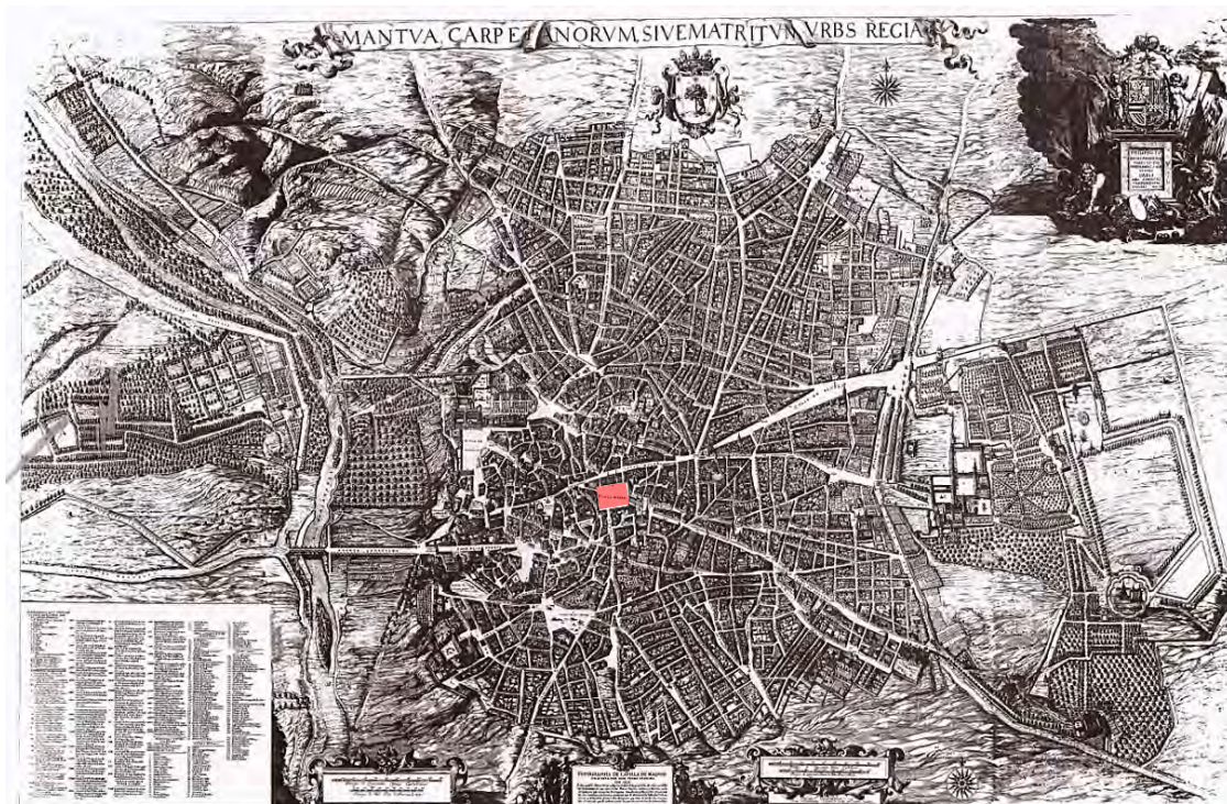
Fig. 1 Topographia de la Villa de Madrid en el Plano de Teixeira o de Texeira (Anversa 1656). In rosso la plaza Mayor

politico – sociale, dove l’approccio artistico diveniva il deus ex machina della pratica del potere: la vita del cittadino si animava, permettendo sfuggire dai problemi quotidiani, mentre l’immagine del monarca si consolidava assicurandosi rispetto da parte degli stessi abitanti.