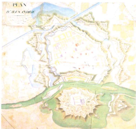
Fig. 1- 1808. François Charles Louis, Chasseloup-Laubat, Plan d'Alexandrie . Versione del progetto realizzato con la testa di ponte sulla riva opposta del Tanaro (Marotta, 1991: p. 57, Icon. 85)

Chasselou sostenne di essersi ispirato direttamente al “ gran maître Sébastien Le Prestre de Vauban ” 3 per la delineaione delle sue proposte progettuali.