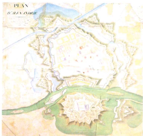
Fig. 1- 1808. François Charles Louis, Chasseloup-Laubat, Plan d'Alexandrie . Versione del progetto realizzato con la testa di ponte sulla riva opposta del Tanaro (Marotta, 1991: p. 57, Icon. 85)

Chasselou sostenne di essersi ispirato direttamente al “ gran maître Sébastien Le Prestre de Vauban ” 3 per la delineaione delle sue proposte progettuali.