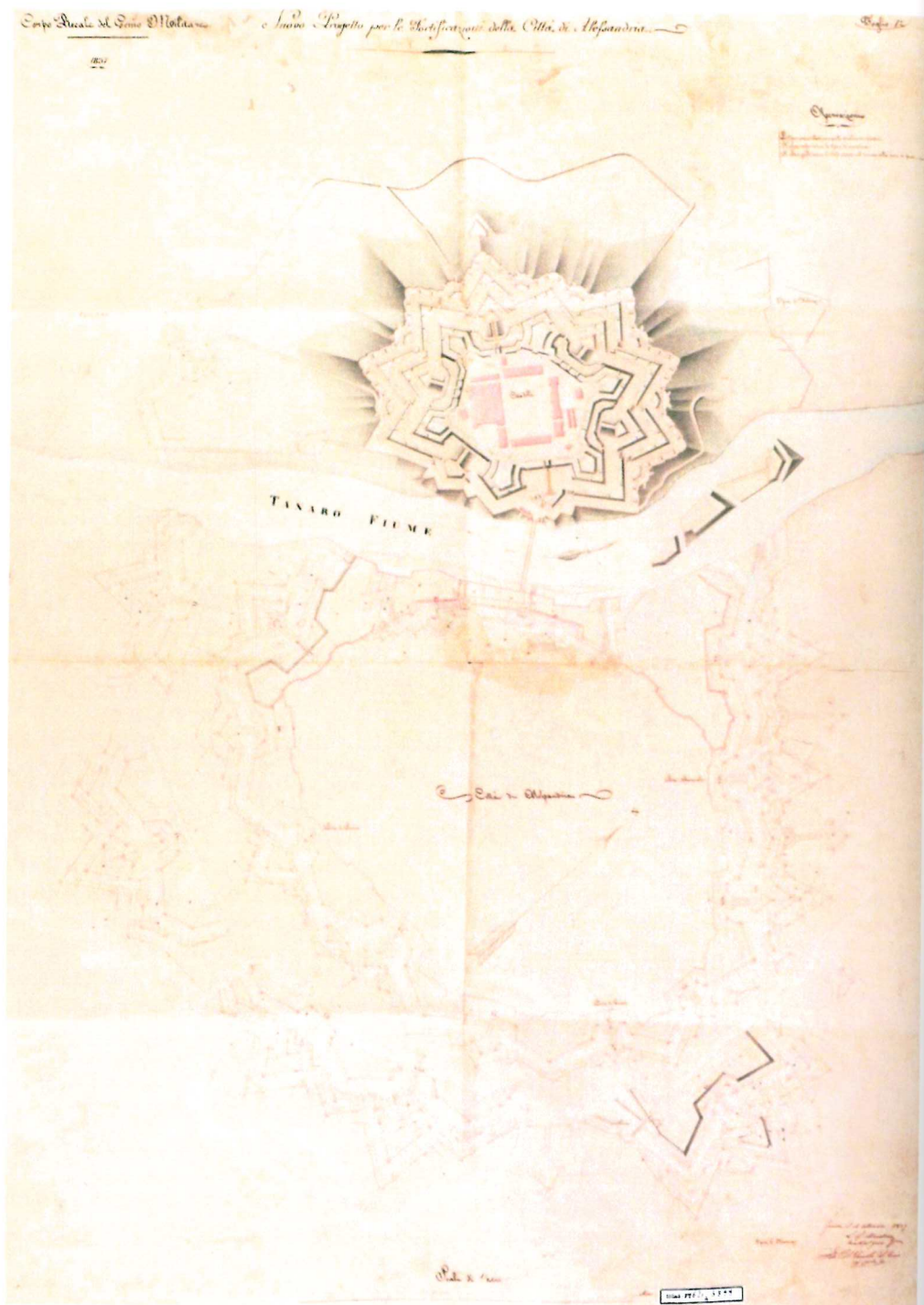
Fig. 3- 1837, 16 settembre. Nuovo Progetto per le Fortificazioni della Città di Alessandria , firmato "Ten. del Genio L. F. Menabrea", vistato "Col. del Genio A. Chiodo" (Marotta, 1991: p. 64, Icon. 75)