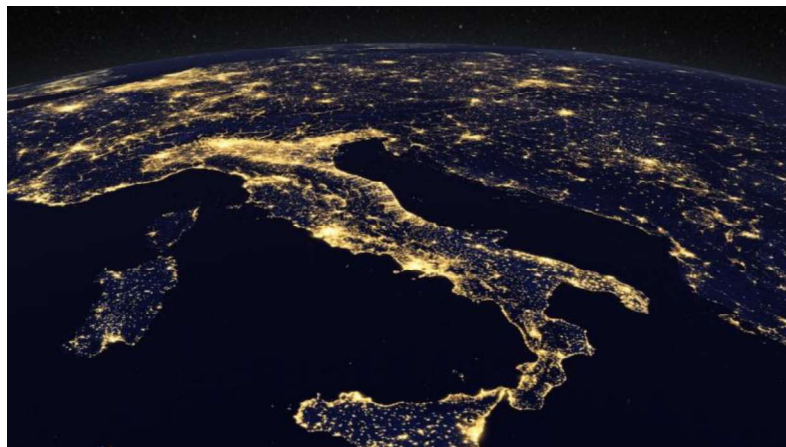
Figura 1. Immagine satellitare dell'Italia ( http://svs.gsfc.nasa.gov/vis/a010000/a011100/a011146/index_svs.html ).

Esiste una stretta connessione tra l'incremento demografico in prossimità dei corsi idrici e il decremento della qualità e della biodiversità delle acque (Vorosmarty et al., 2010). Le dinamiche demografiche spaziotemporali sono considerate un importante aspetto per la valutazione e la mitigazione del pericolo di inondazione. L'utilizzo di dati satellitari di luminosità notturna permette una mappatura accurata, diretta e su ampia scala dei processi di urbanizzazione e quindi delle dinamiche demografiche (Small et al., 2005). Recenti studi hanno evidenziato, su scala globale, un legame tra l'aumento di luminosità notturna e l'intensificarsi di danni economici causati da eventi alluvionali (Ceola et al., 2014). Il presente studio si pone l'obiettivo di effettuare un'analisi spaziale e temporale della pressione antropica sul territorio italiano mettendo in relazione dati di tipo idromorfologico e dati satellitari di luminosità artificiale notturna.