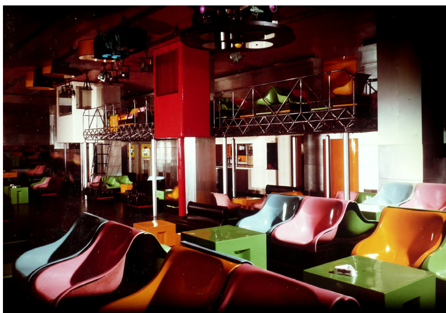
Fig. 5. Interno del Piper, Gruppo STRUM, 1965.