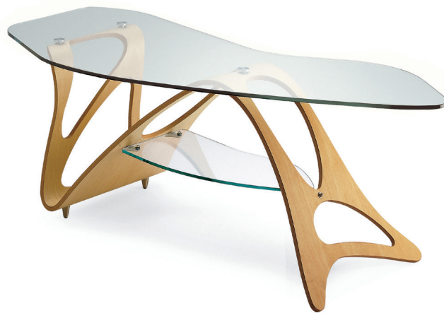
Fig. 2. Tavolino per Luisa Ponti e Luigi Licitra, Carlo Mollino, prod. Apelli e Varesio, 1949-50, (riedizione, Archivio Zanotta Nova Milanese).

Si può verosimilmente ipotizzare che alla stesura del programma abbiano contribuito tanto l'humus cui si è accennato, tanto i due docenti che prenderanno in carica l'insegnamento a partire dall'anno accademico seguente, Ottorino Aloisio, (già incaricato di scenografia dal 1939) e Carlo Mollino, da qualche anno incaricato di Decorazione. Rispettivamente al primo e secondo anno dell'insegnamento, i due rappresentano bene i versanti tra i quali si muove la progettazione di interni in ambito torinese. Entrambi venuti alla ribalta soprattutto in occasione di concorsi pubblici, più vicino alle avanguardie "istituzionalizzate", curioso elaboratore dei modi tedeschi di Mendelsohn, Steiner e altri, il primo 13 , il secondo attivo nella progettazione di interni fin dagli anni Trenta per committenze facoltose quanto eccentriche (fig. 2), influenzato dalle letture della pubblicistica del Surrealismo ma attento ricettore sia dei tardivi strascichi Art Nouveau, sia dei precoci studi su periodi storici poco in sintonia con il Fun-