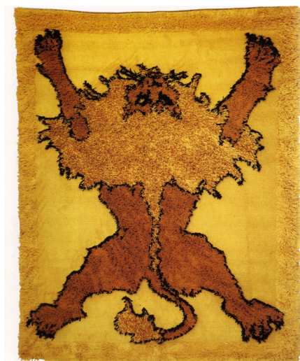
Fig. 4. Tappeto Tapileo, Roberto Gabetti, Aimaro Isola, prod. Paracchi, 1970, (Archivio Gabetti e Isola, Studio Isola).