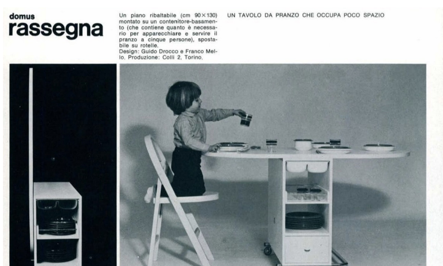
Fig. 8. Tavolo da Pranzo ribaltabile, Guido Drocco, Franco Mello, prod. Colli 2, 1973 (“ Domus ” 572, ottobre 1973).

A questo punto i gruppi dotati di maggiore esperienza, come Strum, grazie alle frequentazioni delle gallerie – a Torino Sperone – dove trionfava la Pop Art, avevano già lanciato progetti che invece di adattare forme più o meno tradizionali ai nuovi materiali plastici ne celebravano la mitopoiesi, complici piccole aziende disposte a correre rischi per emergere fuori dal circuito milanese: del 1966 sono le sedute Tornerai e il mitico Pratone , entrambe per Gufram, nonché il Piper di Torino (1968, Figg. 5 ), in collaborazione con Piero Gilardi ( Figg. 6 ) e Bruno Munari, locale notturno che vede alternarsi musica, reading di poesia e retate della polizia 25 . Il gruppo italo-greco Studio 65 si affaccia alla casa anticonformista - dopo aver sperimentato in facoltà le megastrutture e l’utopismo archi-