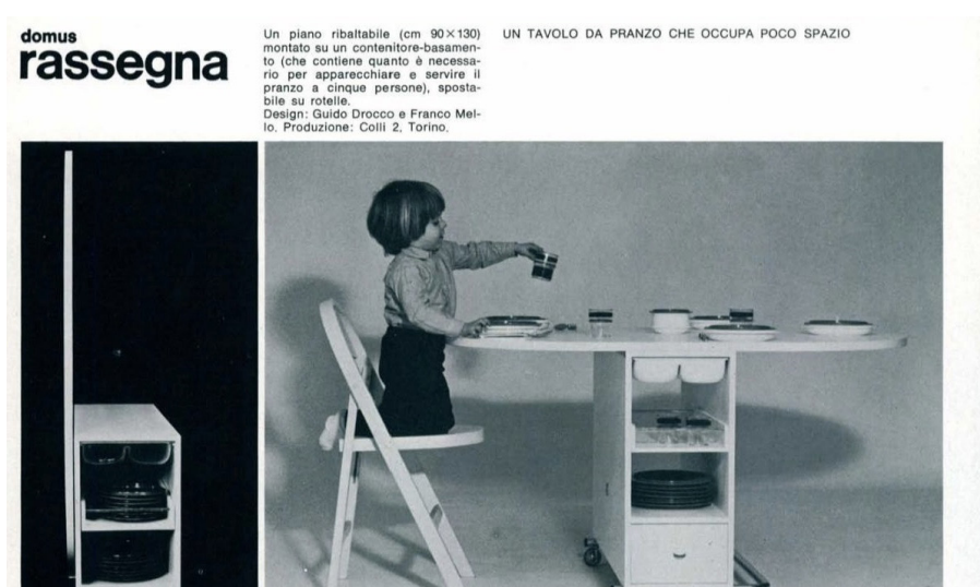
Fig. 8. Tavolo da Pranzo ribaltabile, Guido Drocco, Franco Mello, prod. Colli 2, 1973 (“ Domus ” 572, ottobre 1973).

A questo punto i gruppi dotati di maggiore esperienza, come Strum, grazie alle frequentazioni delle gallerie – a Torino Sperone – dove trionfava la Pop Art, avevano già lanciato progetti che invece di adattare forme più o meno tradizionali ai nuovi materiali plastici ne celebravano la mitopoiesi, complici piccole aziende disposte a correre rischi per emergere fuori dal circuito milanese: del 1966 sono le sedute Tornerai e il mitico Pratone , entrambe per Gufram, nonché il Piper di Torino (1968, Figg. 5 ), in collaborazione con Piero Gilardi ( Figg. 6 ) e Bruno Munari, locale notturno che vede alternarsi musica, reading di poesia e retate della polizia 25 . Il gruppo italo-greco Studio 65 si affaccia alla casa anticonformista - dopo aver sperimentato in facoltà le megastrutture e l’utopismo archi-