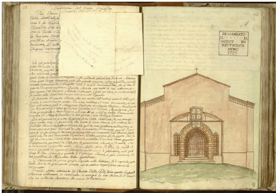
Fig. 5 Archivio della Curia Vescovile di Asti: Santa Maria Ausiliatrice di Viatosto, prospetto, Stefano Giuseppe Incisa, ca.1806

E' verosimile che a fine XI secolo (1094-1095) il luogo di Cortazzone, sede di San Secondo, sia