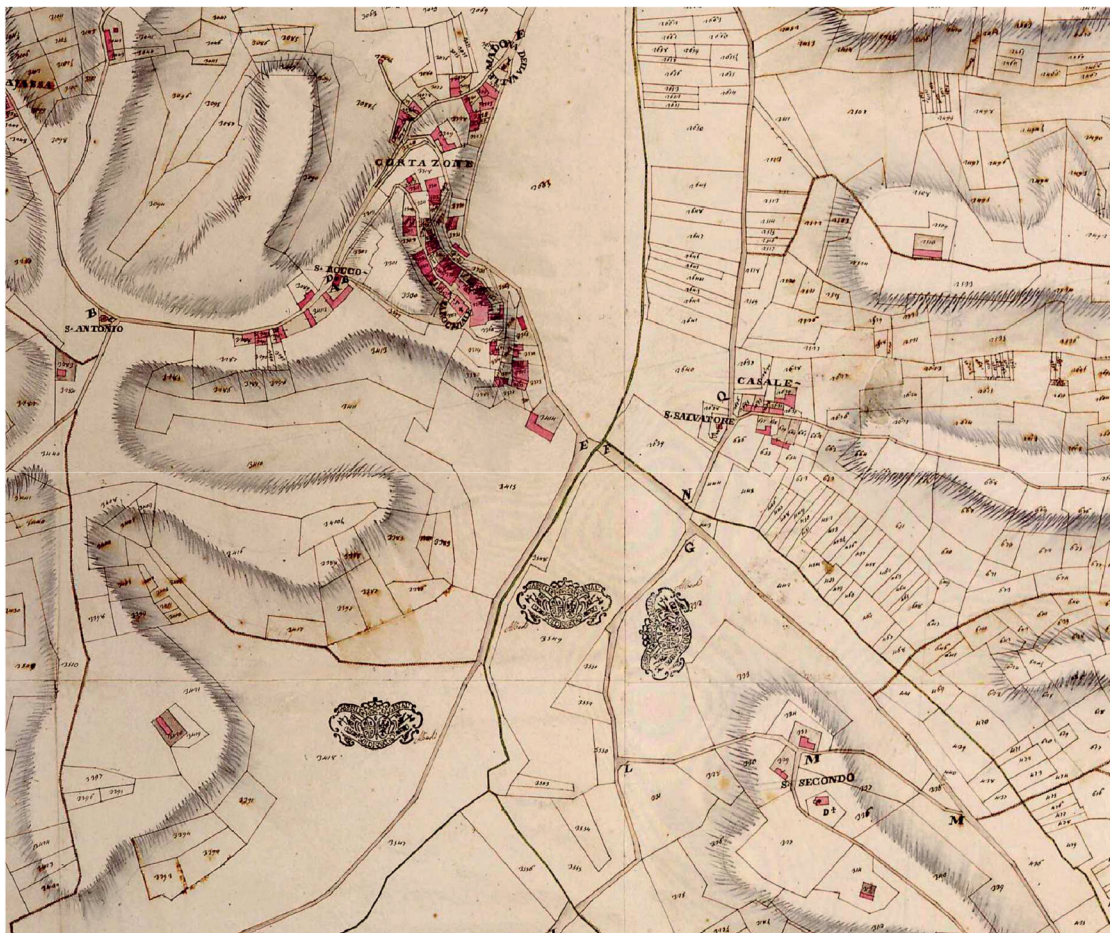
Fig. 3 Archivio di Stato di Torino: dettaglio della "Mappa del territorio di Cortazzone, estrata dall'originale per copia.", Carlo Giuseppe Molina, 26 maggio 1769. Nella mappa la chiesa medievale di S. Secondo è in basso a destra

L'effetto cromatico, però, non è il principio alla base delle scelte sui materiali attuate da maestranze e committenti: ne è il risultato. Non è un argomento di secondaria importanza, perché in alcuni dei casi trattati non ci si serve solo delle rocce disponibili nelle immediate vicinanze del cantiere, come da prassi abituale. Al contrario, certe forniture possono venir