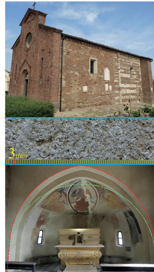
Fig. 7 Buttigliera (AT), antica località di Mercuriolium, S. Martino. Scorcio su fronte e lato sud, macrofotografia della calcarenite di riuso adoperata (con scala millimetrica di riferimento), interno abside.