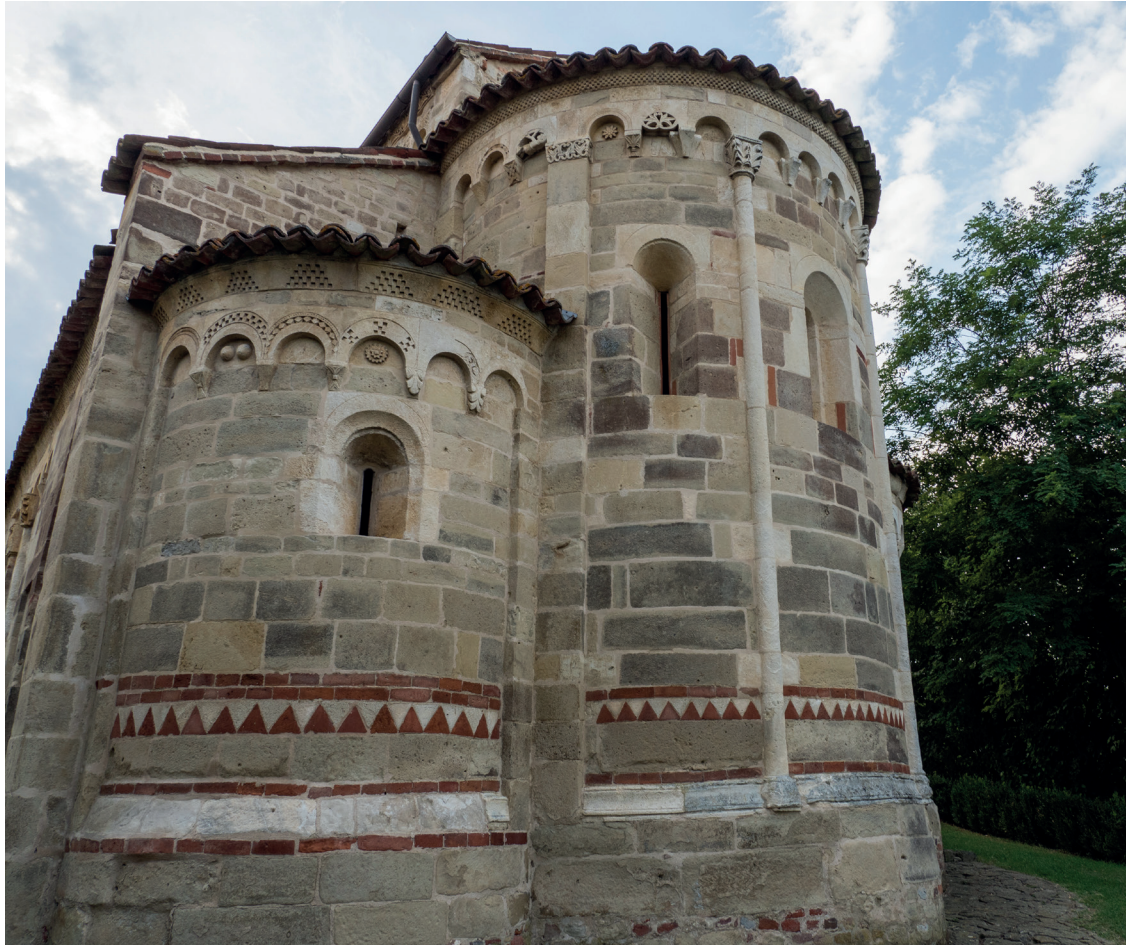
Fig. 4 Cortazzone (AT), S. Secondo. Absidi

Sono ancora in fase di svolgimento indagini volte a definire il quadro complessivo di litotipi, provenienze ed impieghi nel Piemonte centrale medievale. Occorre, però, anticipare che al polo estrattivo vignalese, ad est dell'area, si contrappone un secondo polo ad ovest, fra Murisengo e Verrua Savoia, fortemente indiziato per la coltivazione di una calcarenite