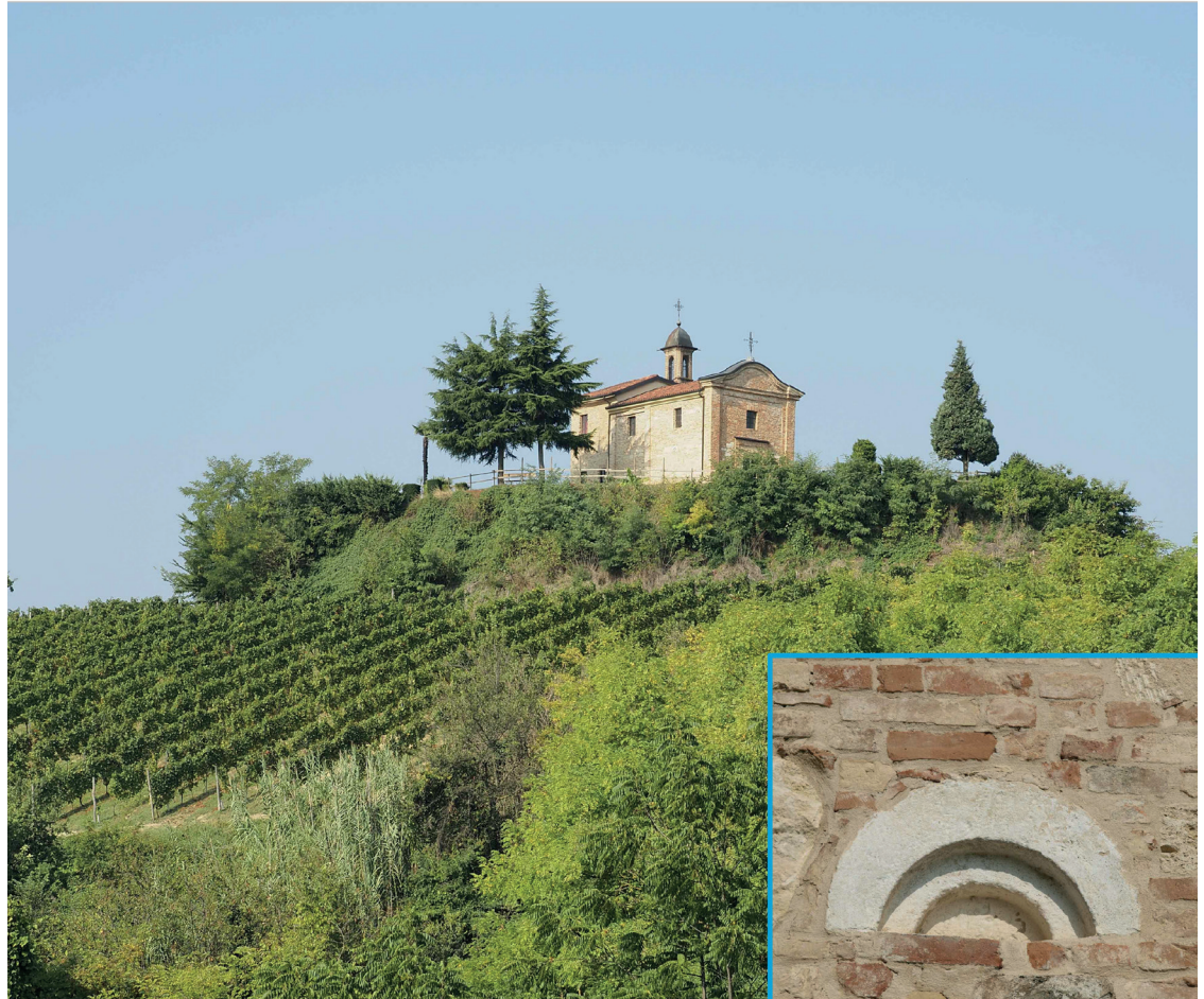
Fig. 8 Cunico (AT), antica località di Ponengo, S. Martino. Panorama e particolare di archivolto relativo all’impianto di XII sec. esposto nei muri di fine Seicento

2. ci sono molti interventi tre-quattrocenteschi sulle absidi, da approfondire