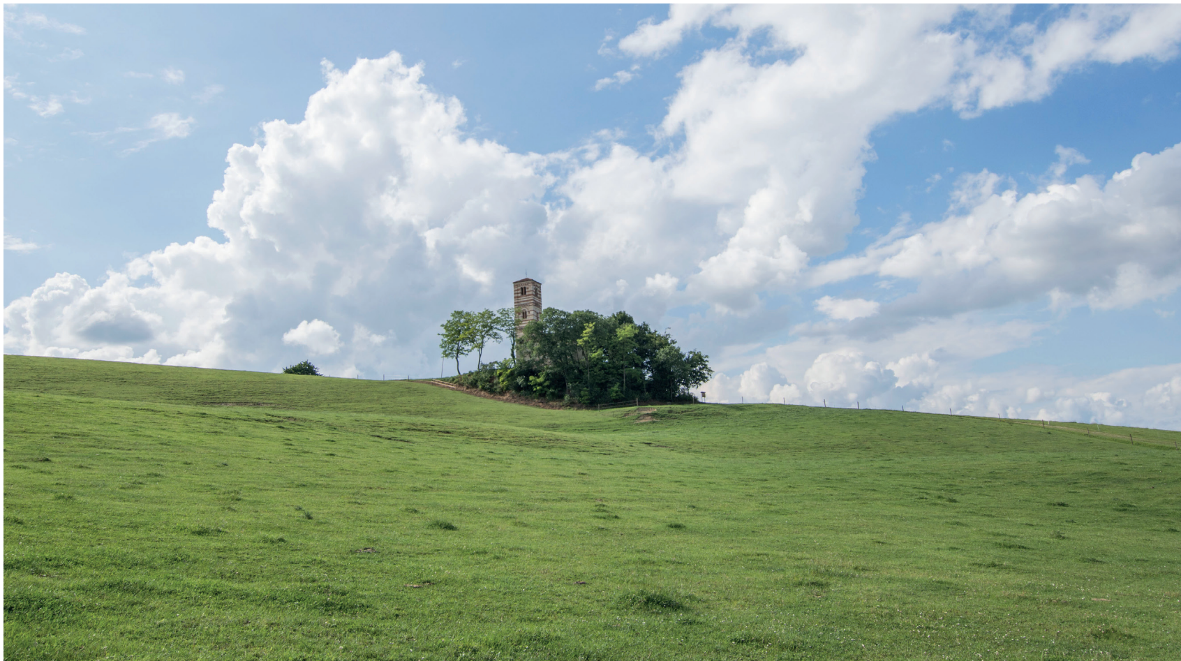
Fig. 2 Montechiaro (AT), Ss. Nazario e Celso. Panorama