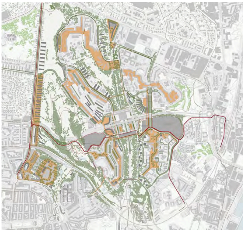
Figura 2 | Progetto per il Parco Ospedaliero Orientale, Fonte: J. P. Falcão de Campos Arquitecto e NPK Arquitectos Associados.

Il primo scenario persegue l'idea che Chelas sia un grande sistema che oggi come un tempo può costruirsi a partire dai suoi 'spazi tra le cose': le aree residuali, i luoghi che intervallano il costruito, i grandi assi viari e gli spazi costieri abbandonati. Un enorme campo operabile, fatto di « islands, surrounded by the almost inaccessible sea of motorways » (Alves, 2001: 24). Entro questo scenario, è il mare l'elemento dominante dell'insieme, qualcosa di denso, ricco, il contrario di un vuoto. Al contempo, le 'isole' tra loro differenti influenzano 'coste' e 'mare' stesso, determinando paesaggi e funzionamenti diversi fra loro. In questa direzione vanno alcune delle progettualità in corso. Ad esempio il progetto per il parco dell'Ospedale Orientale che è stato redatto nel 2009 dall'architetto João P. Falcão De Campos, insieme allo studio paesaggista NPK (fig. 2). Un progetto che, nonostante presenti molte criticità dovute a previsioni di densificazione urbana e investimenti pubblici e privati difficilmente ipotizzabili allo stato attuale, si sforza di immaginare ancora Chelas come unicum .