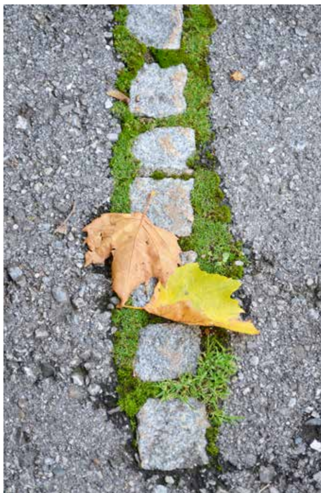
“Intarsi”: contaminazioni nel suolo in un parcheggio a Bezau (Vorarlberg, Austria).

Qui, nella sede del Vorarlberger Architektur Institute, il 28 ottobre scorso si è chiusa la