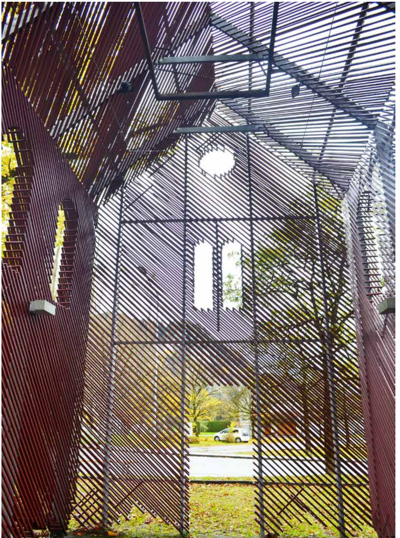
"Tentativo di cristallizzazione": architettura-scultura del transitorio a Hohenems (Vorarlberg, Austria).