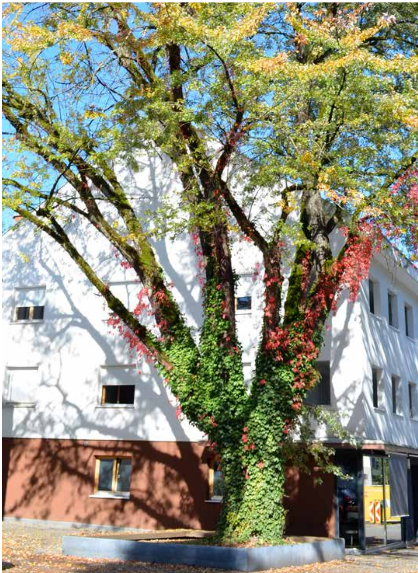
"Verde verticale": pennellate autunnali, Marktstraße, Dornbirn (Vorarlberg), Austria (fotografia di Alessandro Mazzotta, 2017).