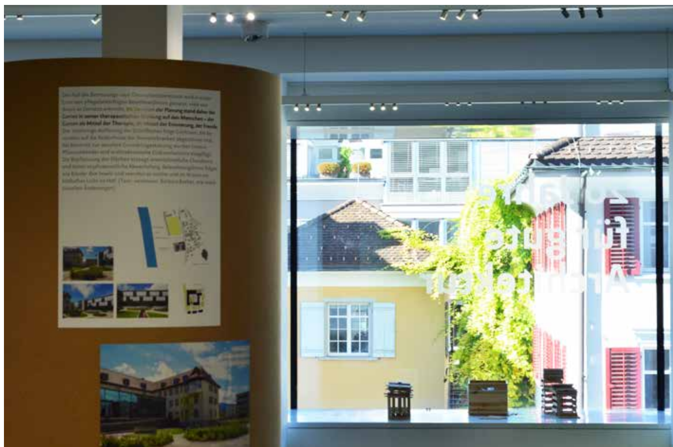
"Inside-outside": allestimento della mostra "Landschaftsräume. Zeitgenössische Landschafts-architektur in Vorarlberg" (13 luglio-28 ottobre 2017) al Vorarlberger Architekture Institute, Dornbirn.

Proprio anche dal recepimento dei molti contributi di riflessione recente che – dal punto di vista della rinnovata attenzione al rapporto tra costruito e ambiente – documentano l'inconsistenza del cliché di interpretazione del Funzionalismo come monolite concettuale omogeneo, potrebbe allora derivare una interessante