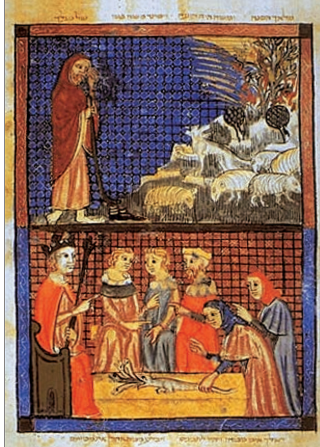
Una pagina della Haggadah di Sarajevo

“Serif aveva aggrottato le sopracciglia. ‘Ho forse scelta? Io sono il kustos . Quel libro è sopravvissuto per cinque secoli... se pensate che sia di-