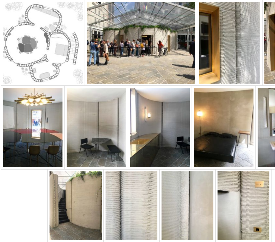
Immagine di copertina: © 2018 CLS Architetti

continuano ancora ad accompagnare la nostra vita, in uno spazio racchiuso in grigie pareti dalle organiche forme. L'architetto ha dunque programmato la stampante 3D in maniera che potesse modellare un oggetto, che ha prodotto uno spazio in cui, forse grazie all'arredo che il Salone del Mobile continua a celebrare, riusciamo a sentirci ancora a casa.