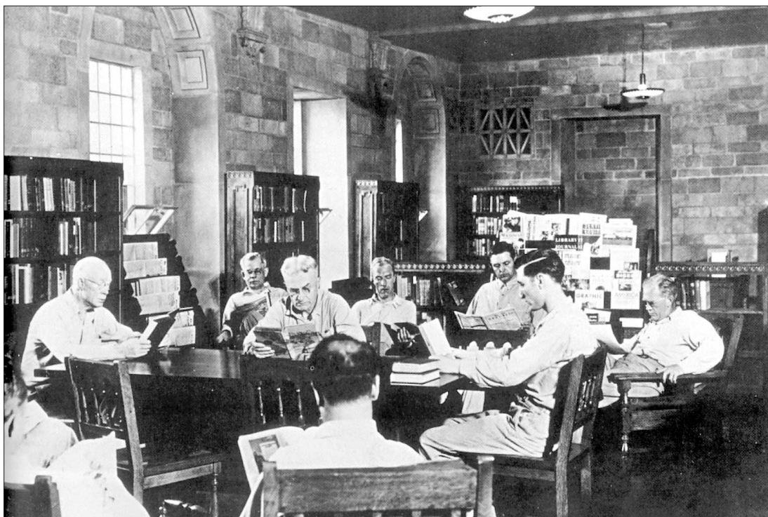
Scena di lettura nella biblioteca del penitenziario di Terre Haute (Stato dell'Indiana), in una fotografia degli anni Cinquanta

La cultura è ciò che consente effettivamente la riabilitazione sociale del detenuto, tanto da portare una Commissione d'inchiesta sulla situazione delle biblioteche carcerarie francesi a dichiarare che "noi non crediamo più al reinserimento