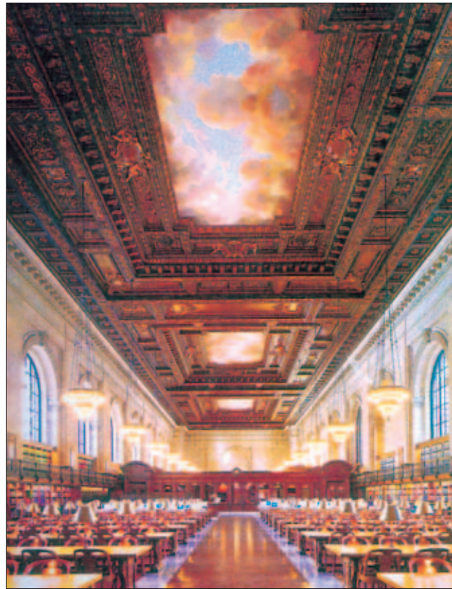
La Rose Main Reading Room della New York Public Library

Una conferenza però rivela a Short aspetti spiacevoli del suo carattere: “Ovviamente sapevo già del suo chauvinismo. Qualunque studente di biblioteconomia sa bene che Dewey dedicò più spazio alla YMCA che a tutto il buddhismo orientale. Ma non immaginavo che fosse