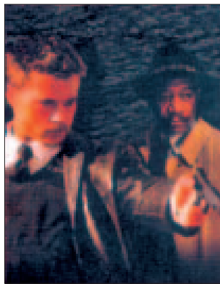
Le immagini che illustrano questa pagina sono tratte dal film Seven di David Fincher (1995)

Un esempio del tutto simile è costituito dal film Seven , diretto da David Fincher nel 1995. La biblioteca ha qui un ruolo cruciale poiché il detective Somerset (Morgan Freeman) intuisce che è proprio lì che deve cercare la soluzione del caso. Fin dall'inizio del film le citazioni di libri in riferimento agli omicidi del serial killer sono numerosi: il Paradiso perduto di John Milton, Il mercante di Venezia di Shakespeare, la Divina commedia . Somerset cerca nei libri la trama che il killer sta seguendo, e usa quindi frequentemente la biblioteca, dove pare essere di casa, poiché viene riconosciuto e salutato amichevolmente dai guardiani che lo accolgono anche in orario serale. Proprio controllando i prestiti della bi-