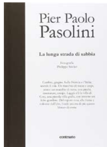
Pier Paolo Pasolini La lunga strada di sabbia Edizioni Contrasto, 2014 ISBN 978-88-6965-541-8