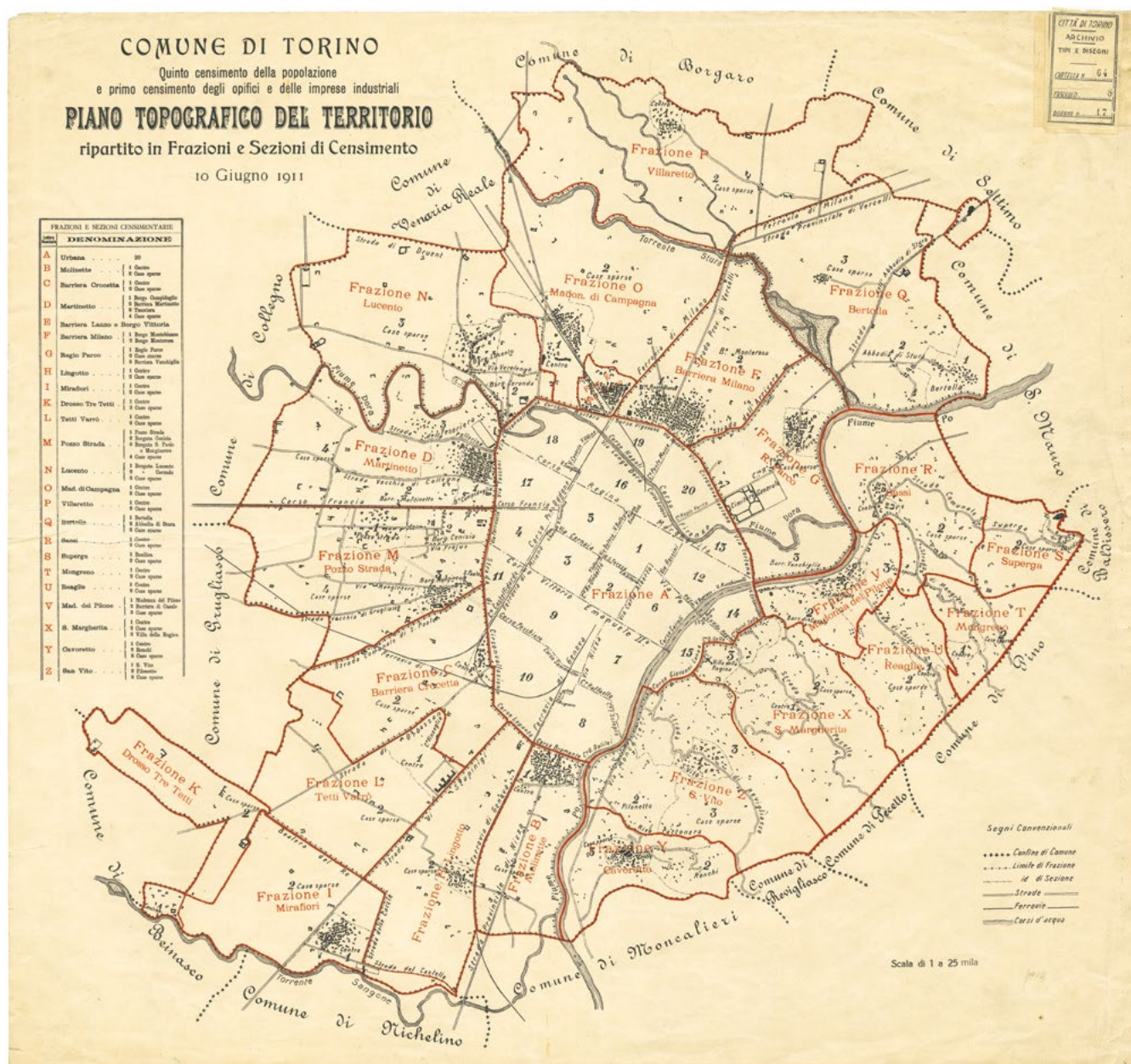
Comune di Torino, Comune di Torino. Quinto censimento della popolazione e primo censimento degli opifici e delle imprese industriali. Piano Topografico del Territorio ripartito in Frazioni e Sezioni di Censimento, 10 giugno 1911, 1911. ASCT, Tipi e disegni, 64.8.17[1].

anni fa palesi, tagli nel tessuto urbano, o se si preferisce, di questi margini ai comparti urbani, ormai storicamente consolidati. Questo ingenera, non è opinione solo nostra, una indubbia maggiore fluidità dei processi di ridefinizione insediativa lungo le vecchie linee di divisione, ma comporta in parallelo una maggiore difficoltà di identificazione delle “parti” di città, ingenerando un’illusoria percezione di uniformità, di indifferenziazione e, come contraltare, l’abbandono di quella che gli anglosassoni definiscono come site specificity , assai più prosaica interpretazione dell’inutilmente aulica e abusata indicazione del genius loci . Questa perdita identitaria volge a favore di una vaga connotazione genericamente “urbana” o peggio