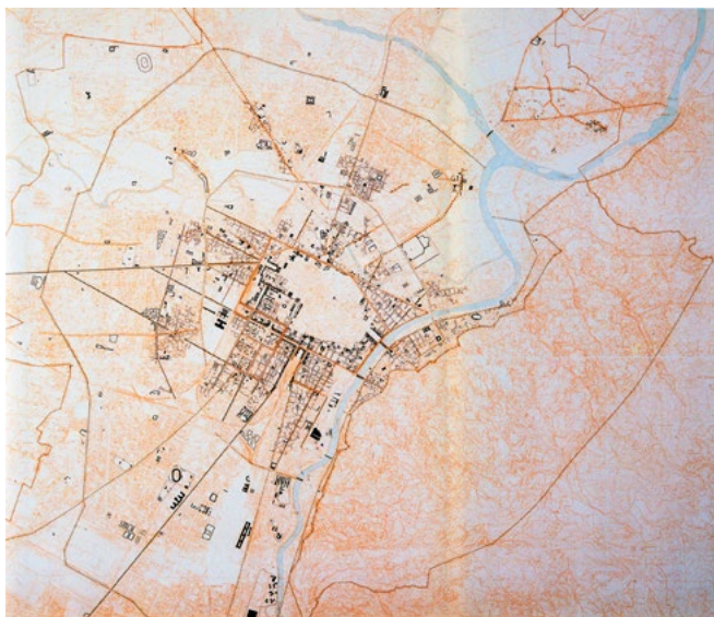
La struttura storica della città esterna al nucleo centrale (da Vera Comoli, Micaela Viglino (a cura di), Qualità e valori della struttura storica di Torino , «Quaderni del Piano», Città di Torino, Torino 1992, pp. 56-58).

In sede odierna, lo studio dei luoghi ha utilizzato l’abbinamento tra la storia e la metodologia tipica del Rilievo urbano, una disciplina dalle variegate competenze e di difficile definizione, se non in rapporto al più tradizionale rilievo architettonico. Il processo conoscitivo critico del rilievo, infatti, nel passaggio di scala dall’edificio