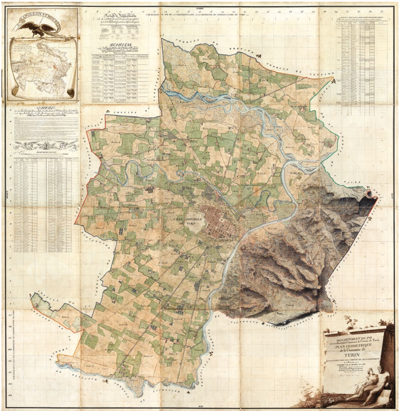
Giovanni Battista Sappa, Ville impériale de Turin, in Département du Po, Arrondissement Communal & Canton de Turin, Plan géométrique de la Commune de Turin, Levé en exécution de l'arrêté du 12 Brumaire an II, Terminé le 12 Nivose an XIII, 1804-05. ASTO, Riunite, Finanze, Catasti, Catasto Francese, Torino.

tratto per Modane, che definisce l'ansa di chiusura del borgo della Crocetta; «di Milano», a sancire il discrimine, per anni inviolabile, tra il Borgo Madonna di Campagna e il nucleo che la salda alla città rappresentato della borgata della «Barriera di Lanzo» (qui così indicata, ma che sarebbe meglio riconoscere come Borgata Vittoria), da una parte, e la «Barriera di Milano» (ancora una volta Borgate Montebianco e Monterosa, per impiegare la dizione più corretta) dall'altra; e infine «di Genova», a separare il