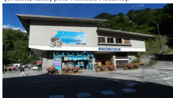
Figura 8. La Galerie Hydraulica a Le Planay (Savoia, Francia).

Per quanto attiene in particolare il patrimonio dell'idroelettricità, sono state di recente avviate una serie di attività volte a incrementare la sua fruizione da parte di un pubblico costituito non necessariamente da esperti e specialisti del settore, ma anche da famiglie, scolaresche, persone di diversa età ed estrazione culturale, interessate a comprendere il funzionamento dell'intero sistema produttivo e a capire dove e come viene prodotta quella energia di cui quotidianamente ciascuno di noi fruisce ogniqualvolta anche solo semplicemente accende la luce nella propria abitazione (Frantál, Urbánková, 2014). A tale scopo sono stati allestiti musei quali ad esempio il Museo dell'energia idroelettrica di Cedegolo, facente parte del sistema MUSIL (Museo dell'Industria e del Lavoro di Brescia 7 ). Il museo di Cedegolo è ospitato all'interno di una ex-centrale idroelettrica dismessa nel 1962 e si propone di raccontare una fase importante dell'industrializzazione italiana, di valorizzare il patrimonio industriale e la cultura materiale della modernità, di diffondere la conoscenza di carattere scientifico e di favorire l'acquisizione di una maggiore consapevolezza relativamente ai temi dell'energia e dell'ambiente (Azzoni, 2008). L'itinerario espositivo è stato pensato con il precipuo scopo di esplicitare in modo chiaro il percorso seguito dall'acqua per consentire la produzione di energia elettrica, mettendo in evidenza il ruolo fondamentale che la ricerca scientifica e