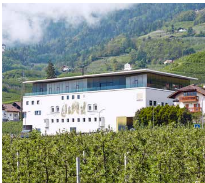
Cantina Merano Burggräfler a Marlengo (Merano, BZ).