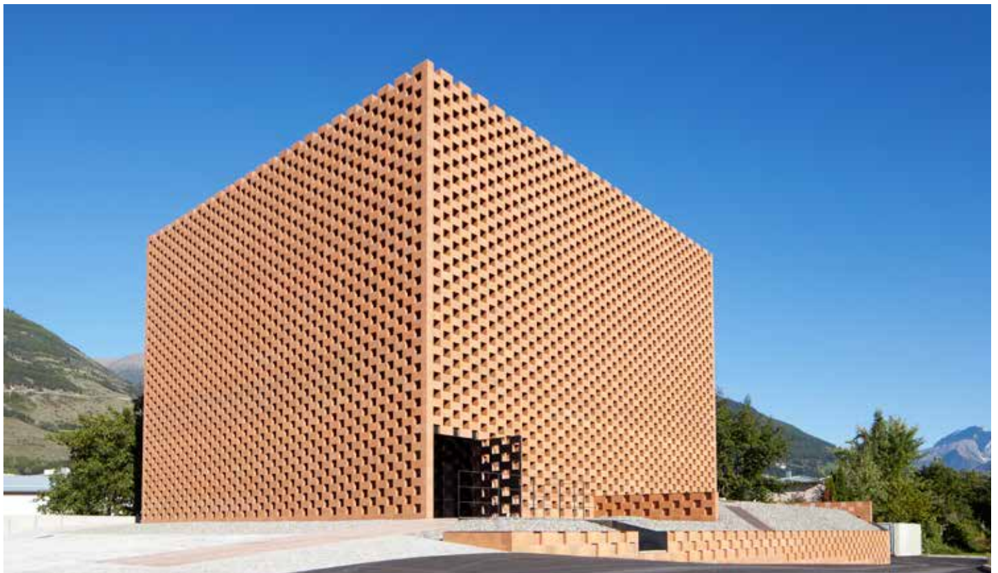
Distilleria Puni a Glorenza (Bz).

Si deve andare oltre, non bisogna fermarsi all'incontro tra turismo e produzione. Sia la cantina di Terme che anche la distilleria Puni sono diventati già luoghi di tutti i tipi di eventi, discussioni e dibattiti per tutto l'Alto Adige dando quindi ai committenti una buona possibilità di presentazione dei loro prodotti senza esagerati sforzi di pubblicità.