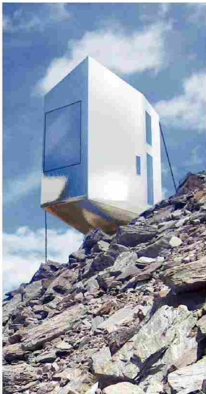
Rivoluzione in quota

In questo quadro diventa importante confrontarsi progettualmente con un atteggiamento aperto sia ai temi della contemporaneità – tecnologia, sicurezza, comfort, immagine – sia a quelli della concretezza, della funzionalità, della sostenibilità, dei costi e della particolarità del contesto ambientale. Con questo obiettivo si è avviata una collaborazione tra il Club alpino italiano di Torino e l'Istituto di architettura montana, centro di ricerca del Politecnico di Torino impegnato a sviluppare un progetto di un nuovo modello di bivacco alpino, battezzato «Quarzo», sintesi della sua natura morfogenetica.