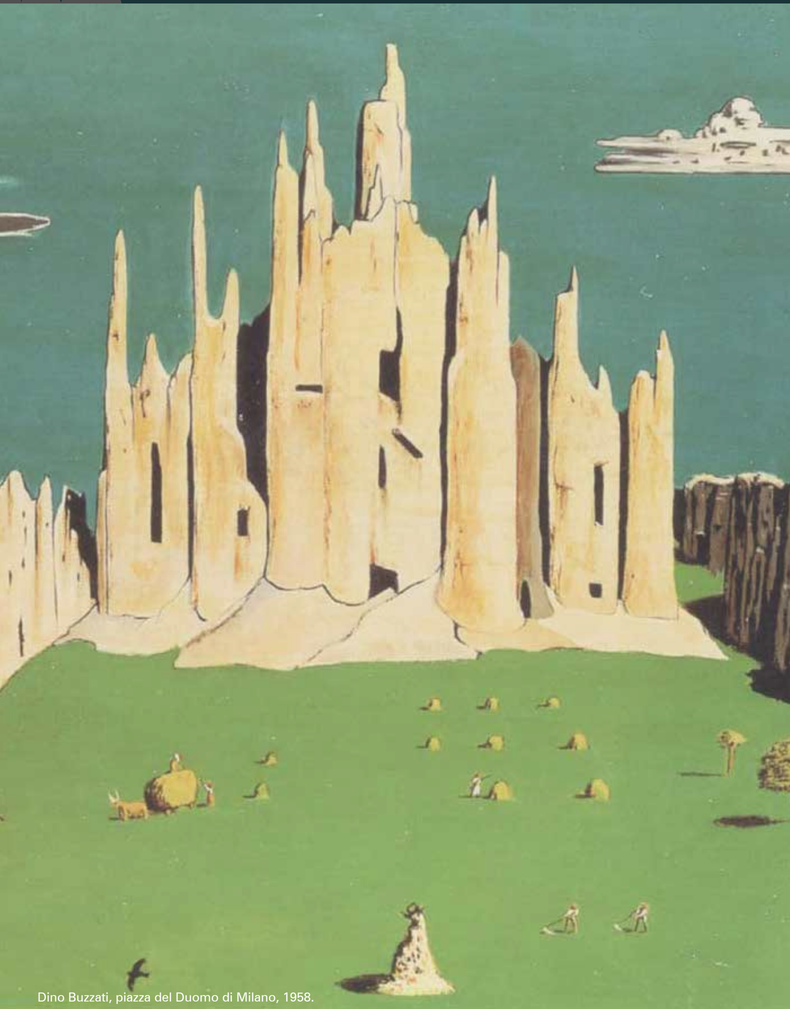
Dino Buzzati, piazza del Duomo di Milano, 1958.