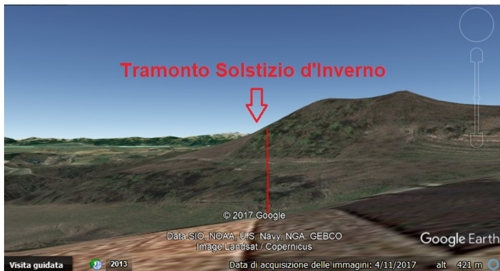
Figura 2: Il territorio circostante, visto verso la direzione del tramonto al solstizio d'inverso, grazie a Google Earth.

Oltre all'orientazione verso il tramonto o all'orientazione suggerita da Vitruvio, ci possono però essere altre orientazioni. La chiesa ha l'abside che si trova verso oriente. La chiesa potrebbe allora essere stata orientata verso il sorgere del sole, simbolo di rinascita in Cristo [6,7]. Come si può leggere in [6], nelle antiche Costituzioni Apostoliche si prescriveva che la chiesa fosse una struttura allungata, quasi a forma di nave, orientata verso il sorgere del sole: "Aedes sit oblonga, ad orientem versa, et quae sit navi similis". La fondazione della chiesa iniziava il giorno o la vigilia della festa del santo a cui era dedicata. Si vegliava la notte e al sorgere del sole l'asse della chiesa veniva tracciato nella direzione