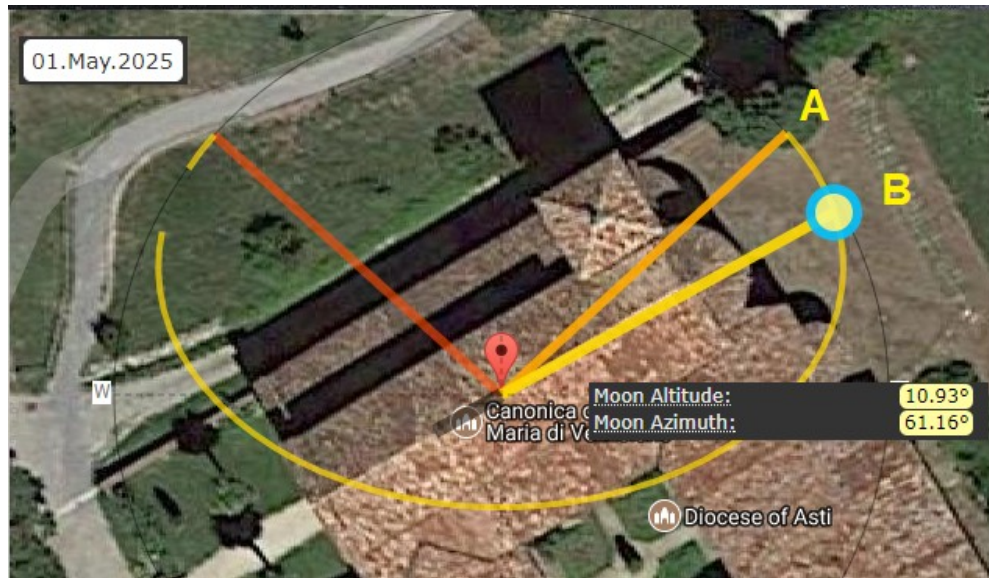
Figura 5: Simulazione con MoonCalc.org. A è la direzione di levata rispetto all'orizzonte astronomico, mentre B è quella rispetto all'orizzonte fisico. L'asse della chiesa coincide con la direzione B di levata della luna al lunistizio maggiore.

chiesa col lunistizio è quindi possibile. Nella Figura 6, vediamo una simulazione con Google Earth del punto di levata della luna.