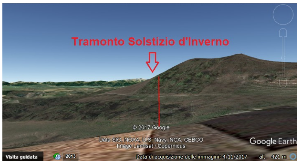
Figura 2: Il territorio circostante, visto verso la direzione del tramonto al solstizio d'inverso, grazie a Google Earth.

Oltre all'orientazione verso il tramonto o all'orientazione suggerita da Vitruvio, ci possono però essere altre orientazioni. La chiesa ha l'abside che si trova verso oriente. La chiesa potrebbe allora essere stata orientata verso il sorgere del sole, simbolo di rinascita in Cristo [6,7]. Come si può leggere in [6], nelle antiche Costituzioni Apostoliche si prescriveva che la chiesa fosse una struttura allungata, quasi a forma di nave, orientata verso il sorgere del sole: "Aedes sit oblonga, ad orientem versa, et quae sit navi similis". La fondazione della chiesa iniziava il giorno o la vigilia della festa del santo a cui era dedicata. Si vegliava la notte e al sorgere del sole l'asse della chiesa veniva tracciato nella direzione