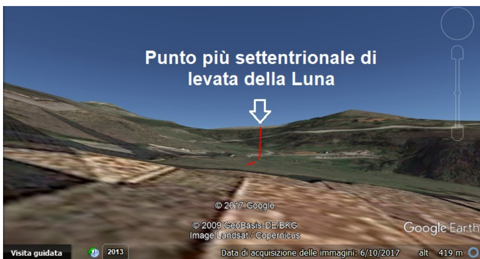
Figura 6: Simulazione con Google Earth del punto di levata della luna.

In conclusione, in questo articolo abbiamo discusso le possibili orientazioni astronomiche relative a sole e luna dell'Abbazia di Vezzolano. Abbiamo anche mostrato un metodo che usa software come SunCalc, MoonCalc e Google Earth, per determinare azimuth e altezza del sorgere del sole e della luna, rispetto all'orizzonte fisico, nel caso che l'orizzonte astronomico non sia visibile per la presenza di colline e montagne. Per quanto riguarda la luna e allineamenti coi lunistizi, si vedano anche [16-20].