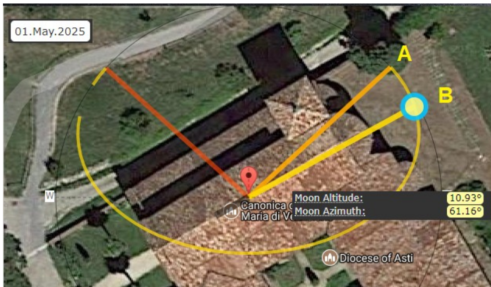
Figura 5: Simulazione con MoonCalc.org. A è la direzione di levata rispetto all'orizzonte astronomico, mentre B è quella rispetto all'orizzonte fisico. L'asse della chiesa coincide con la direzione B di levata della luna al lunistizio maggiore.

chiesa col lunistizio è quindi possibile. Nella Figura 6, vediamo una simulazione con Google Earth del punto di levata della luna.