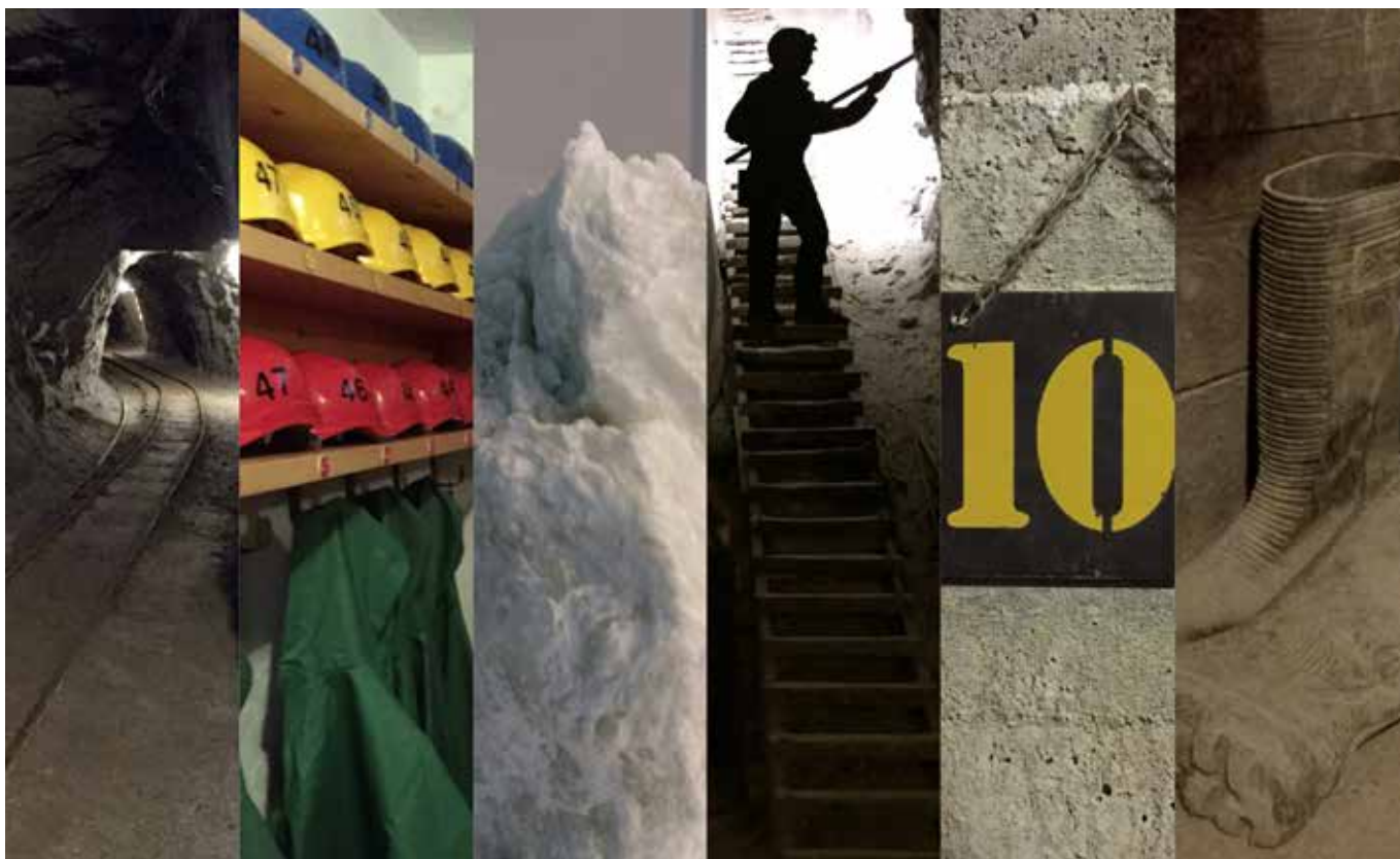
Alcuni riferimenti, suggestioni e significati richiamati nello Scenario della miniera.

dovevano tenere conto delle esigenze di gestione espresse dalla Committenza, dal mercato, dal target di riferimento (attuale e potenziale), dall'identità dell'Ecomuseo delle Miniere, dalle tecnologie a disposizione sul territorio. Sono stati adottati un approccio "leggero" al progetto e materiali e tecniche in grado di valorizzare il materiale talco quale protagonista della narrazione e della visita, e quindi un linguaggio "allusivo" o "metaforico" al fine di sfruttare riferimenti e memorie per proporre prodotti nuovi ma rispettosi del passato e filologicamente coerenti con il messaggio e la mission dell'Ecomuseo. Prodotti concepiti a partire da una lettura dei tratti identitari dell'Ecomuseo o di quelli emblematici della collezione, lontani dagli stereotipi del merchandising tradizionale, spesso mera applicazione di un logo su prodotti globalizzati. La sfida è stata quella di ricercare l'innovazione di prodotto sotto il profilo della funzionalità, della sostenibilità, dei linguaggi formali, del