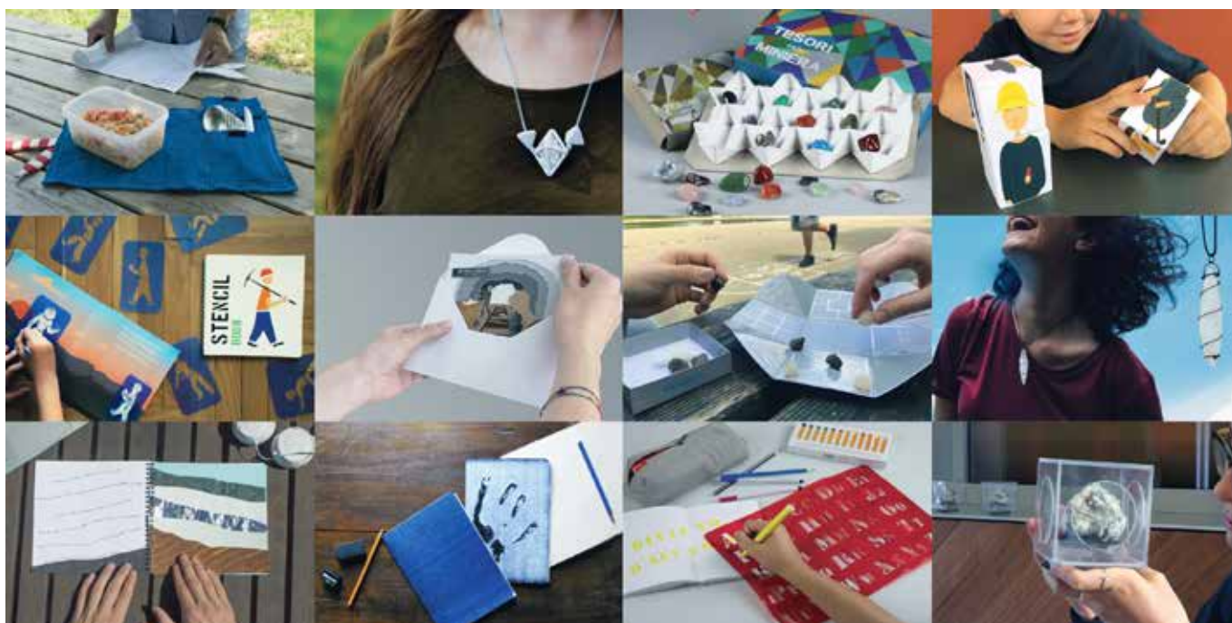
Panoramica di alcuni dei progetti di merchandising sviluppati dagli studenti del Laboratorio di Concept Design, a.a. 2016/17.

gettuale, ed è stata fondamentale per delineare atteggiamenti, soluzioni, opportunità in grado di portare ad una evoluzione meta-progettuale consapevole.