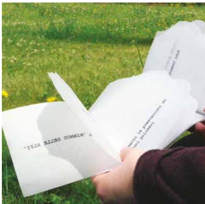
"Sfoggia il Bianco delle Alpi": il talco si racconta in un "libricino illeggibile" di fogli traslucidi (A. Spangaro, B. Urriola).

rello, la mantella impermeabile, lo stencil per la scrittura e il disegno ecc.).