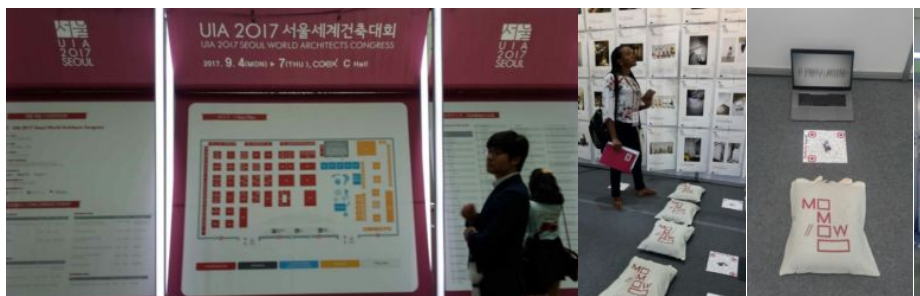
Immagine di copertina