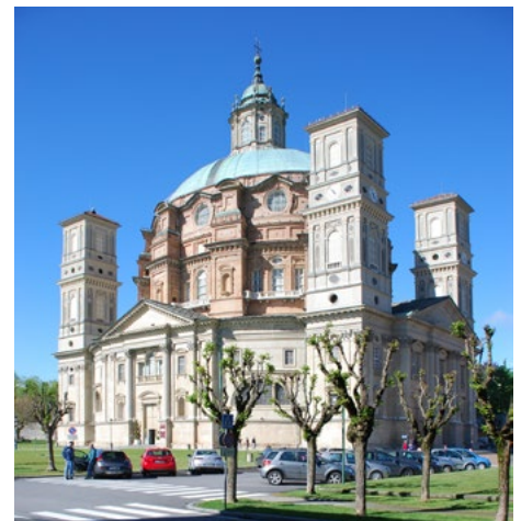
Il Santuario di Vicoforte, vista esterna, 2016.