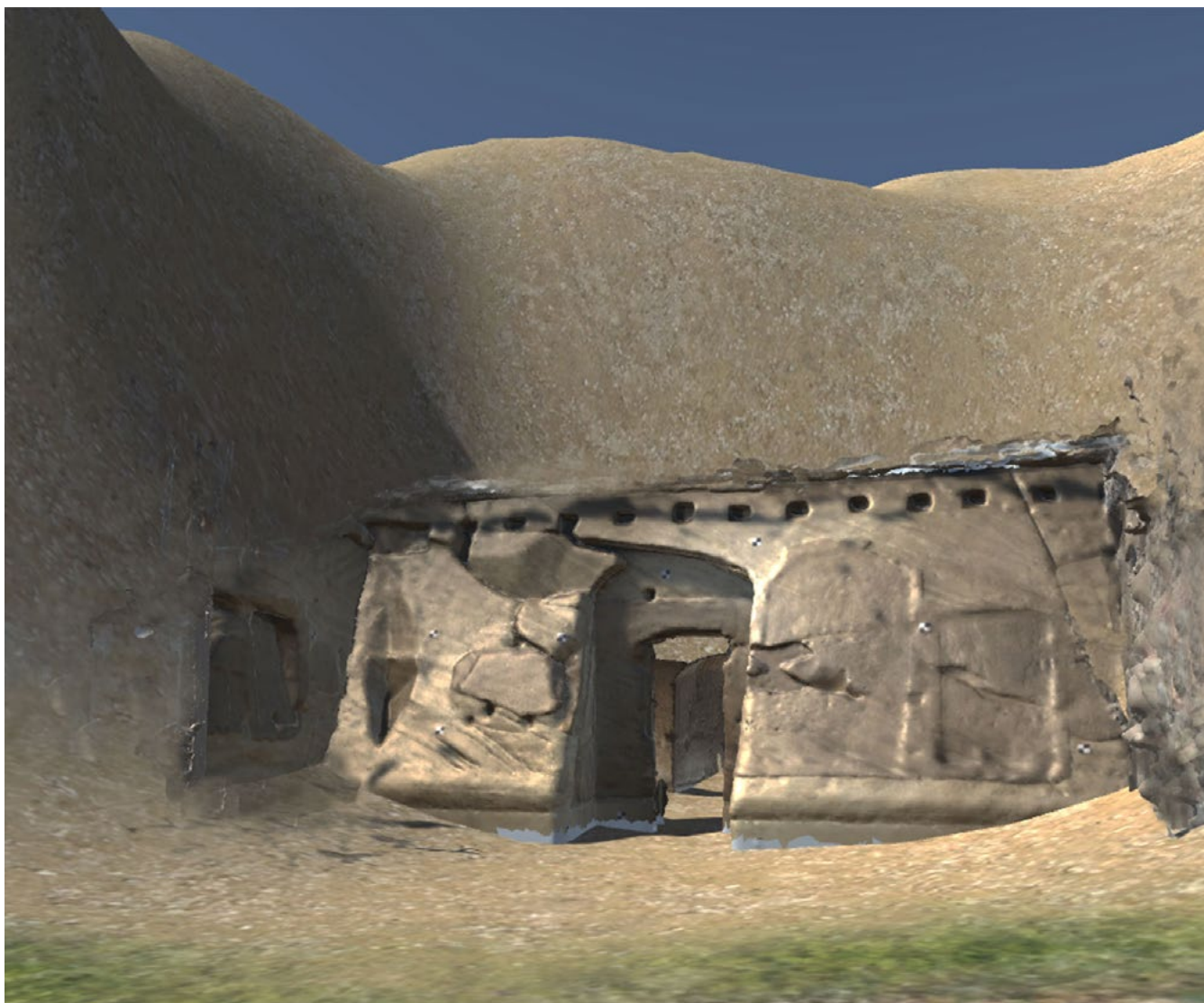
Figura 2. Visualizzazione del tempio nel contesto originale ricostruito in Virtual Reality 3D, software Unity.

Rosa Tamborrino, Willeke Wendrich, Fulvio Rinaudo, Paolo Piumatti, Massimiliano Lo Turco, Lisa Snyder, Neal Spencer. Collaboratori: Noemi Mafri, Michela Mezzano, Giacomo Patrucco