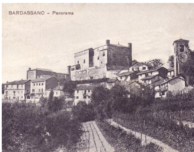
BARDASSANO - Panorama

Sin dalle prime riflessioni operate nelle fasi organizzative è emersa la necessità di studiare l'origine della conformazione urbana dei due borghi, collezionare fonti primarie dalle quali ricostruire l'evoluzione del tessuto costruito e comprendere, attraverso un attento studio della cartografia e della letteratura esistente, i vincoli imposti dal quadro normativo nazionale e gli elementi geografici,