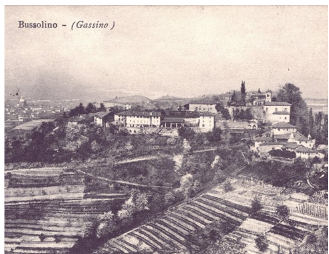
Bussolino - (Gassino)