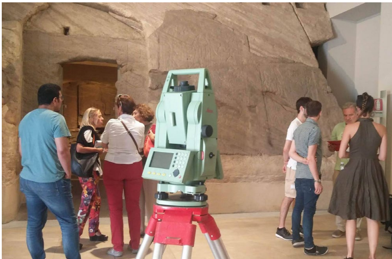
Figura 1. Rilievo fotogrammetrico del Tempio di Ellesija al Museo Egizio.

Attualmente il tempio rupestre occupa una stanza del Museo Egizio di Torino, dove è stato ricostruito fra il 1968 e il 1970 ricomponendo gli elementi originali a partire da un rilievo dello stato di fatto prima dello smontaggio e dello spostamento 4 . A partire da tale oggetto e con l'obiettivo di ricostruire virtualmente il tempio nel suo contesto originario, gli studenti, divisi in gruppi, hanno lavorato su temi specifici quali: il rilievo fotogrammetrico del tempio e della sala del museo che lo ospita, lo studio delle trasformazioni del tempio e del suo contesto dalla costruzione fino allo spostamento a Torino, la "traduzione" dei geroglifici parietali, la restituzione 3D del tempio e di una circoscritta area nubiana 5 , la costruzione dell'ambiente virtuale in cui ricontestualizzare il tempio.