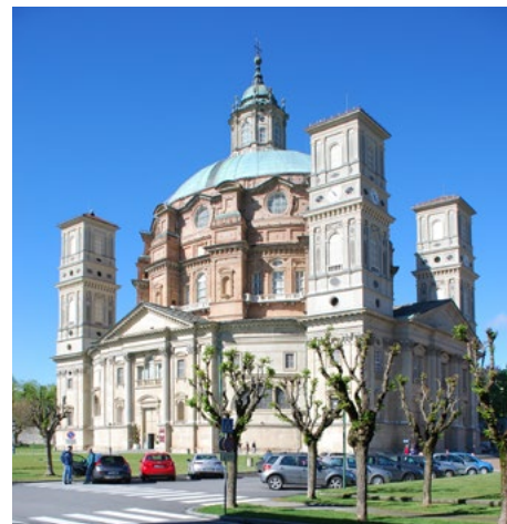
Il Santuario di Vicoforte, vista esterna, 2016.