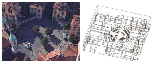
Figura 1 – Immagine aerea di Largo Saluzzo e modello utilizzato per le simulazioni Odeon.

Lo spazio analizzato è Largo Saluzzo, una piazza ottagonale con un'area di circa 2000 m 2 , situata a Torino. Lo studio è stato condotto mediante simulazioni ed auralizzazioni realizzate con il software Odeon (v.13). In figura 1 sono riportate un'immagine aerea della piazza ed il modello utilizzato in Odeon.