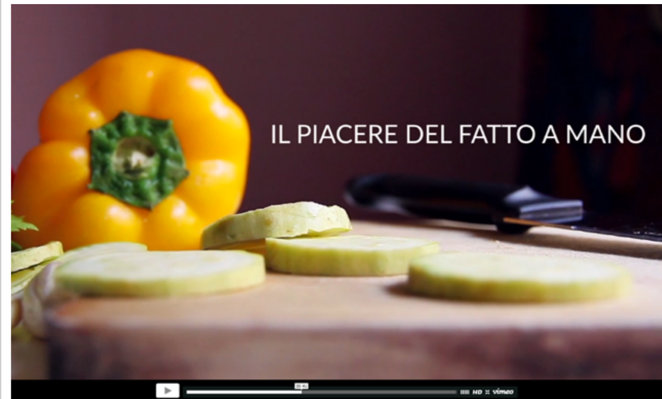
A sinistra: frame di due dei video che mostrano il ruolo del cibo e della innovazione sul territorio.