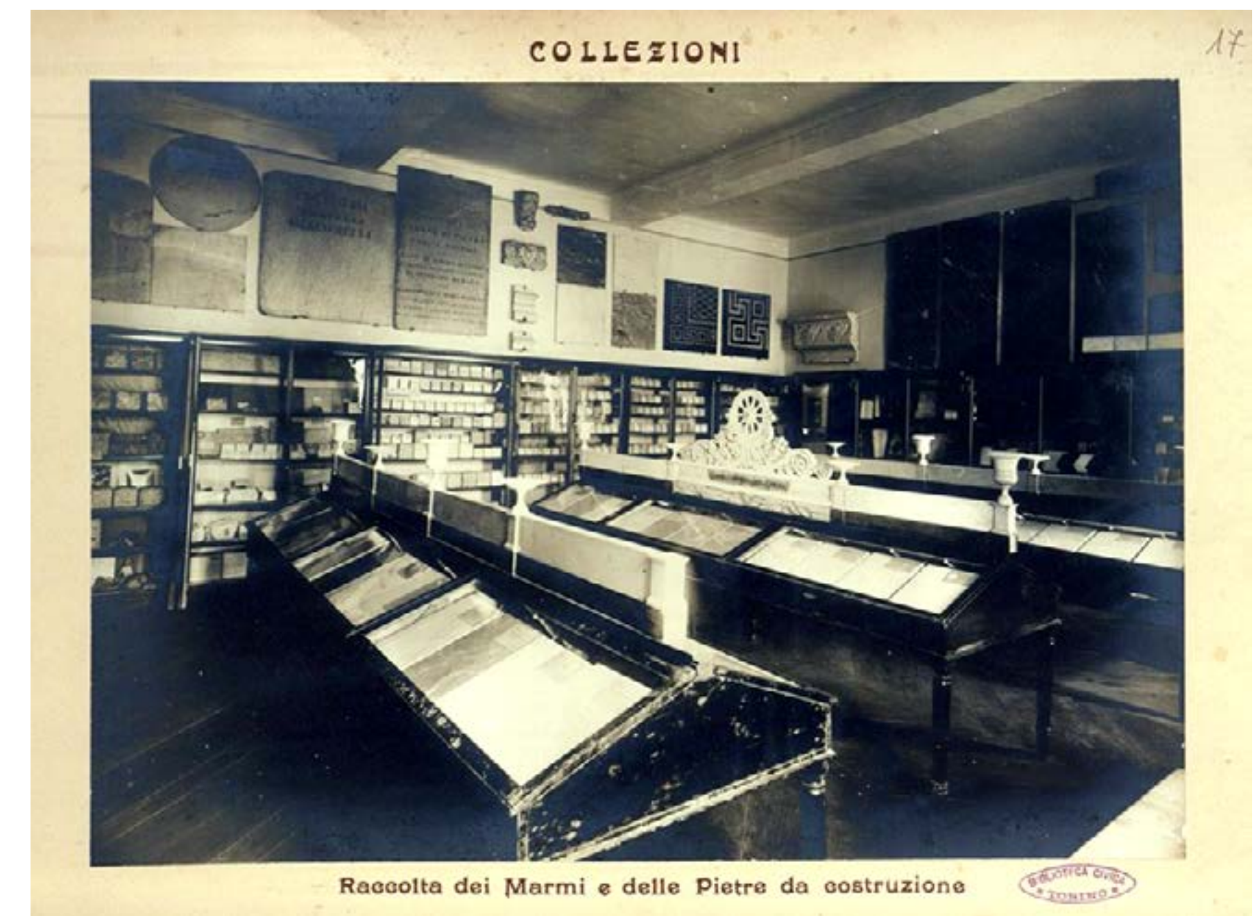
Raccolta dei marmi e delle pietre da costruzione, in Il R. Museo Industriale Italiano in Torino. 1862-1902, Torino 1902.