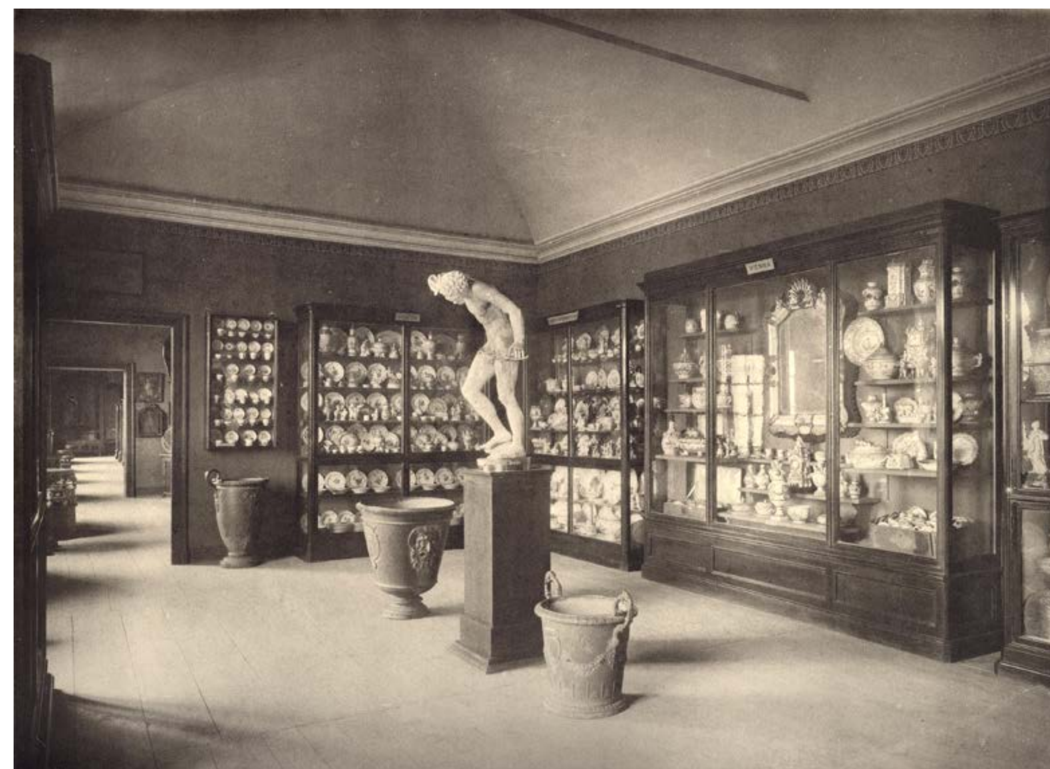
La sala delle ceramiche al Museo Civico di Torino, in Museo Civico di Torino - Sezione Arte antica, Cento tavole riproducenti circa 700 oggetti , Torino 1905.

aspettare ancora molti anni prima di venire “consegnata” alla cittadinanza, ma l’idea di un Museo Civico inclusivo e aggiornato continua a prendere corpo.