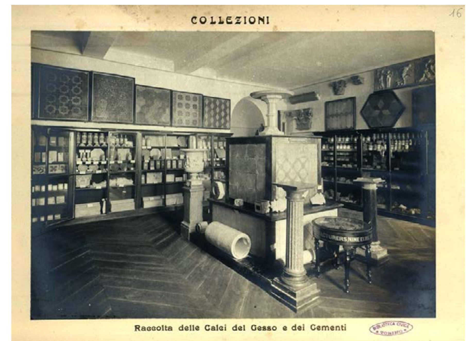
Raccolta delle calci dei gessi e dei cementi, in Il R. Museo Industriale Italiano in Torino. 1862-1902, Torino 1902.