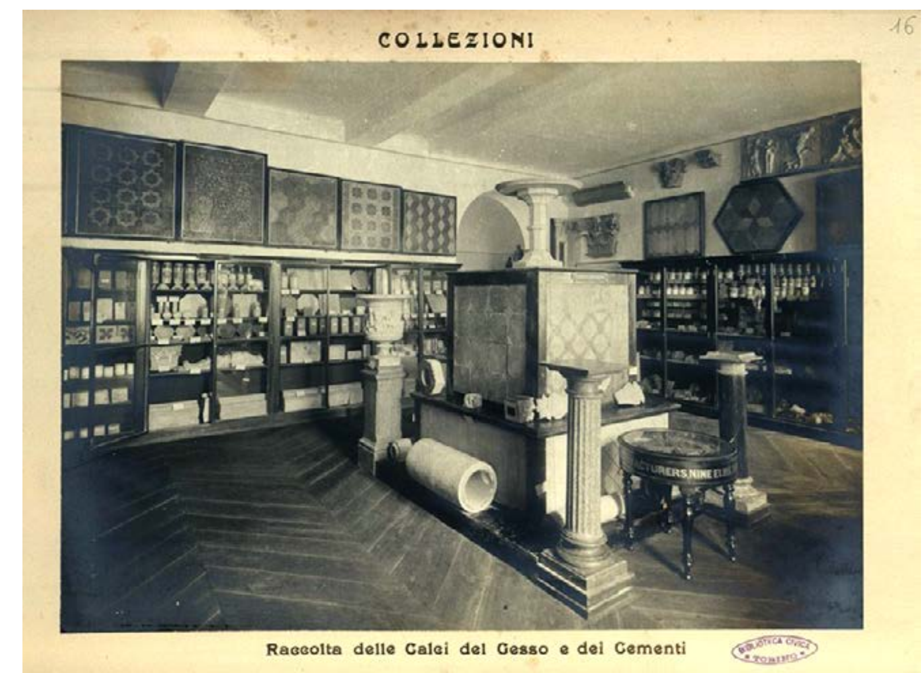
Raccolta delle calci dei gessi e dei cementi, in Il R. Museo Industriale Italiano in Torino. 1862-1902, Torino 1902.