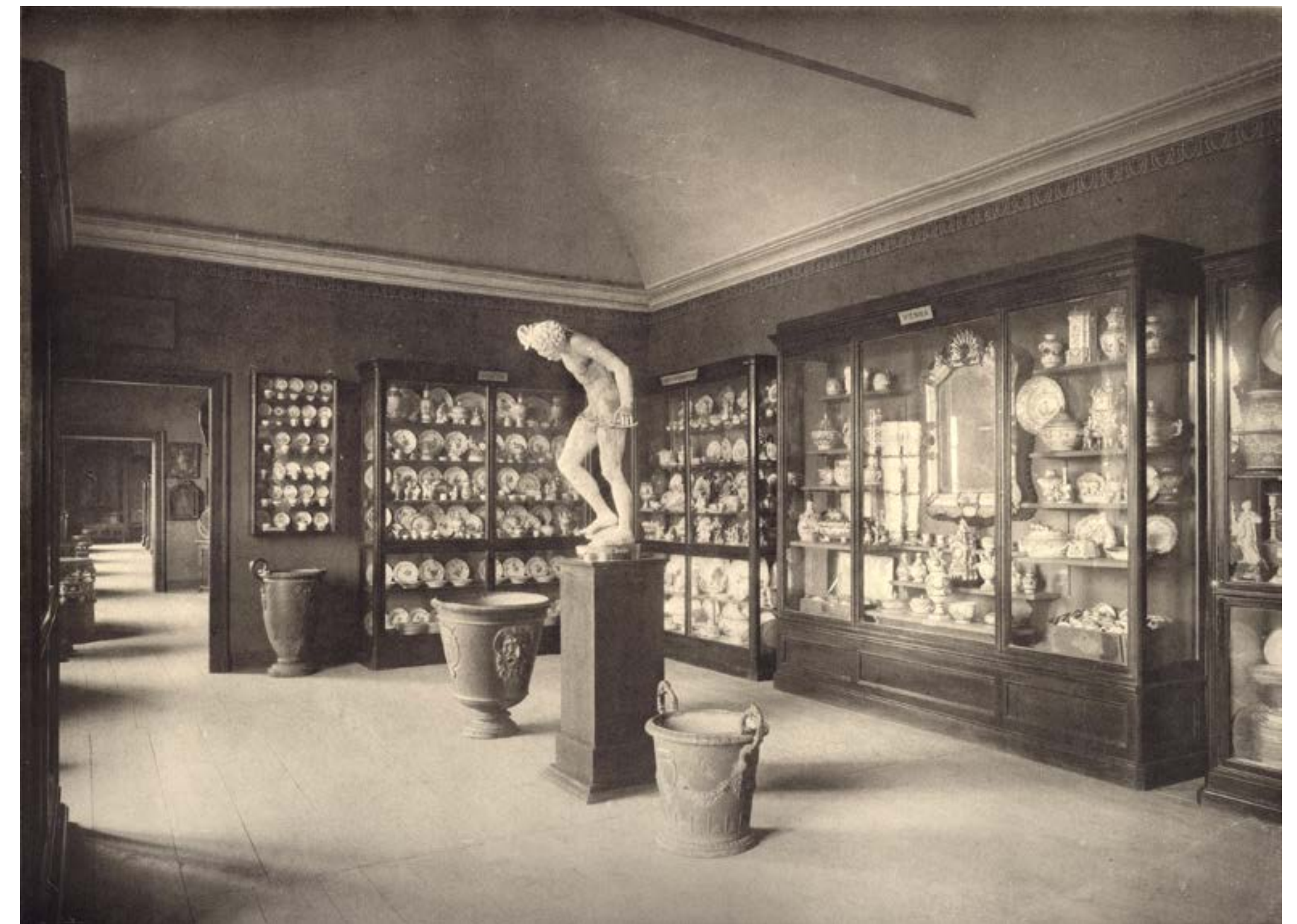
La sala delle ceramiche al Museo Civico di Torino, in Museo Civico di Torino - Sezione Arte antica, Cento tavole riproducenti circa 700 oggetti , Torino 1905.

aspettare ancora molti anni prima di venire “consegnata” alla cittadinanza, ma l’idea di un Museo Civico inclusivo e aggiornato continua a prendere corpo.