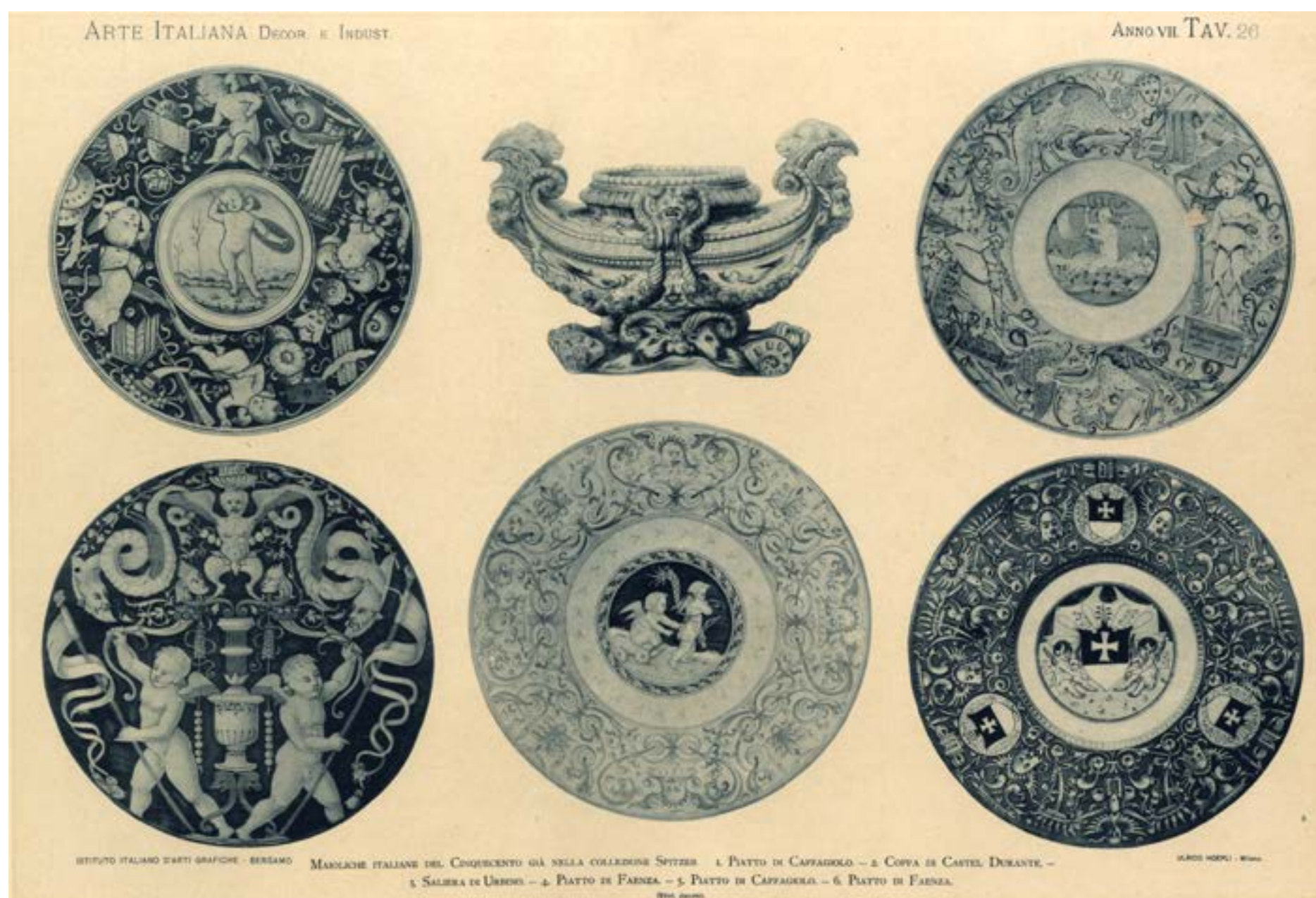
Maioliche italiane del Cinquecento, già della Collezione Spitzer, in “Arte Italiana Decorativa e Industriale”, VII, 1898, tav. 26.