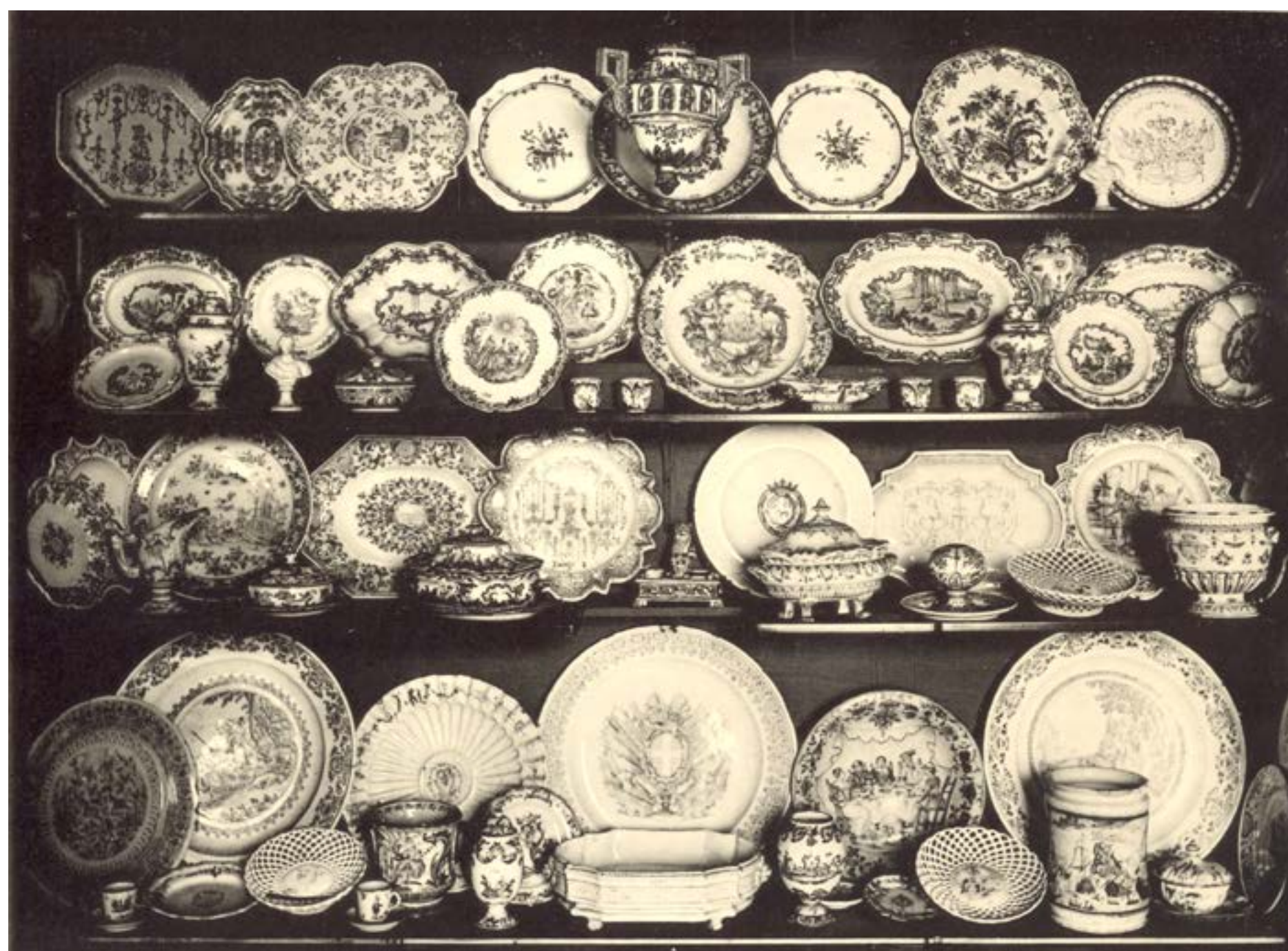
Pezzi in ceramica di Vinovo al Museo Civico di Torino, in Museo Civico di Torino – Sezione Arte antica, Cento tavole riproducenti circa 700 oggetti , Torino 1905.