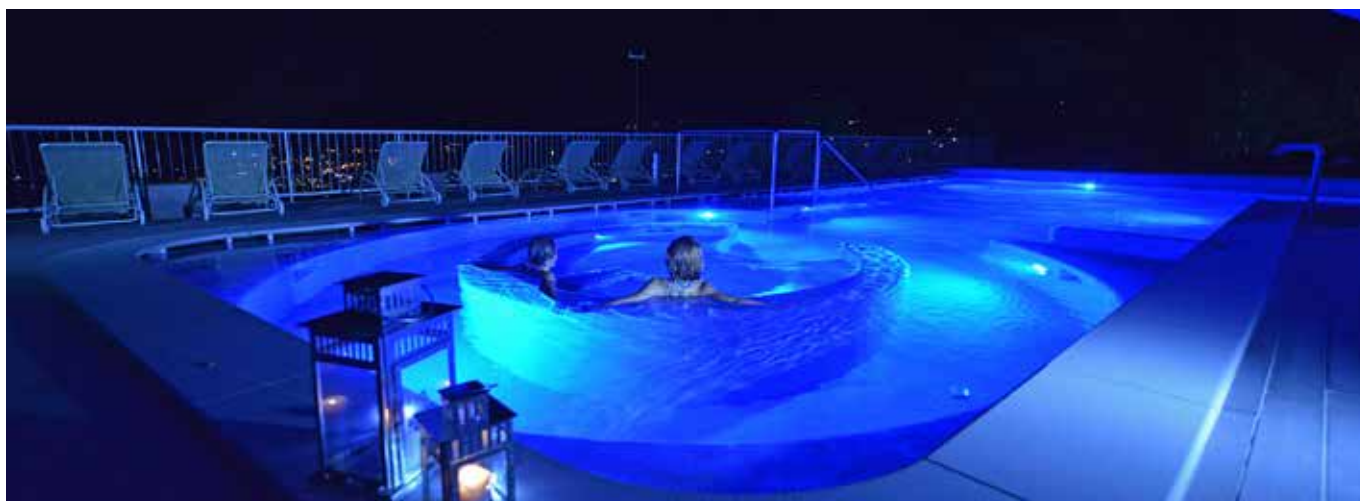
Terme di Saint Vincent: la vasca con i getti cervicali ( http://www.termedisaintvincent.com ).