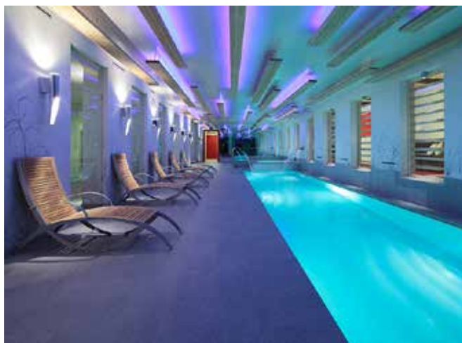
Il centro wellness dell'Hotellerie di Mascognaz a Champoluc ( http://www.hotelleriedemascognaz.com ).