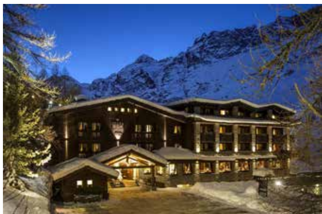
Hotel Hermitage a Cervinia