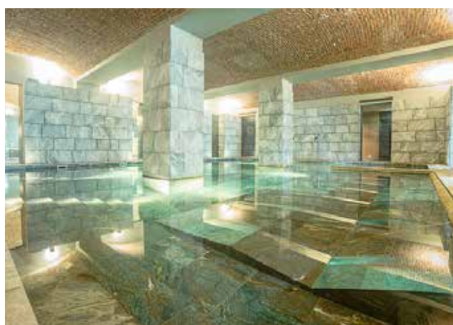
La spa del Grand Hotel Billia a Saint Vincent ( http://www.saintvincentresortcasino.it )