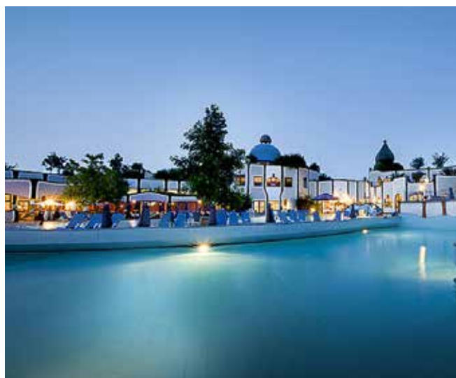
Terme di Rogner Bad Blumau: vista esterna del complesso.

Solo a partire dal secolo XI ricomparvero, in alcune città tedesche e a Parigi, i bagni pubblici, abbandonando la connotazione negativa che avevano assunto nei secoli precedenti. L'interesse sempre maggiore verso la pratica curativa dell'acqua portò nel Rinascimento alla riscoperta delle fonti termali come pratiche terapeutiche e dall'altro a riconsiderare tali complessi come luoghi di svago e incontro. Palladio, Vignola, Martini si ispirarono alle forme dell'acqua e le introdussero nei giardini e negli spa-