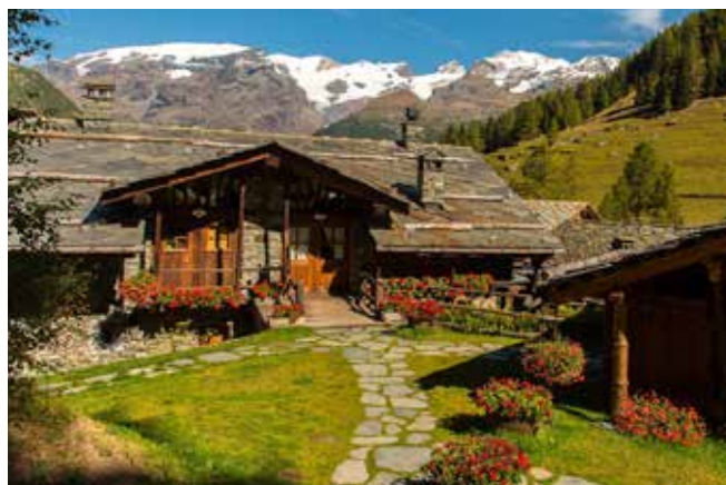
Hotellerie de Mascognaz a Champoluc

( http://www.hotelleriedemascognaz.com ).