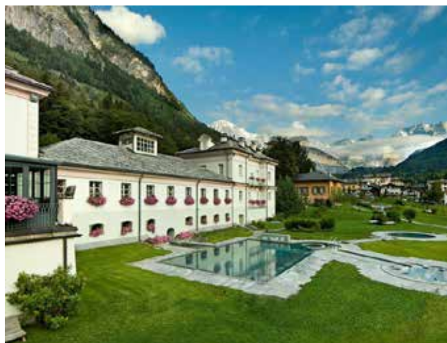
Terme Pré-Saint-Didier. Vista del complesso nella stagione estiva.

Un contributo essenziale alla promozione del benessere che gli stabilimenti termali di Courmayeur, Pré-Saint-Didier e Saint-Vincent erano in grado di assicurare fu dato dal medico aostano Auguste Argentier, promotore dello sfruttamento delle acque termali valdostane, il quale pubblicò a partire dal 1859 un giornale settimanale con lo scopo di far apprezzare la natura valdostana e i siti in cui sorgevano le sta-