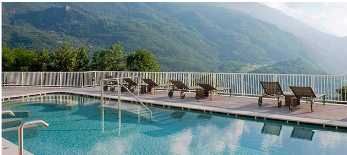
Terme di Saint Vincent: la piscina panoramica ( http://www.termedisaintvincent.com ).