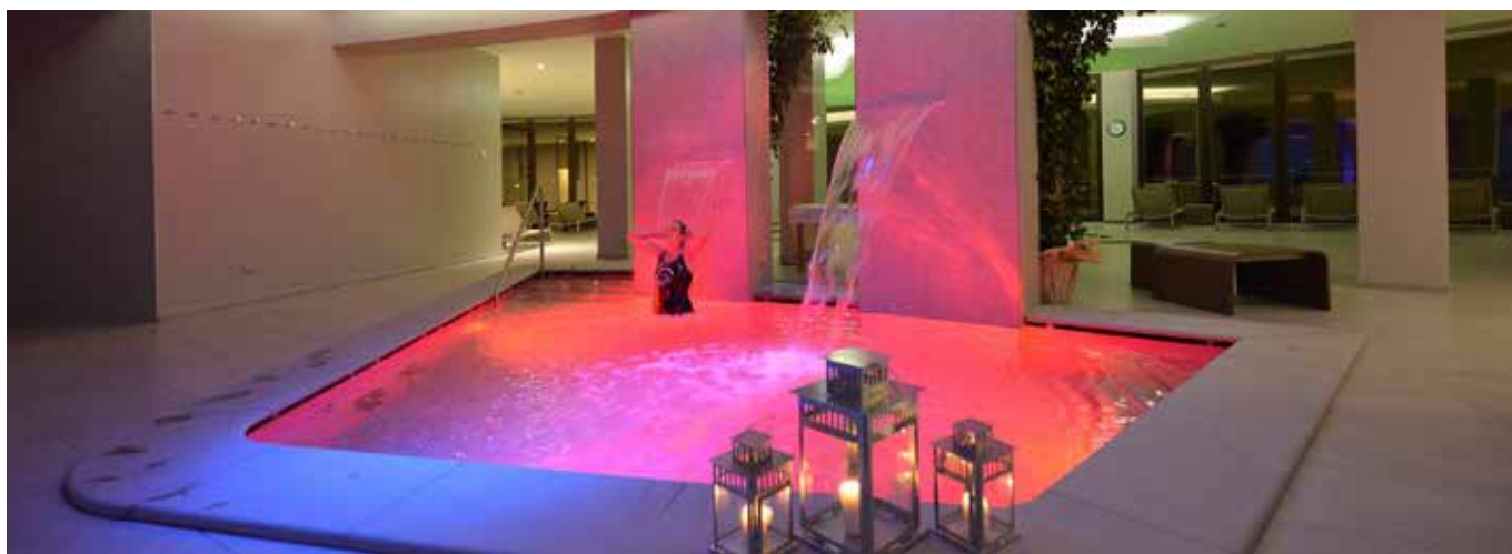
Terme di Saint Vincent: apertura serale ( http://www-termedisaintvincent.com ).