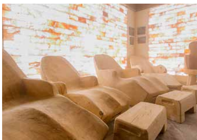
La sala per l'Haloterapia dell'Hotel Bellevue a Cogne ( http://www.hotelbellevue.it ).

na si aprono vetrate di grandi dimensioni, in alcuni casi la piscina è distribuita con una parte a servizio dello spazio wellness interno e con una parte squisitamente ludica nella parte esterna. La soluzione vetrata diventa quindi l'elemento di transizione tra dentro e fuori e al tempo stesso caratterizza la facciata in modo spiccato.