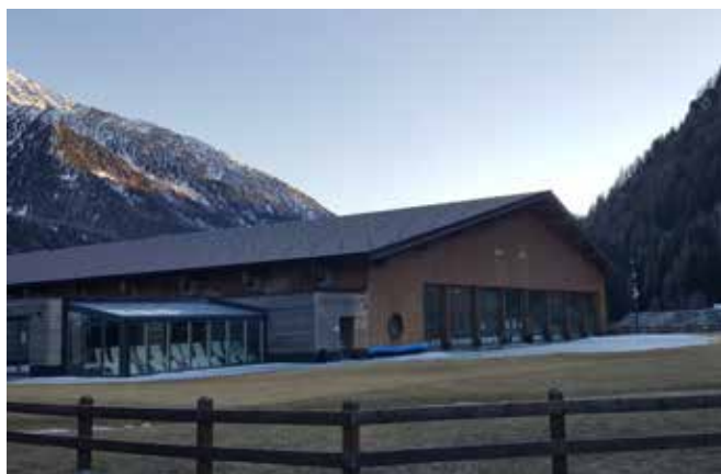
Monterosaterme a Champoluc.

degli ospiti dal resort (gatti delle nevi e motoslitte in inverno e fuoristrada in estate) dove la parte ricettiva è organizzata in tipi edilizi propri del tessuto originario della borgata opportunamente recuperati e riconvertiti, mentre il percorso benessere è ubicato poco discosto dalla borgata in una struttura di nuova realizzazione, accessibile quindi attraverso sentieri all'aperto; il resort Au Coeur des Neiges a Courmayeur anch'esso organizzato con chalet e appartamenti per gli ospiti collocati in edifici diversi organizzati su più livelli e centro benessere al centro della composizione planimetrica con piscina coperta e riscaldata con getto d'acqua a cascata, zona idromassaggio e nuoto controcorrente.