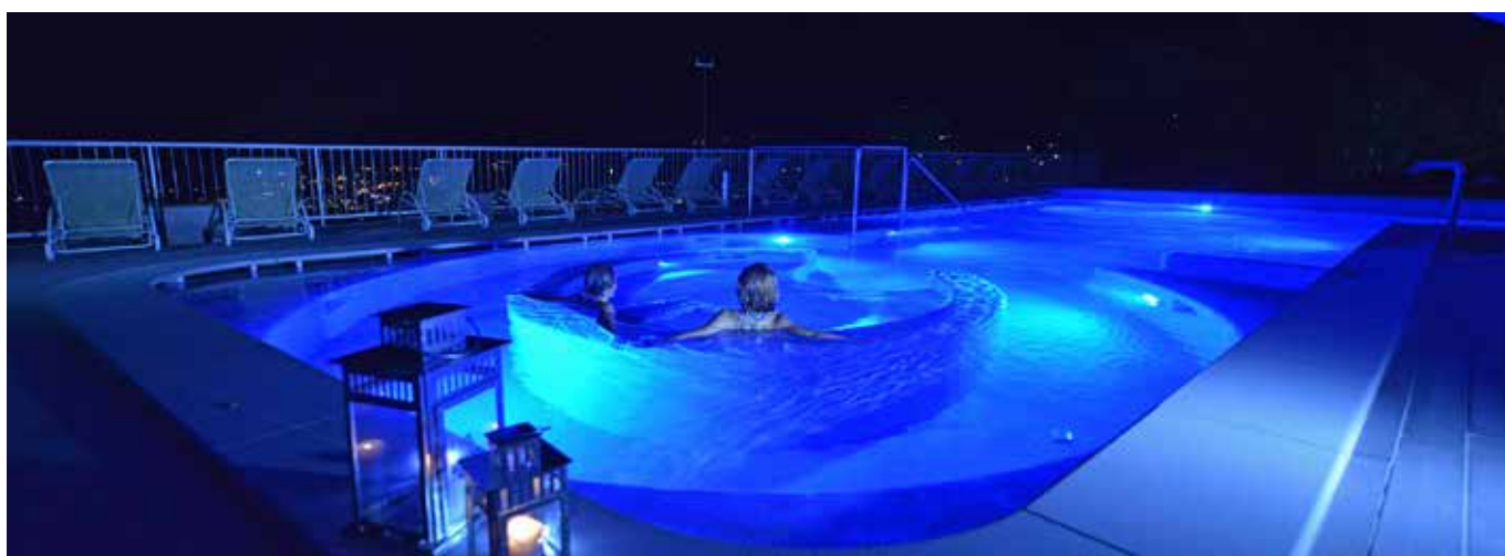
Terme di Saint Vincent: la vasca con i getti cervicali.