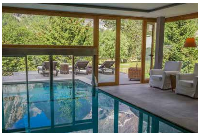
La piscina panoramica del resort Au Coeur des Neiges a Courmayeur ( http://www.aucoeurdesneiges.com ).