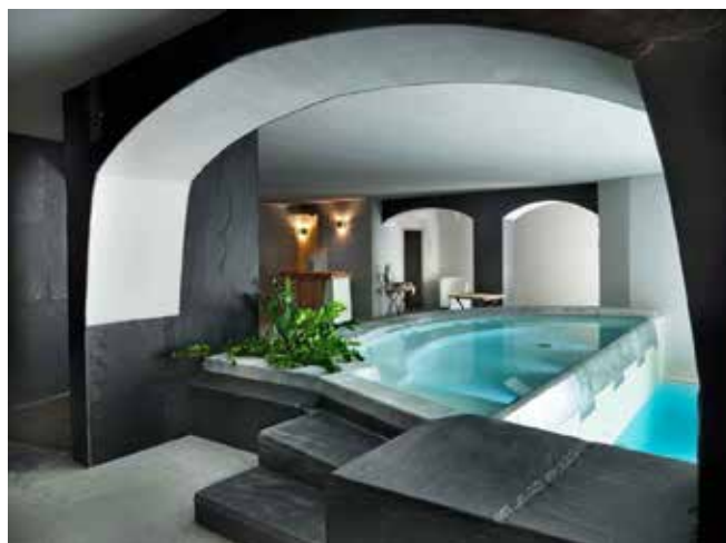
Le vasche idromassaggio del resort Saint Hubertus a Cervinia ( http://www.sainthubertusresort ).