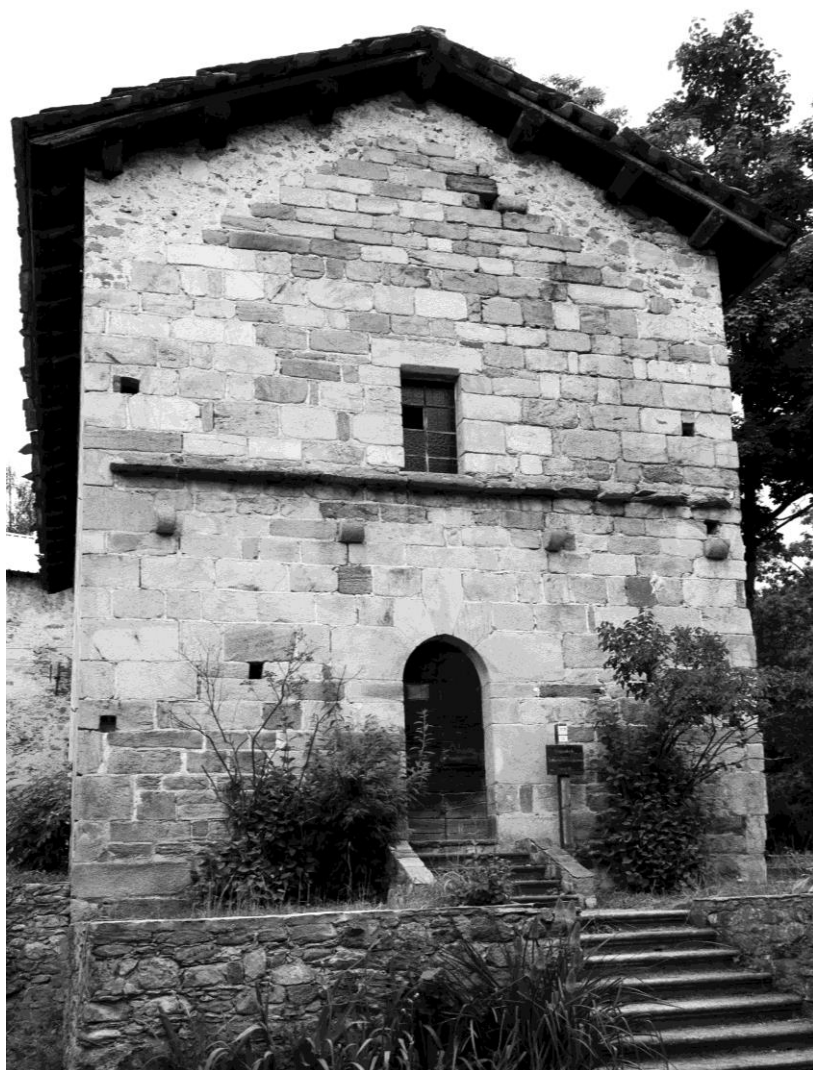
Fig. 3. Garessio (Cuneo), correria della Certosa di Casotto. Prospetto principale d'ingresso della chiesa.