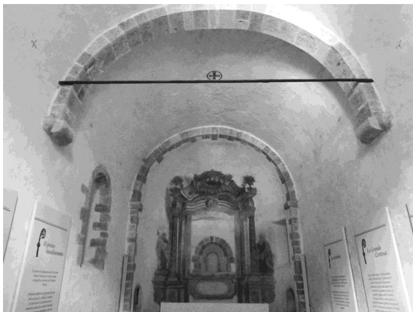
Fig. 1. Chiusa Pesio (Cuneo), correria della Certosa di Pesio. Interno della chiesa.