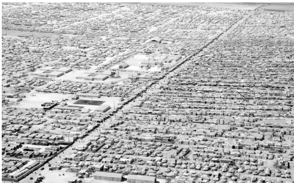
Fig. 3 – Vista aerea del campo Zaatari (Giordania)

I campi più longevi ancora abitati sono sorti negli anni settanta, Dukwi in Botswana (1970), Fath El Rahman e Awad El Seid in Sudan (1972), Jahrom (1972) e Azna (1975) in Iran, Awserd, Dakhla ed El Aiun in Algeria (1976), e i molti altri rilevati da Kennedy (2008, pp. 253-263). La durata e la dimensione di molti di questi induce ad affermare che si tratti di insediamenti simili a città. Ad esempio i cinque campi nei dintorni di Daadab in Kenya attualmente ospitano oltre 330.000 rifugiati somali, ma sono giunti ad ospitarne quasi 500.000 in alcuni periodi, dall'apertura avvenuta nel 1992. Anche in Medio Oriente vi sono insediamenti per rifugiati di dimensioni urbane, come il campo giordano Zaatari (Fig. 3), che ha ospitato oltre 200.000 siriani nel corso del 2013, e ne ospita attualmente circa 80.000 ( http://data.unhcr.org/ ).