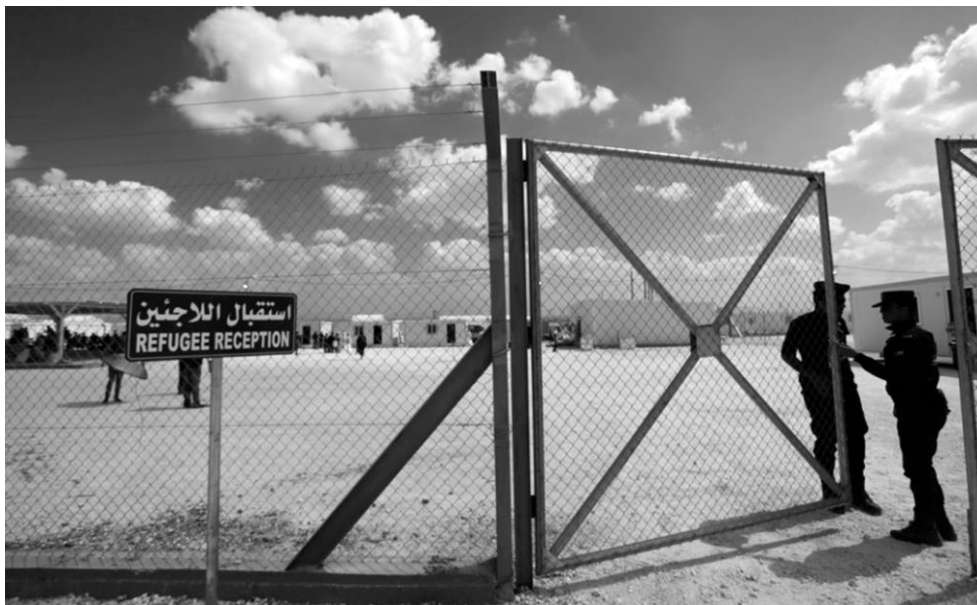
Fig. 1 – L'ingresso controllato del campo rifugiati Mrajeeb Fhood al-Zarqa in Giordania