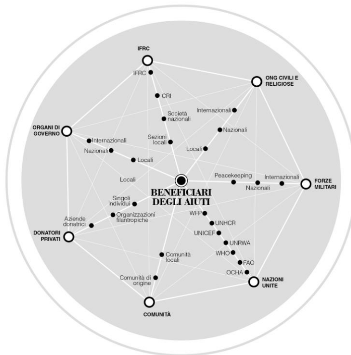
Fig. 2 – Who's who negli interventi umanitari