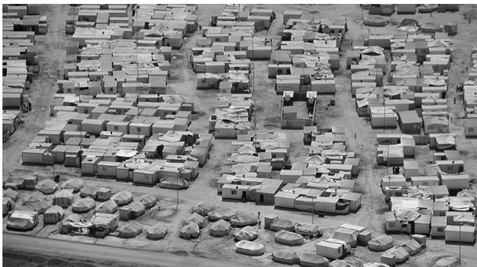
Fig. 9 – Shelter secondo gli utenti, Zaatari (Giordania)