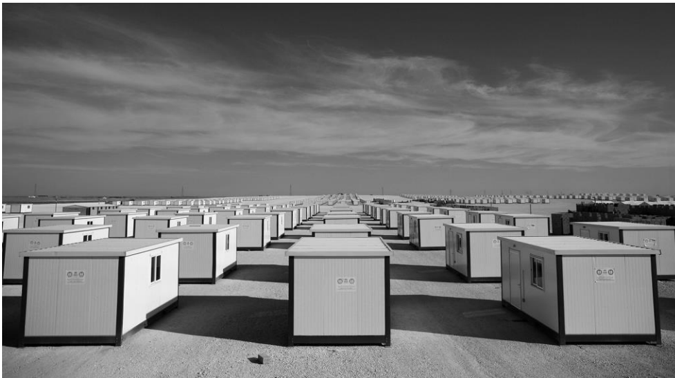
Fig. 8 – Shelter secondo la pianificazione UNHCR, Zaatari (Giordania)