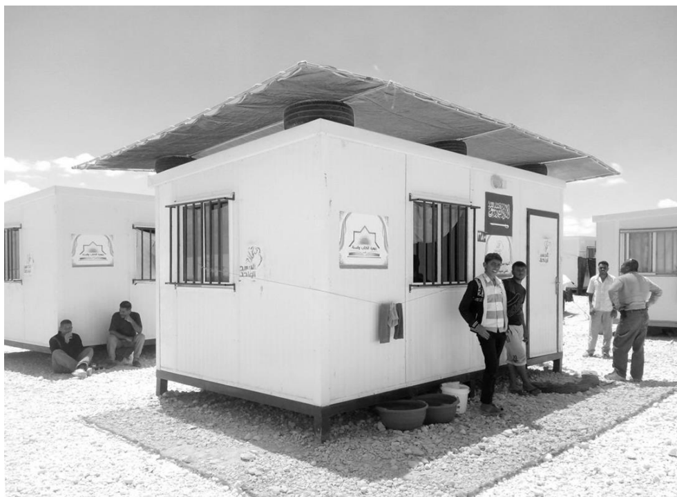
Fig. 7 – Prototipo di copertura ombreggiante realizzato da FAREstudio a Zaatari