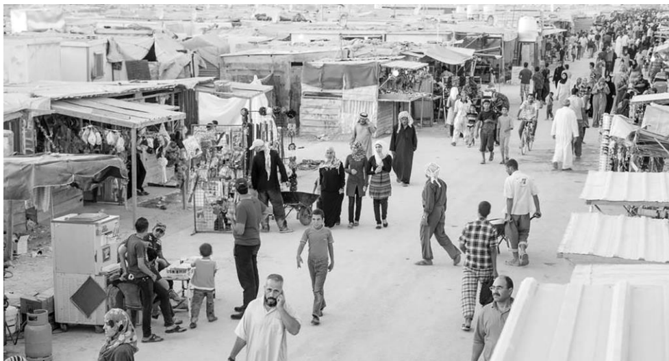
Fig. 5 – Champs-Élysée, la strada commerciale del campo Zaatari (Giordania)

Il dato ricorrente è la presenza di un confine, di una distanza rispetto al mondo. Lo spazio interno è una sorta di «esterno artificiale»: i rifugiati vivono in una sfera extraterritoriale imposta da condizioni contingenti politicamente e militarmente determinate. Si tratta di una dimensione distaccata rispetto al contesto: i campi vengono ubicati in luoghi scarsamente popolati, a volte semidesertici. In breve tempo un pacchetto di misure amministrative deliberate e coerenti trasforma queste aree in una forma apparentemente urbana, amputata delle sue funzioni politiche ed economiche. Si manifesta un impegno internazionale a minimizzare gli impatti per i paesi ospitanti: ciò che succede all'interno deve coinvolgere il meno possibile la vita quotidiana locale. Il campo è uno strumento di controllo per la gestione di popolazione in eccesso, che Bauman (2004) connota in maniera volutamente forte e sgradevole come “vite di scarto”.