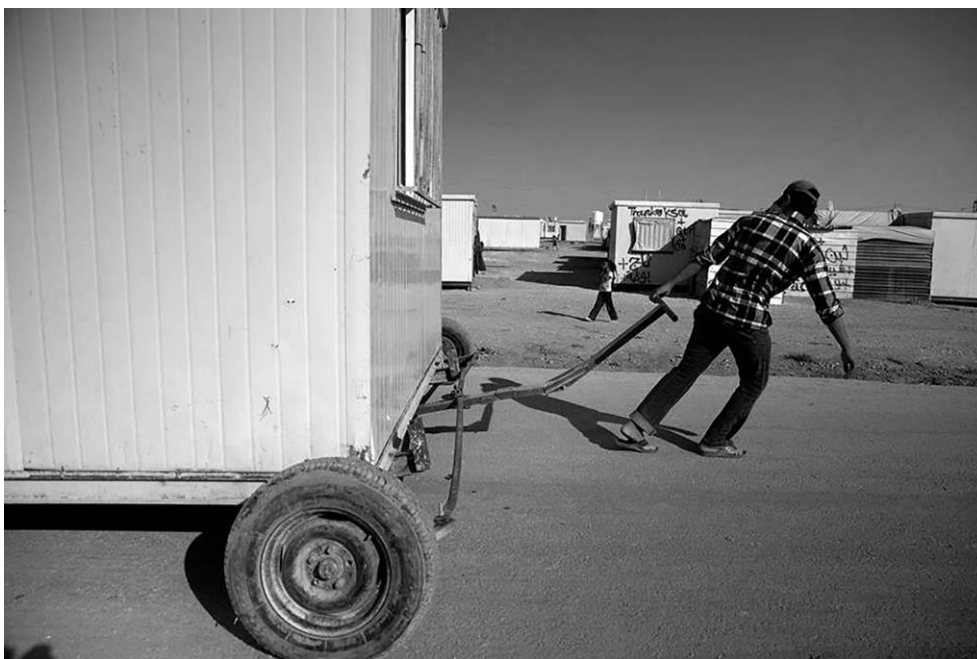
Fig. 10 – Autogestione urbanistica a Zaatari: shelter trainato tramite carrello artigianale

Gli shelter utilizzati a Zaatari, lontano dalla vista dei garanti di polizia e ordine nel campo, vengono spostati tramite mezzi di trasporto rudimentali, come bombole del gas su cui farli scorrere o carrelli autocostruiti (Fig. 10). Le motivazioni sono molteplici: avvicinarsi a parenti o conoscenti per ricreare un ambiente più familiare, avviare attività commerciali e artigianali, vendere e comprare shelter per migliorare la propria condizione all'interno del campo, o all'esterno dove il commercio di questi oggetti è comunque fiorente.