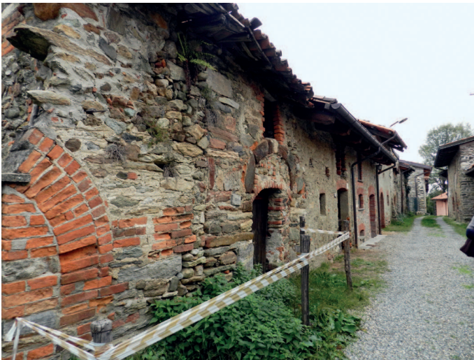
Fig. 2. Ricetto di Magnano (Biella). Cellule edilizie abbandonate.