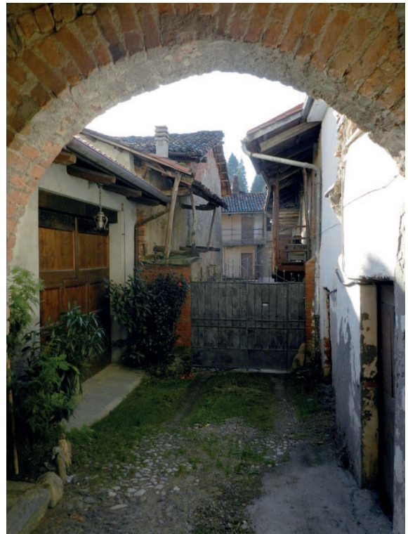
Fig. 3. Edilizia storica dismessa nel centro di Magnano.