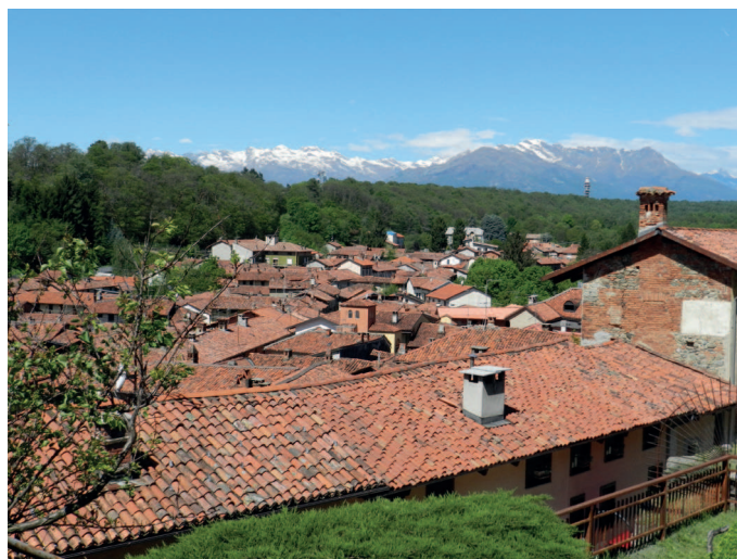
Fig. 1. Magnano e il suo territorio.

L'esame degli esiti dell'attività di ricerca da poco conclusasi e avente per oggetto il territorio di Magnano, piccolo comune di origine medievale collocato ai piedi della Serra morenica in provincia di Biella (Piemonte), offre un'esemplificazione del lavoro svolto e dei risultati raggiunti attraverso la mutua collaborazione sia di ricercatori, aventi competenze diverse (restauro, disegno, rappresentazione, geomatica), sia della pubblica Amministrazione e della popolazione, accomunati tutti dall'intento di perseguire la salvaguardia, mediante il recupero e la valorizzazione del patrimonio culturale di Magnano e delle sue frazioni (Fig. 1).