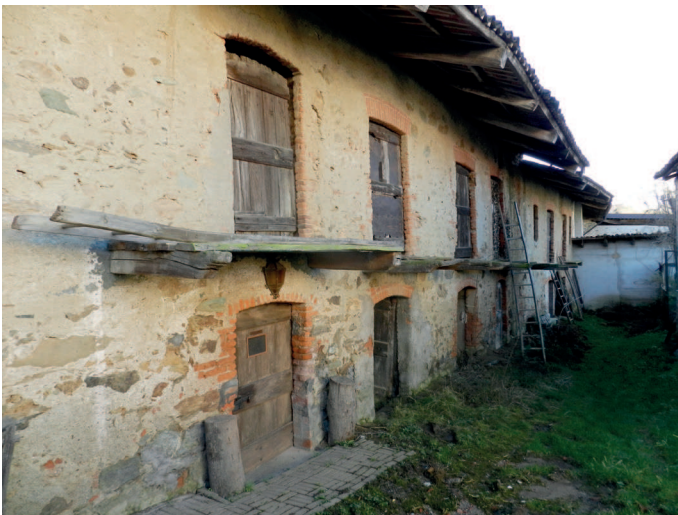
Fig. 4. Architettura vernacolare dismessa nella frazione Carrera di Magnano.