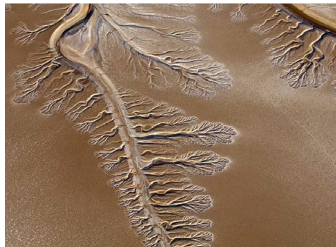
06 | Dove finisce il Colorado. Where Colorado river ends.

Alla luce delle considerazioni fatte sui DB, appare evidente la necessità di impiegare strumenti più evoluti di quelli impiegati sino ad ora. La capacità predittiva del progetto dipenderà sempre più dall'integrazione dei dati stessi all'interno di un'elaborazione. La gestione, ad esempio, di immensi spazi quali i bacini fluviali è fra le migliori argomentazioni in favore di detta integrazione. Un oggetto geografico quale il fiume Colorado, a tal segno sfruttato