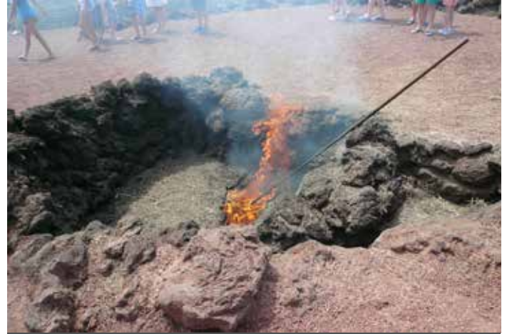
Dimostrazione del calore sotto il piano di campagna.