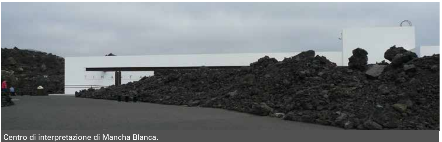
Centro di interpretazione di Mancha Blanca.