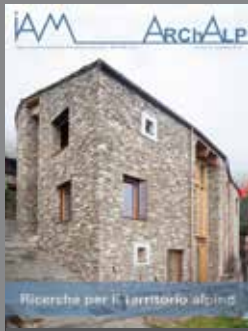
ArchAlp10 Ricerche per il territorio alpino