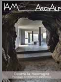
ArchAlp12 Dentro la montagna