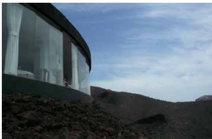
Ristorante panoramico progettato da Cesar Manrique.

qui vengono riassunti in trenta minuti i terribili eventi tra il 1730 e il 1736 che scossero l'isola, trasformandola irrimediabilmente, proponendo al pubblico di vivere l'esperienza di sensazioni uditive che gli abitanti di Lanzarote provarono quando hanno avuto luogo le eruzioni vulcaniche. Una guida accompagna nel percorso raccontando le terribili eruzioni vulcaniche che hanno colpito l'isola e che l'hanno cambiata per