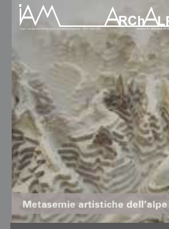
ArchAlp8 Metasemie artistiche dell'alpe