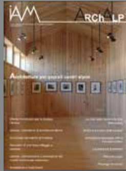
ArchAlp1 Architetture per piccoli centri alpini