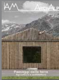
ArchAlp11 Paesaggi della terra