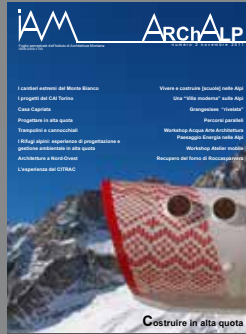
ArchAlp2 Costruire in alta quota