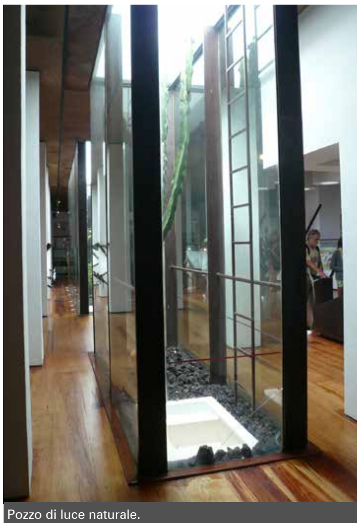
Pozzo di luce naturale.

sempre nel suo aspetto fisico. Quando il pubblico ha ormai preso posto nella sala, l'ambiente diventa completamente buio; sulla parete che simula la roccia vulcanica alcuni led si illuminano per simulare la colata lavica, il tutto con effetti sonori di forti boati e di vapori che fuoriescono dalla parete stessa.