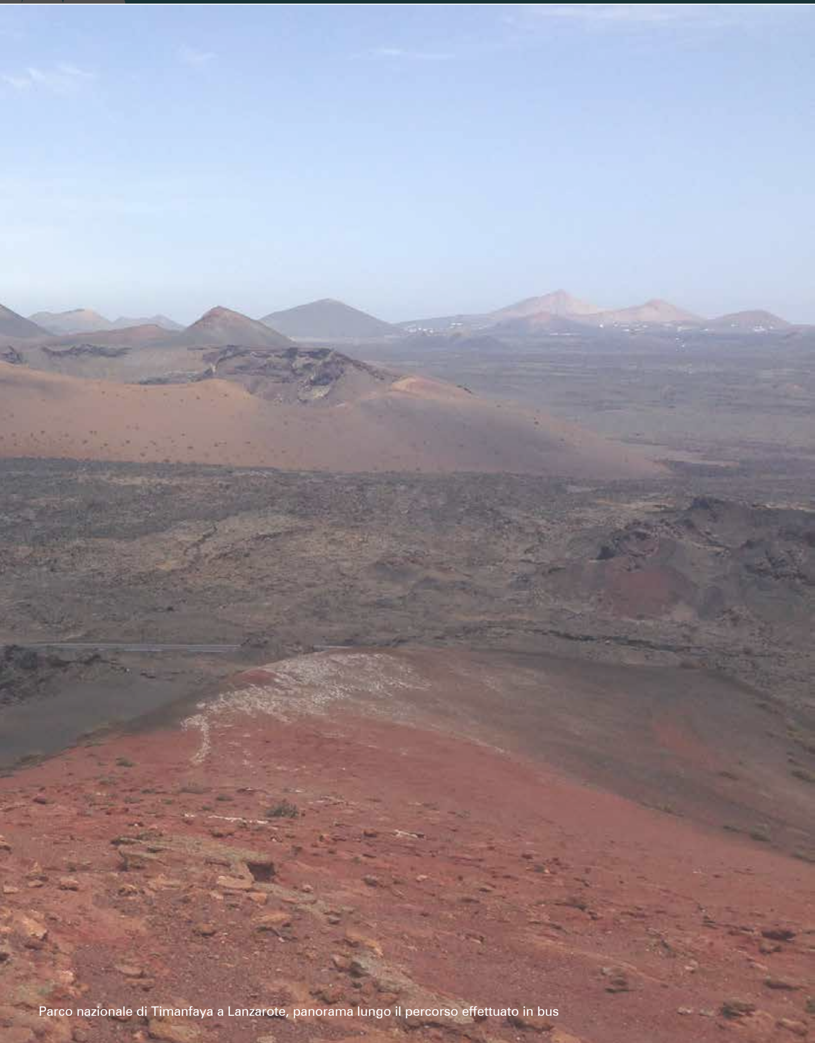
Parco nazionale di Timanfaya a Lanzarote, panorama lungo il percorso effettuato in bus