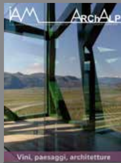
ArchAlp6 Vini, paesaggi, architetture