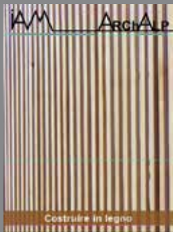
ArchAlp5 Costruire in legno