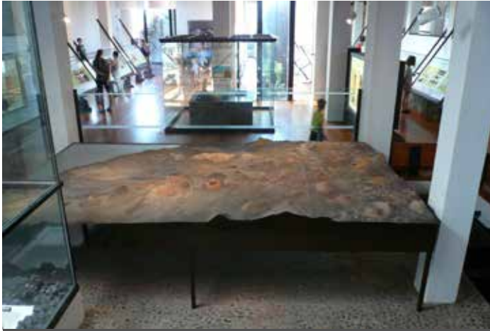
Vista del piano terreno del centro di interpretazione.