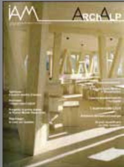
ArchAlp0 Numero zero