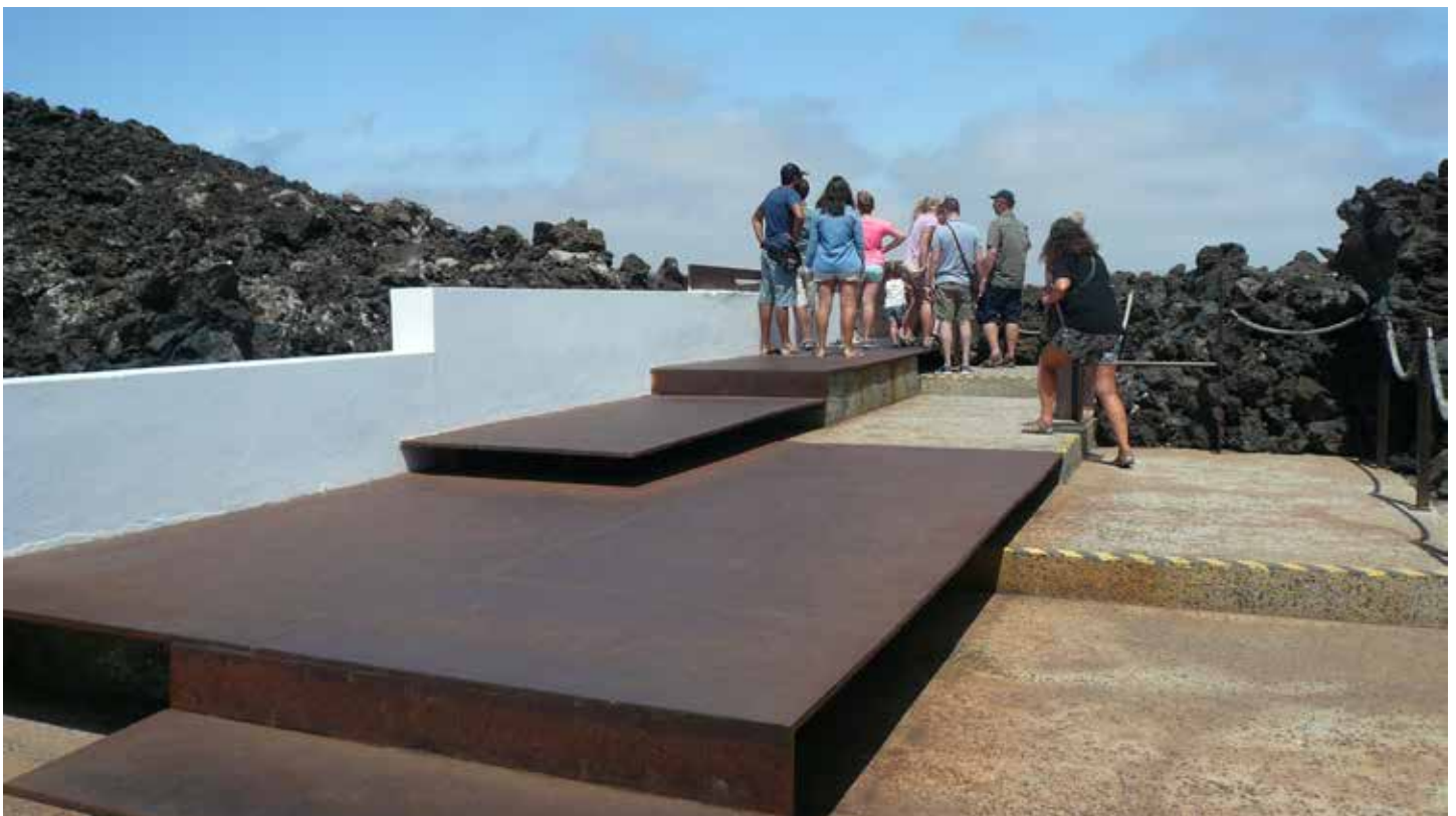
Punto di osservazione.