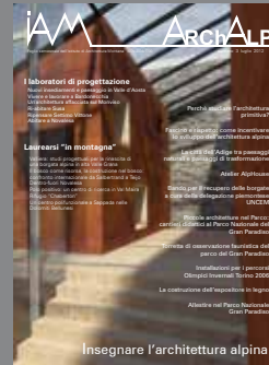
ArchAlp3 Insegnare l'architettura alpina