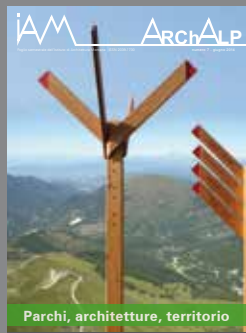
ArchAlp7 Parchi, architetture, territorio