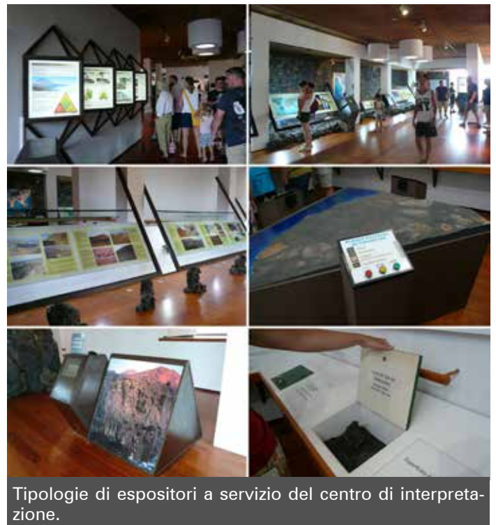
Tipologie di espositori a servizio del centro di interpretazione.

Al piano interrato è ubicata un'area di simulazione: