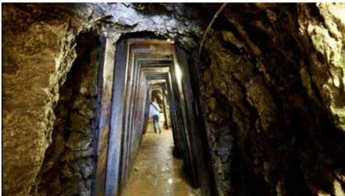
Miniere di Bex, Cantone Vaud (Svizzera).