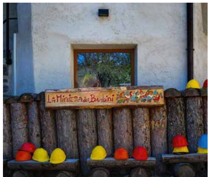
Parco Minerario Alta Valsugana e Bersntol (Trento): Museo Pietra Viva.