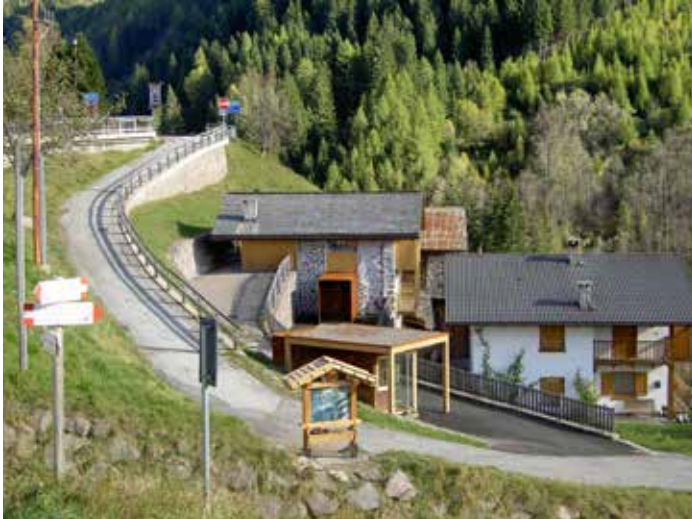
Parco Minerario Alta Valsugana e Bersntol (Trento): Miniera e Museo Palù.