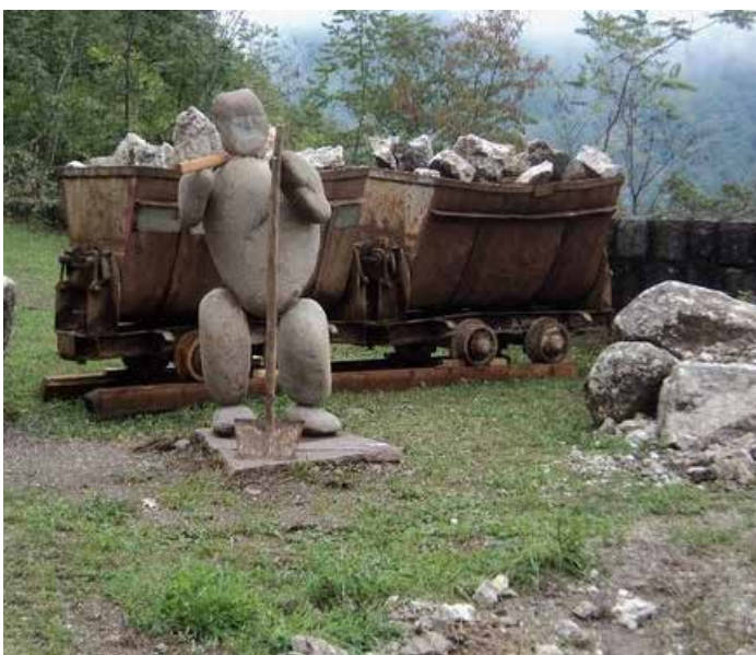
Parco Minerario Alta Valsugana e Bersntol (Trento): Museo Pietra Viva.