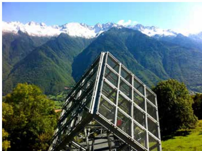
Complesso del Grand Filon a Saint-Georges-des Hurtières, Maurienne (Francia).