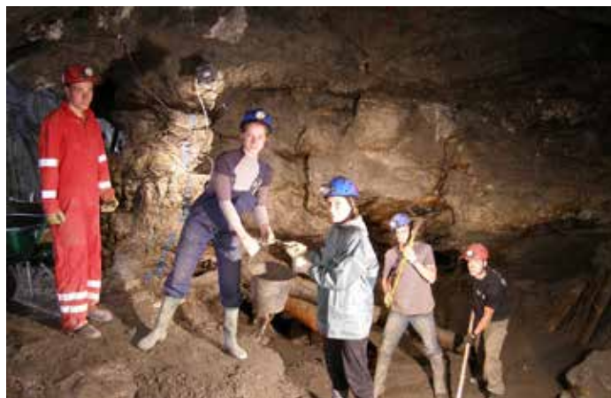
Miniera di L'Argentière-la-Bessée (Francia).