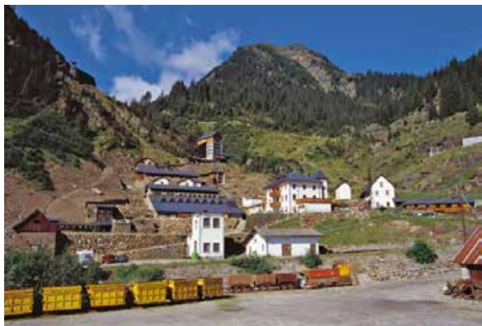
Miniere in Valle Isarco: Mondo delle Miniere di Ridanna Monteneve (Bolzano).