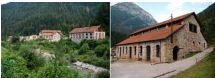
Centro Minerario di Val Imperina (Belluno).