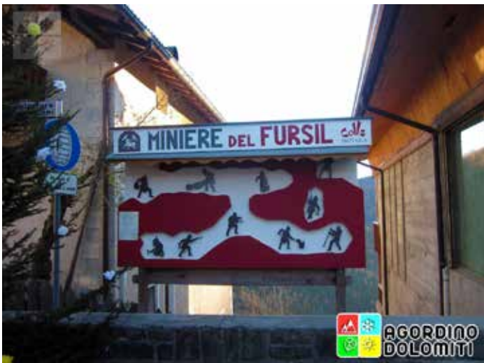
Miniere del Fursil, Colle Santa Lucia (Belluno).