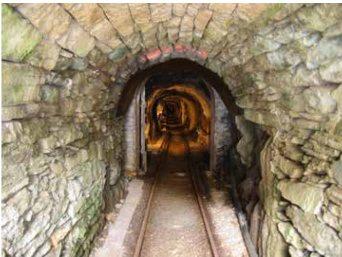
Miniera di Predoi (Bolzano).