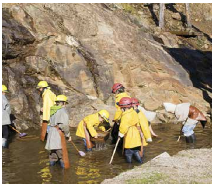
Miniere in Valle Isarco: Miniera di Villandro (Bolzano).