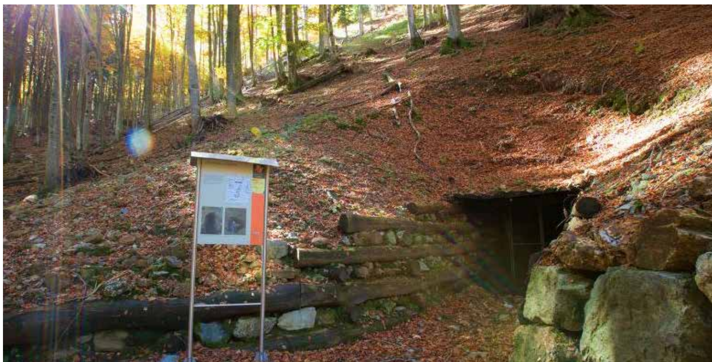
Via del Ferro in Valle Morobbia, Canton Ticino (Svizzera).