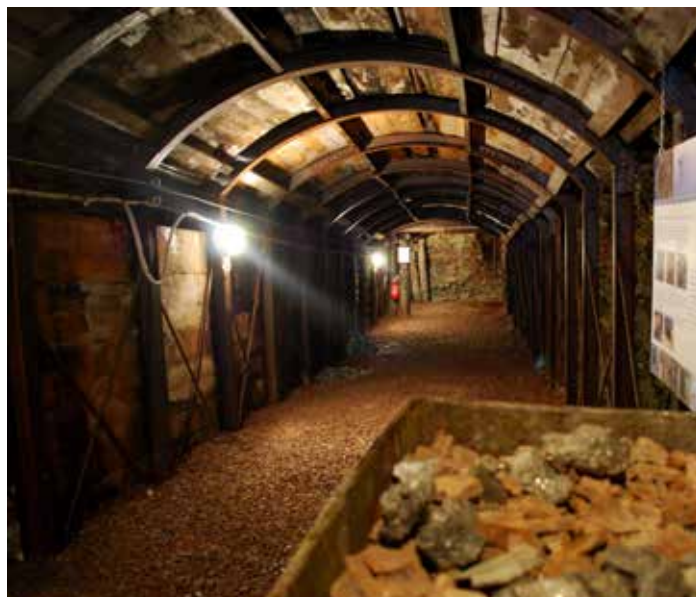
Parco Minerario Alta Valsugana e Bersntol (Trento): Miniera Calceranica.