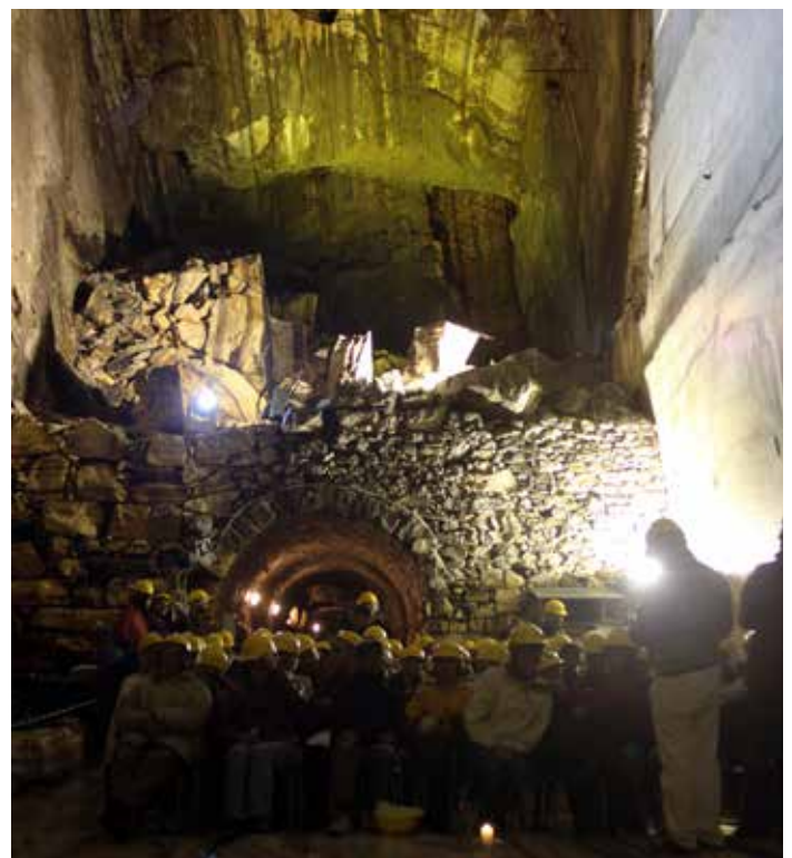
Cava di Ornavasso (Verbania).

In questo processo risulta centrale il recupero della dimensione storica e culturale non solo con il “congelamento” di uno stato di fatto, ma con una vera e propria teatralizzazione del lavoro attraverso l’esposizione di diorami e scenografie che – anche se nate a scopo didattico – corrono facilmente il rischio di scadere nel feticcio.