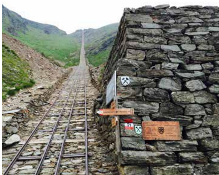
Miniere in Valle Isarco: Mondo delle Miniere di Ridanna Monteneve (Bolzano).