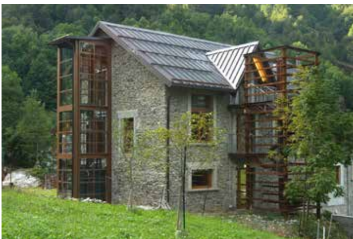
Museo delle Miniere Zanalbert, Colere (Bergamo).