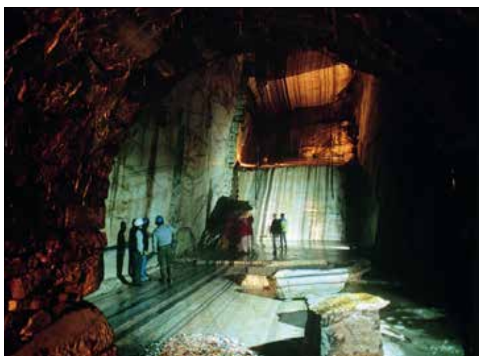
Cava di Ornavasso (Verbania).

Nell'attuale scenario socio-economico il sostentamento di queste realtà sembra infatti possibile – e può costituire anche un'occasione di un sviluppo locale – solo laddove si prefigura un'offerta turistica allargata in grado di metterle a sistema con le diverse forme di ricettività presenti (escursionismo, trekking, agriturismo, altri beni culturali); e soprattutto laddove queste progettualità cercano di ampliare il proprio campo d'azione per dare vita a veri e propri poli di servizio culturali, scientifici e didattici che travalichino la dimensione locale, intercettando l'interesse di un'utenza allargata.