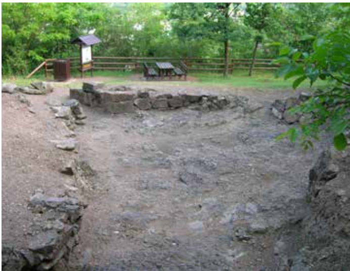
Parco Minerario Alta Valsugana e Bersntol (Trento): distretto minerario Pergine; sito archeologico Redebus.