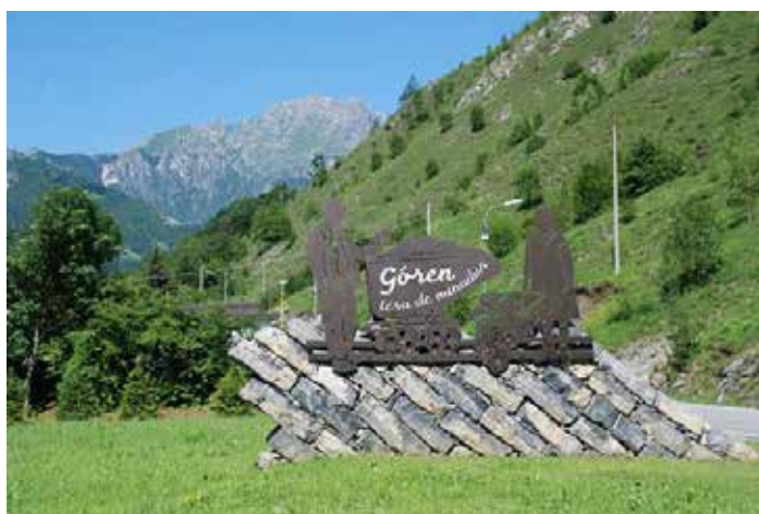
Ecomuseo delle Miniere di Gorno (Bergamo).