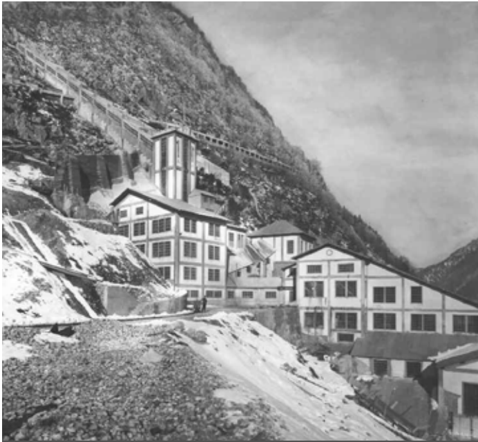
Miniera di Raibl di Cave del Predil, Tarvisio (Udine).