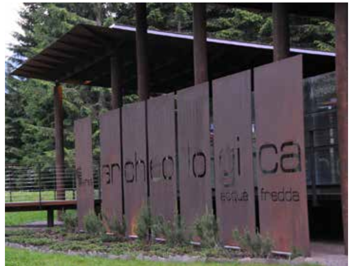
Parco Minerario Alta Valsugana e Bersntol (Trento): distretto minerario Pergine; sito archeologico Redebus.