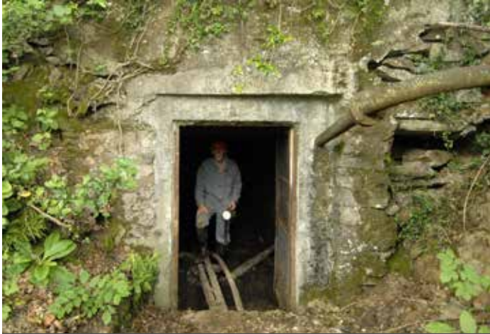
Miniera Costa di Sessa, Malcantone, Canton Ticino (Svizzera).