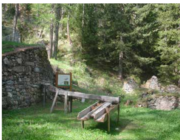
Palais de la Mine, Peisey Vallandry (Francia).