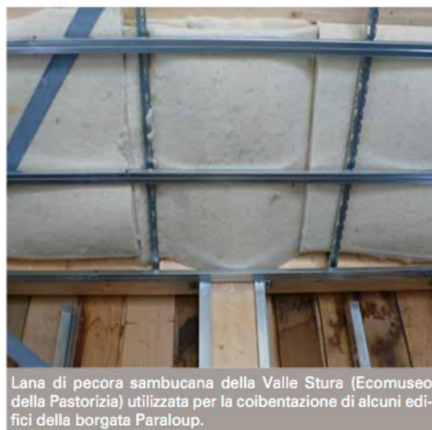
Lana di pecora sambucana della Valle Stura (Ecomuseo della Pastorizia) utilizzata per la coibentazione di alcuni edifici della borgata Paraloup.