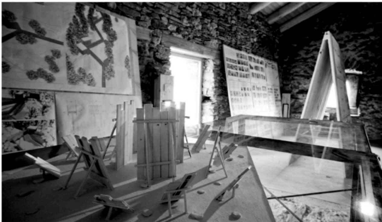
Mostra nel palazzo a vela di Castellaro in Valle Maira del workshop e cantiere didattico del Politecnico di Torino in collaborazione con L'Ecomuseo della Alta Valle Maira sul recupero della borgata dei mulini a Combe, centro di trasformazione delle materie prime (segale, canapa, frutta).

la castagna di Bernezzo, la pera madernassa, antica varietà di cui si elogia la rusticità già citata nella Pomologia del Pomon del 1916. Numerose sono poi le collaborazioni con il Politecnico di Torino in collaborazione con la Cassa di Risparmio di Cuneo: dai progetti di marca territoriale sino al progetto di una "università" del gusto in quota.