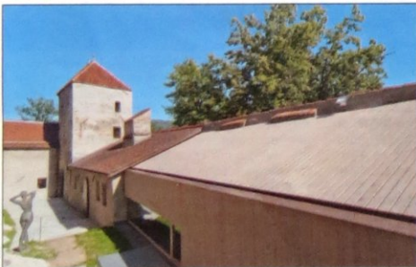
Inaugurata a luglio nel Castello vescovile di Brunico la quinta e ultima sede del Messner Mountain Museum (MMM Ripa), su progetto di em2 architetti. Articolo a pag. 3