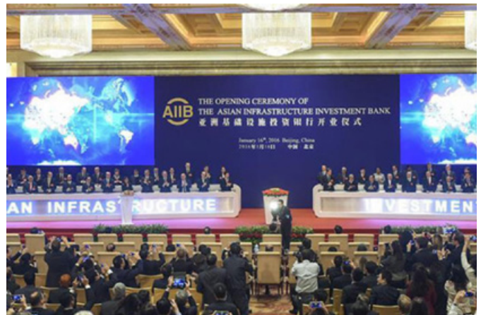
Il 16 gennaio si è tenuta a Pechino la cerimonia inaugurale della Banca asiatica d'investimento per le infrastrutture (Aiiib). Tra le più ambiziose iniziative di politica estera intraprese da Pechino negli ultimi decenni, la banca avvia nel 2016 le proprie attività, con l' obiettivo di erogare i primi prestiti entro la metà del 2017.

Incertezza nel settore finanziario. Un secondo trend per il 2016