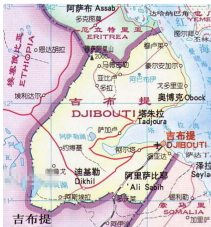
Mappa cinese di Gibuti (Jibuti, 吉布提). La decisione di stabilire la prima base militare all'estero rappresenta un importante cambio di rotta per la diplomazia cinese. La futura base, insieme a un quadro legale più chiaro, offrirà il fondamento per un ruolo più attivo della Cina nel campo della sicurezza internazionale.

In conclusione, con la base a Gibuti si apriranno nuovi importanti scenari per la diplomazia e le Forze armate cinesi. Data la natura principalmente reattiva della politica cinese in tema di coinvolgimento militare fuori dall'Asia, rimane difficile prevedere