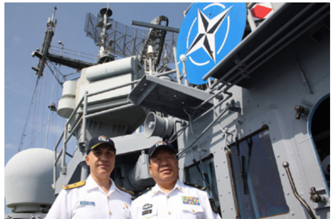
Cooperazione Cina-Nato contro la pirateria: il comandante dell'operazione Nato Ocean Shield e il suo omologo cinese si incontrano nel Golfo di Aden, a bordo della fregata turca Tcg Giresum, a inizio 2012

I fenomeni della globalizzazione e il relativo disimpegno statunitense in Medio Oriente hanno consentito a Pechino di rafforzare rapporti diplomatico-commerciali con le monarchie del Consiglio di cooperazione del Golfo (Ccg), anzitutto a tutela delle necessità energetiche interne: secondo la Energy Information Administration , nel 2014 il 26% del greggio importato dalla Cina proveniva da Arabia Saudita e Oman 3 . L'Arabia Saudita, frustrata dal riavvicinamento fra Washington e Teheran su dossier nucleare e lotta al cosiddetto califfato, guarda sempre più a est per diversificare la propria rete di partnership internazionali. Riyadh, firmataria di un