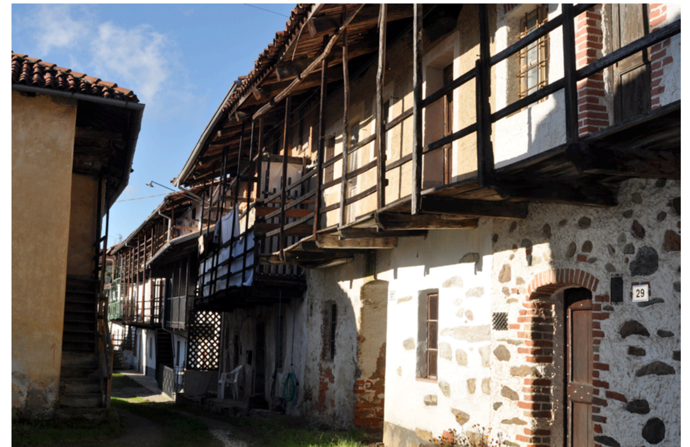
Fig. 12 - I tipici edifici in linea della frazione Carrera.