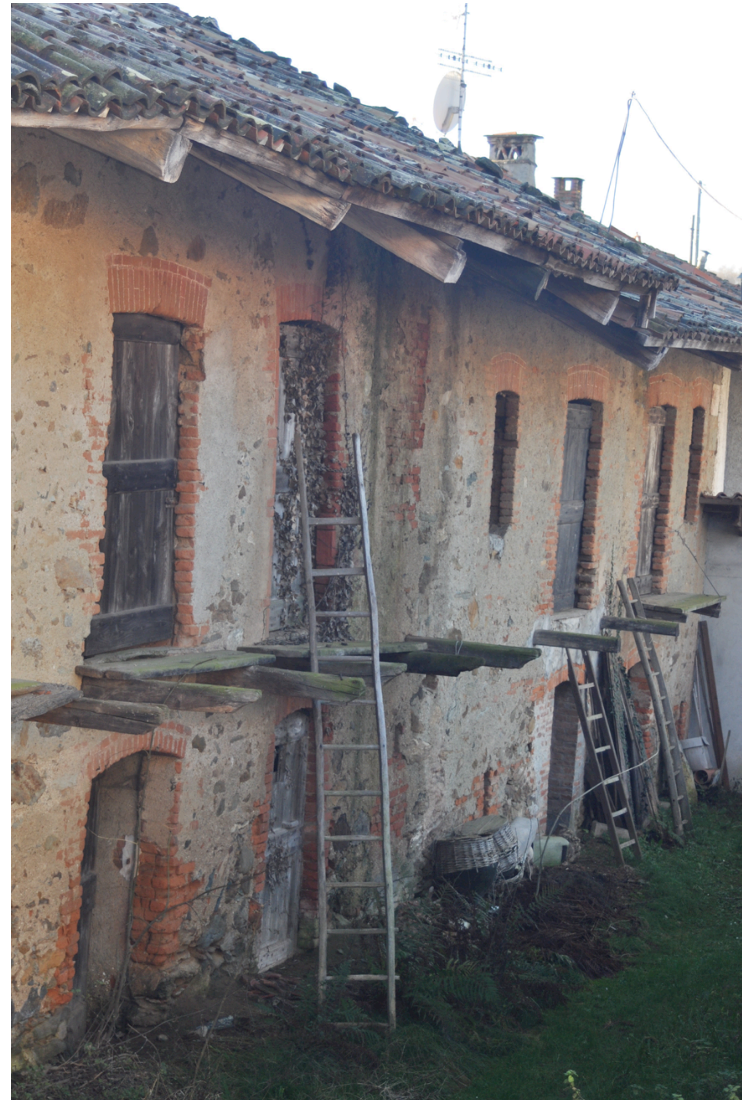
Figg. 5 - 6 - 7 - Molti fabbricati delle frazioni esternano tuttora l'originaria connotazione agricola. Qui e alla pagina seguente i casi di Carrera e di Broglina.