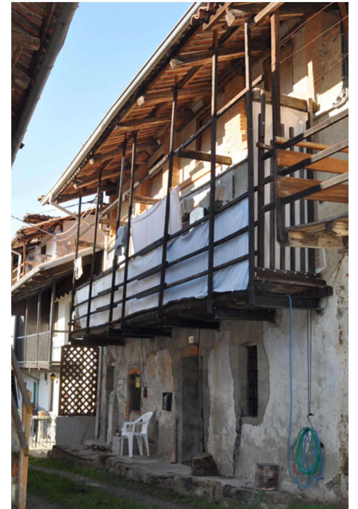
Fig. 9 - 10 - 11 - Il disegno a scacchiera dei loggiati a più piani che caratterizzano sia il paese sia le frazioni.