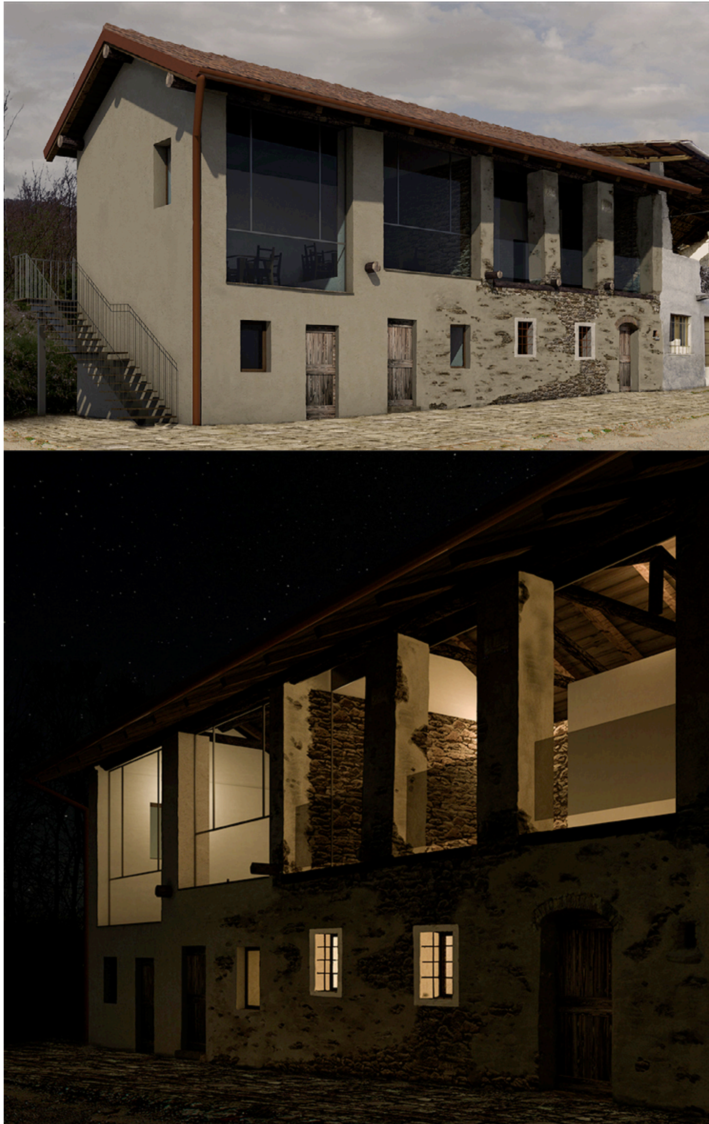
Fig. 22 - Viste del modello ricavato dal rilievo metrico per una proposta di recupero del fabbricato illustrato nelle figure precedenti (estratto dal lavoro Reloading Piletta presente nelle pagine successive).

sui due fronti opposti, anziché mediante l'usuale unica porta e scala a pioli per il secondo piano della cellula. E, ancora nel concentrico, sono da ricordare la chiesa di Santa Marta, dalle limpide forme barocche, e la parrocchiale di San Giovanni Battista, dalla fisionomia neoclassica dovuta agli interventi di ripulitura ottocenteschi. Nel bucolico paesaggio boschivo adagiato sulla Serra d'Ivrea si ritrova poi il gioiello più prezioso del comune magnanese: la duecentesca chiesetta di San Secondo, eccezionalmente sopravvissuta nella sua integrità medievale, e ora vivibile in un 'miracoloso' isolamento che ne fa, insieme alla vicina Comunità di Bose, oggetto di richiamo spirituale e culturale anche a livello internazionale (fig. 23).