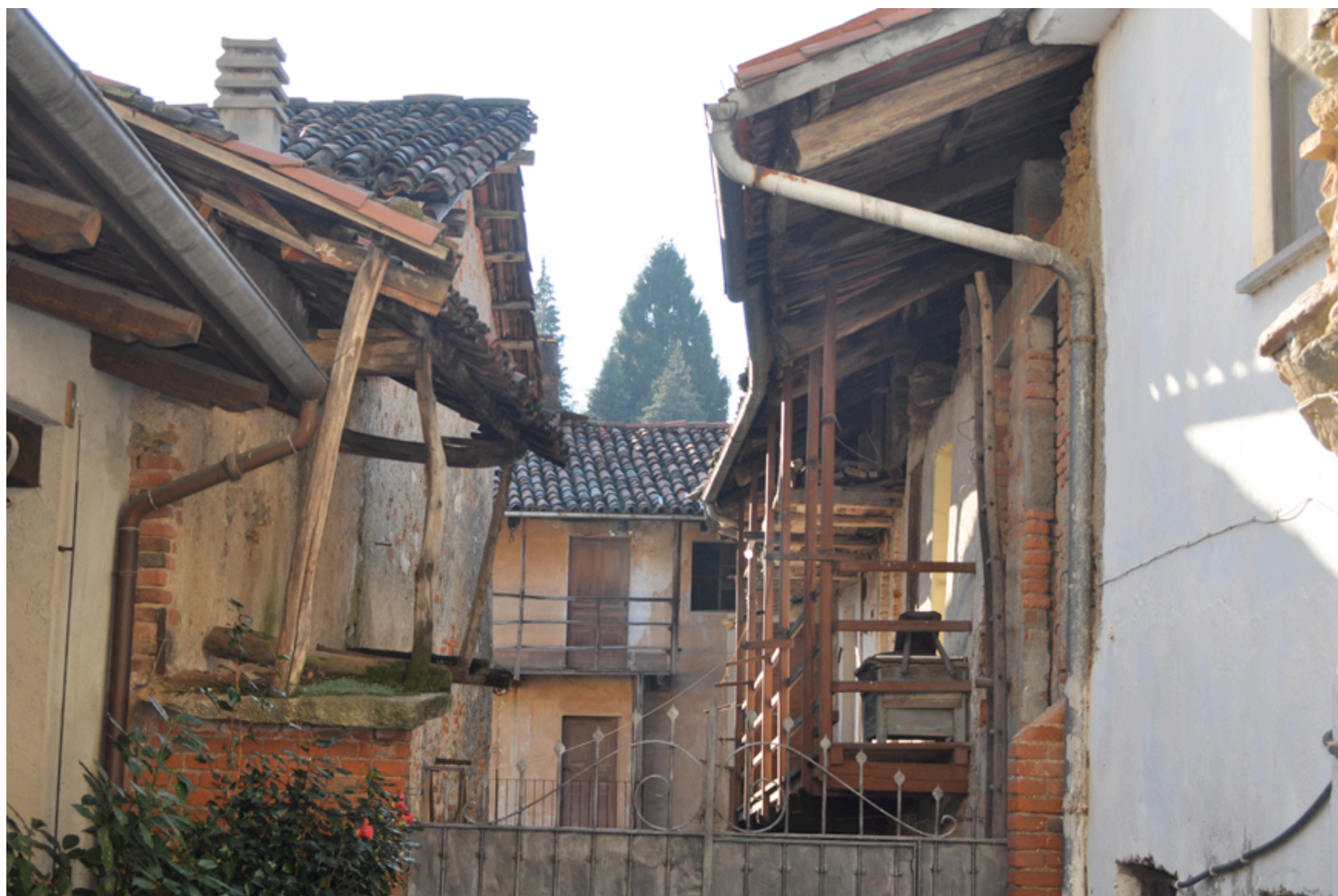
Figg. 3 - 4 - Una delle corti interne del paese con ingresso da via Roma, tipica della tradizione locale, che mostra l'irregolarità dei volumi e dell'assetto architettonico.