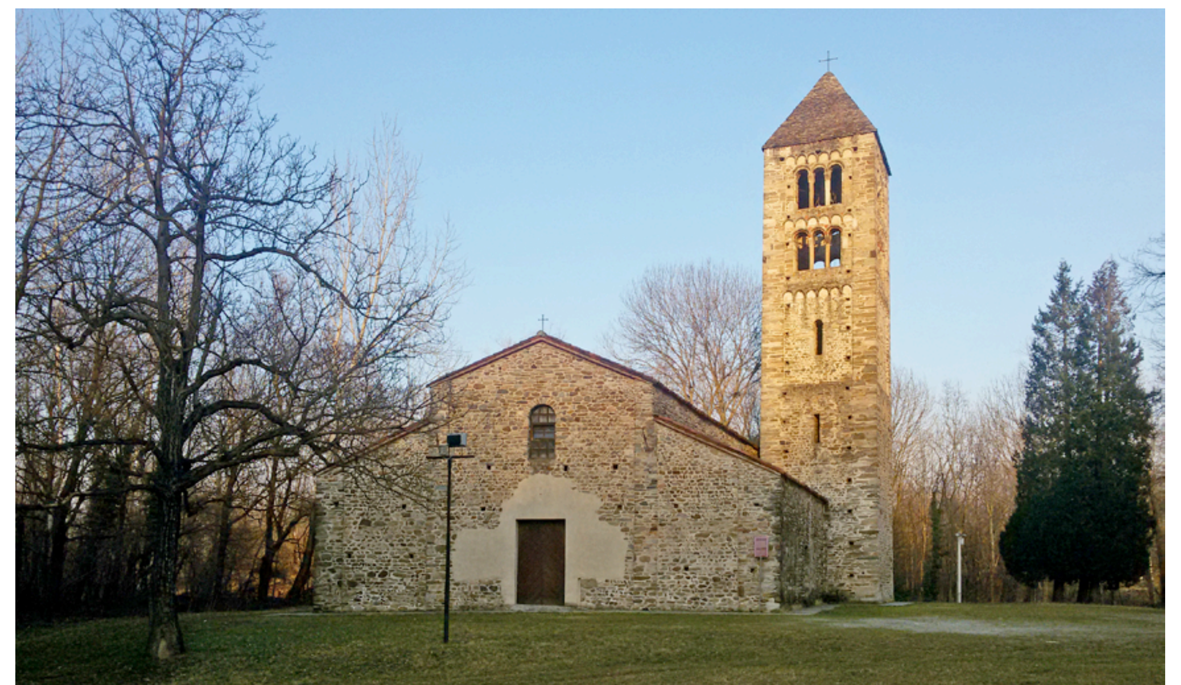
Fig. 23 - La chiesa medievale di San Secondo, isolata in un paesaggio incontaminato, che costituisce, con il ricetto, l'elemento più emblematico del patrimonio culturale di Magnano.

Potendo appunto contare su queste eccezionali presenze, ritengo lecito sperare che una riqualificazione reale dell' 'architettura popolare' analizzata nello studio qui presentato consenta a Magnano di mantenere nel tempo l'atmosfera preziosa della sua cultura contadina, tuttora radicata nella memoria collettiva, ma oggi leggibile materialmente solo per brani.