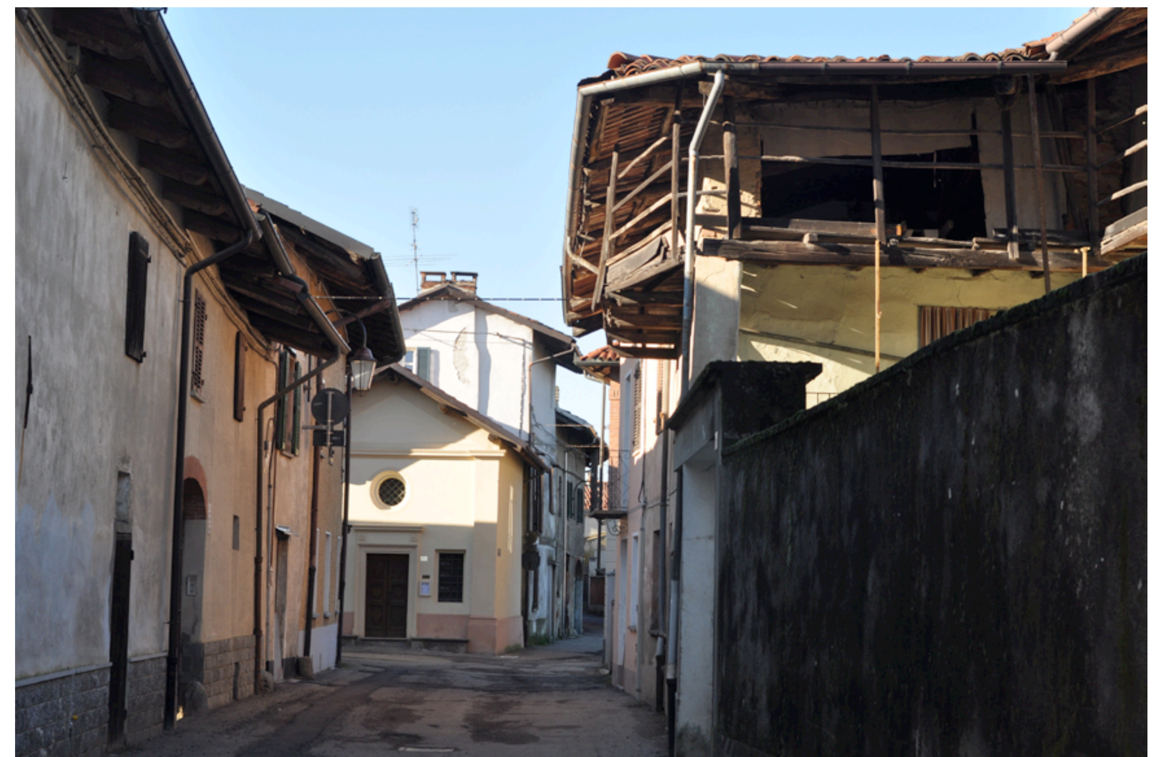
Fig. 2 - Un tipico scorcio del concentrico, via Roma, caratterizzato dalle piccole case dalle forme essenziali, nonché dalla chiesetta di San Rocco.