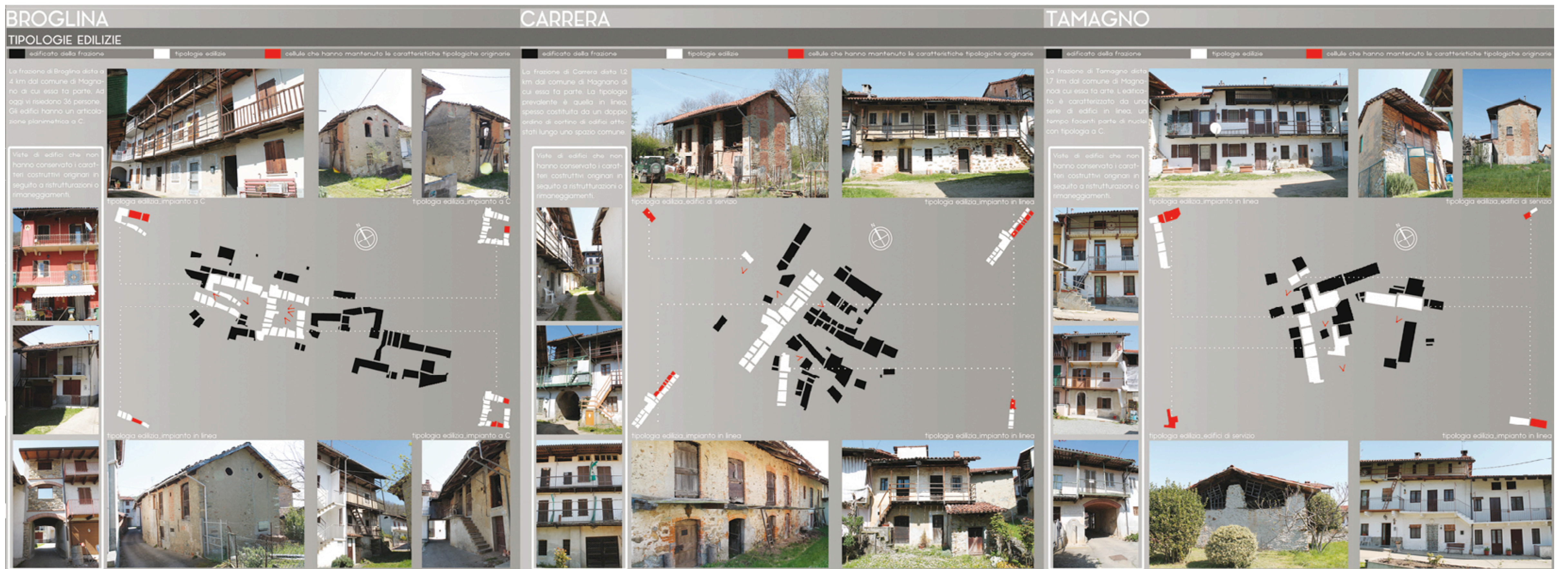
Fig. 16 - Il confronto nell'edificato tra le frazioni Broglina, Carrera e Tamagno (stralcio dalla fig. 15).