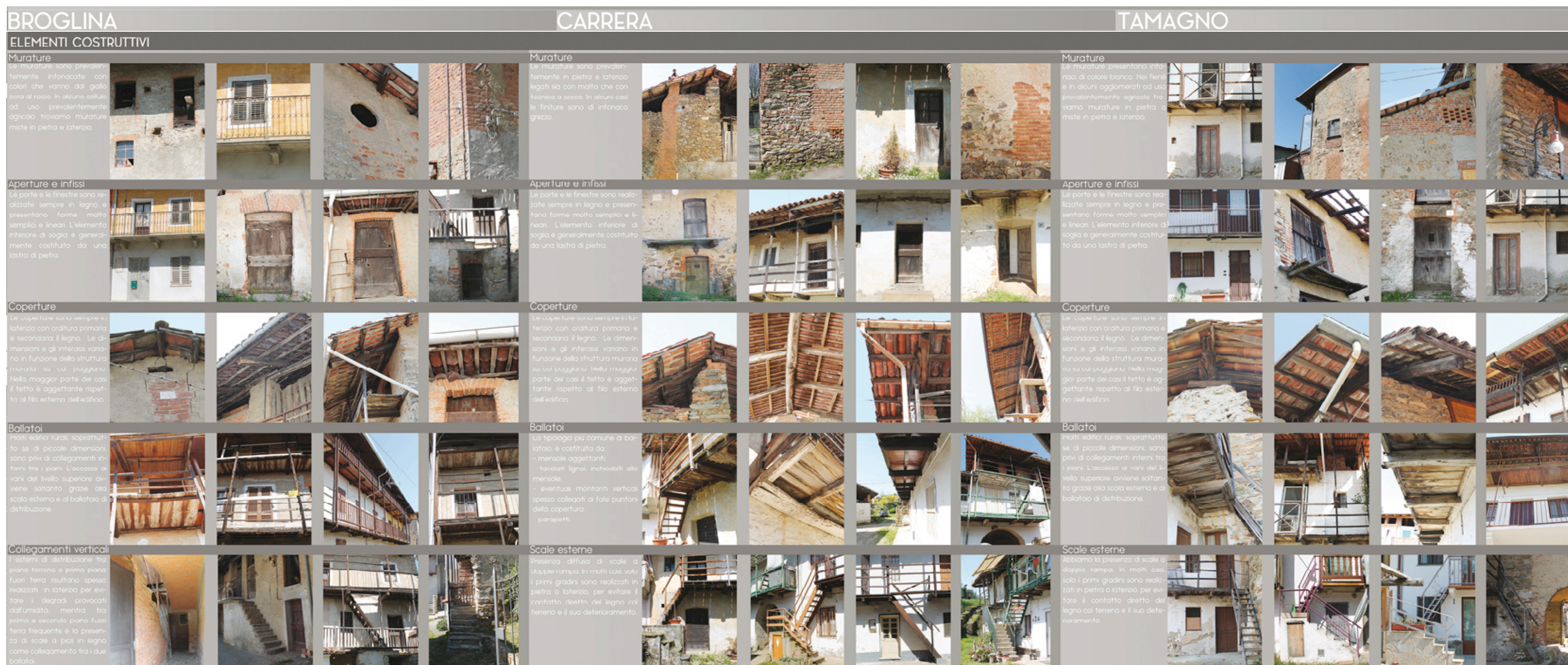
Fig. 17 - Gli elementi costruttivi nelle frazioni Broglina, Carrera e Tamagno (stralcio dalla fig. 15).

consapevole. Questo lavoro di rilievo critico, ampio e multifaccettato, ha contemplato ad esempio un approfondimento, con una lettura incrociata mediante l'uso di tabelle a scacchiera, finalizzato a testare le ricorrenze oppure le anomalie di alcuni componenti delle costruzioni che configurano con maggior vigore l'immagine ambientale: murature, tetti, aperture di facciata, ballatoi e scale. Il tutto sia in ciascun nucleo, sia nel confronto tra le varie frazioni (figg. 15 - 16 - 17).