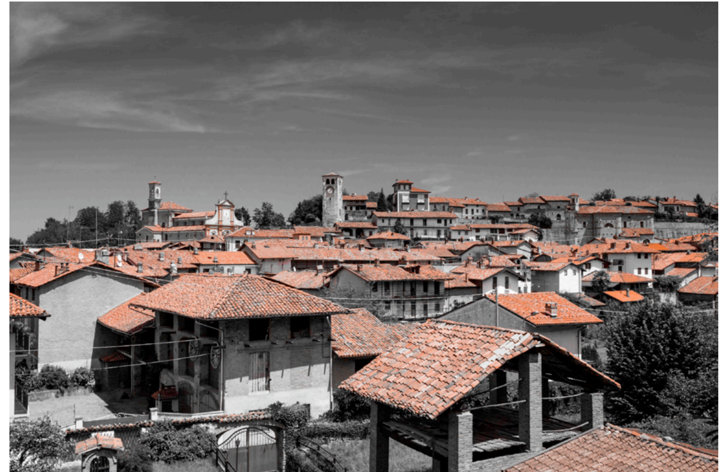
Fig. 1 - Il paese di Magnano nella contrapposizione tra il ricetto emergente con la sua torre e la chiesa parrocchiale e la sottostante volumetria irregolare degli edifici rurali.