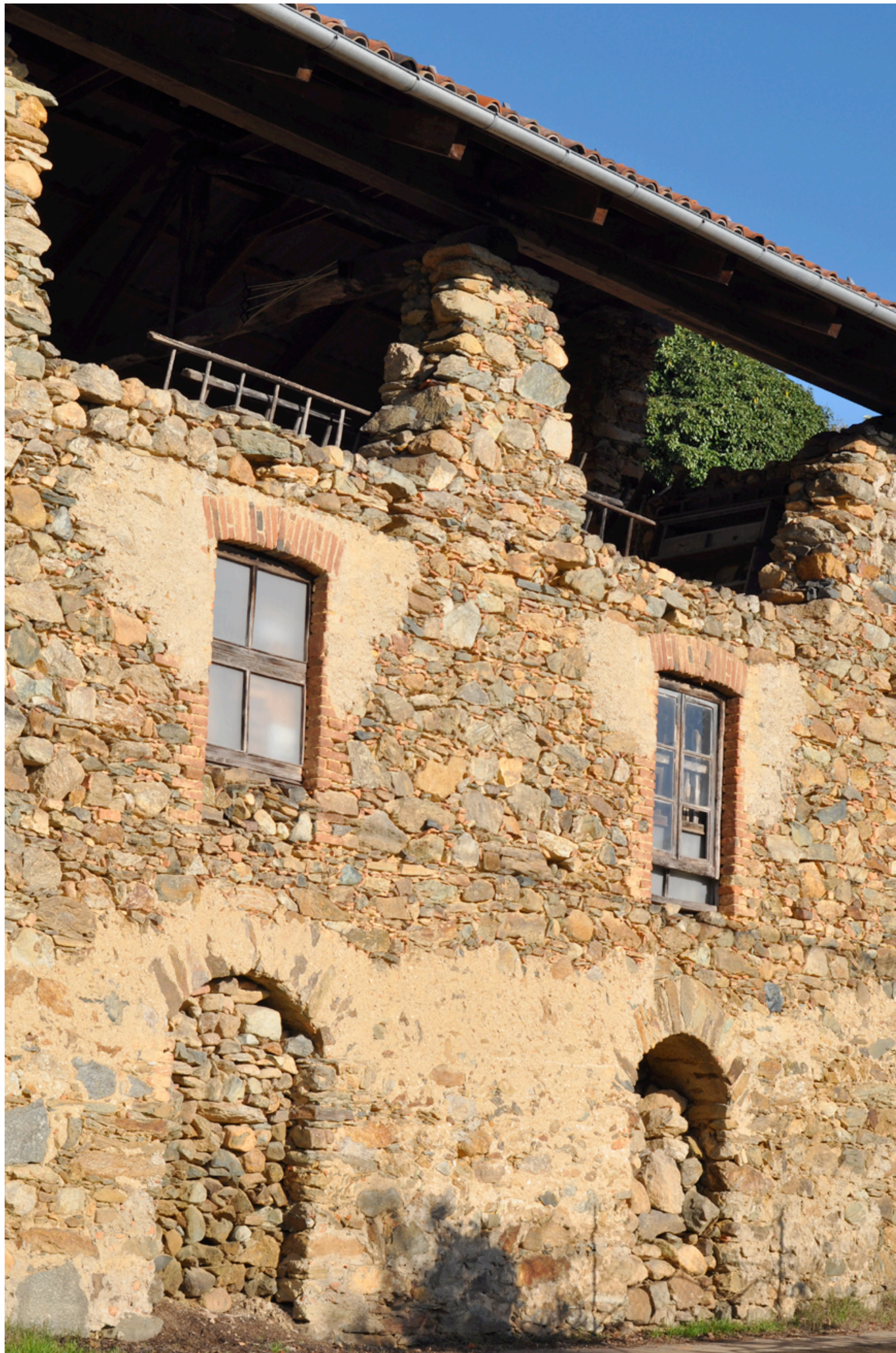
Figg. 18 - 19 - Frazione Piletta contraddistinta ambientalmente da un edificio che ha subito plurimi interventi di modifica e dal nucleo in cui si identificano la chiesa e il piccolo edificio un tempo adibito a scuola.