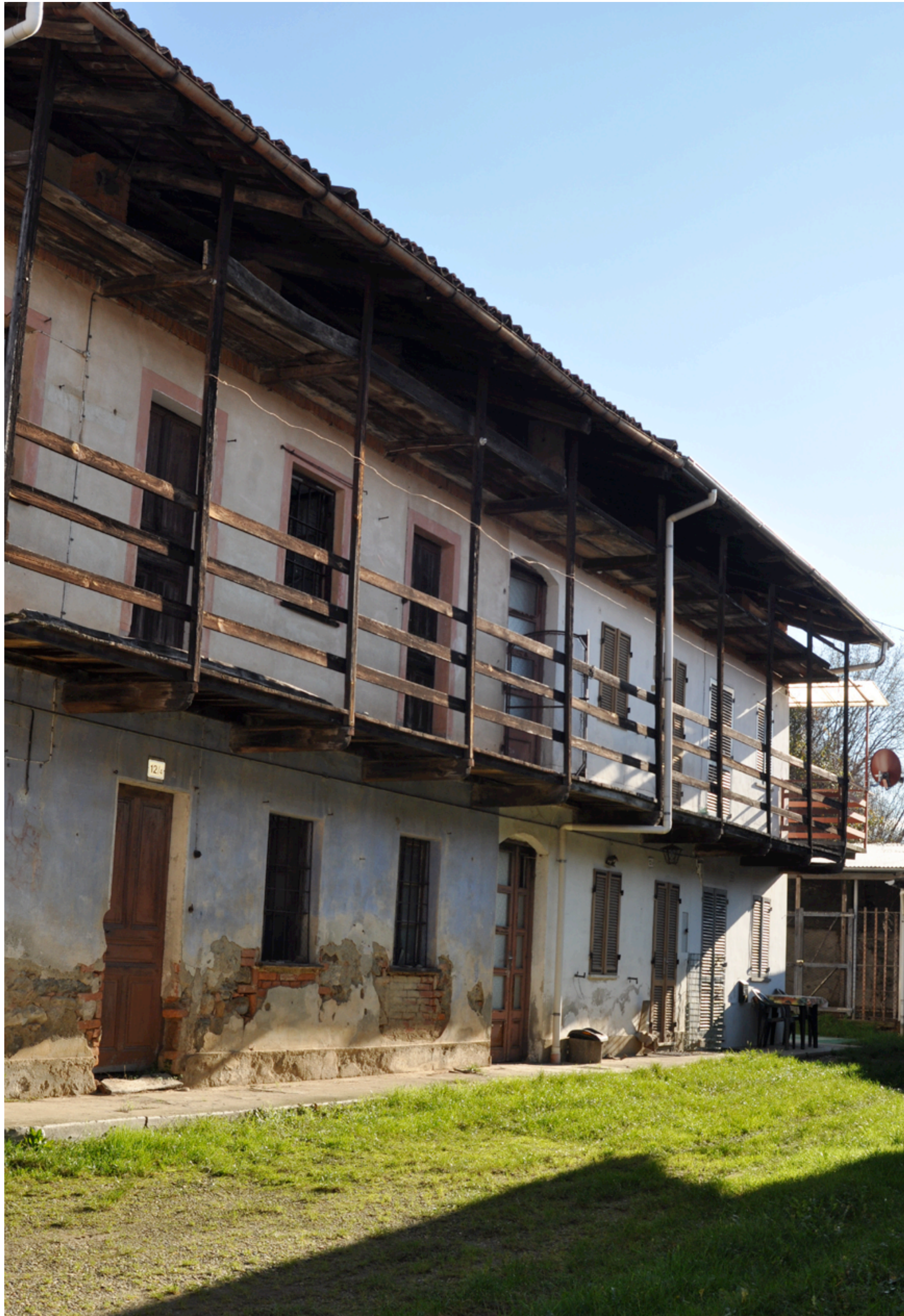
Fig. 13 Un altro fabbricato di Carrera fronteggiante quelli in linea.