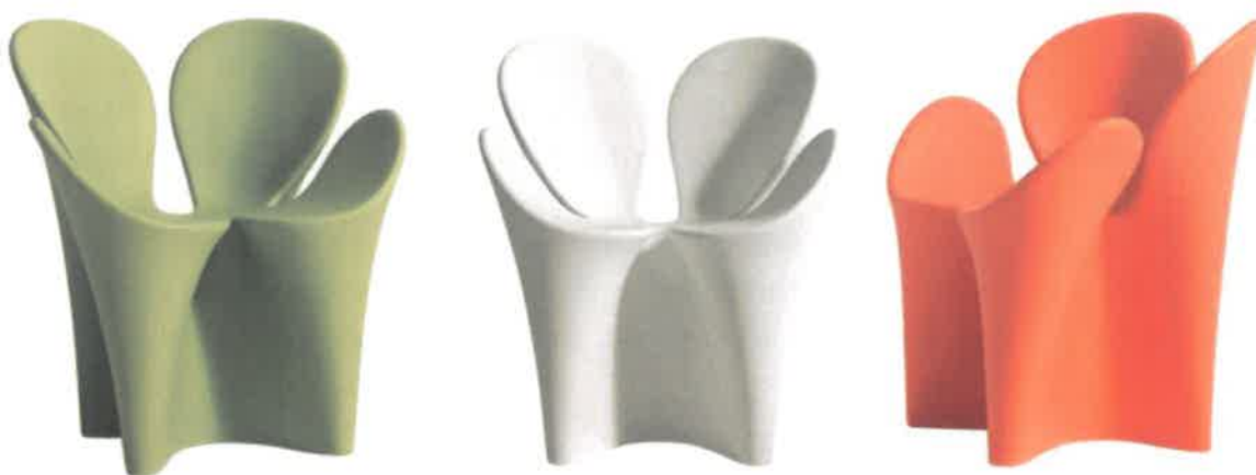
Fig. 9: R.Arada, poltroncina Clower

La poltroncina a dondolo Voido del 2006 per Magis, è realizzata in polietilene mediante stampaggio rotazionale che per effetto della forza centrifuga consente di realizzare forme grandi e leggere al tempo stesso. Il volume sinuoso ed ergonomico di Voido accoglie il corpo come un fluido abbraccio, ma dietro alla sua solo apparente semplicità, nasconde un complesso lavoro di ricerca ed ingegnerizzazione. Voido è disponibile con finitura lucida, in versione bianco e nero, oppure in versione opaca, in diversi colori per intonarsi ad ogni ambiente e stile, anche in esterni grazie alla resistenza del polietilene nei confronti dell'acqua e delle intemperie.