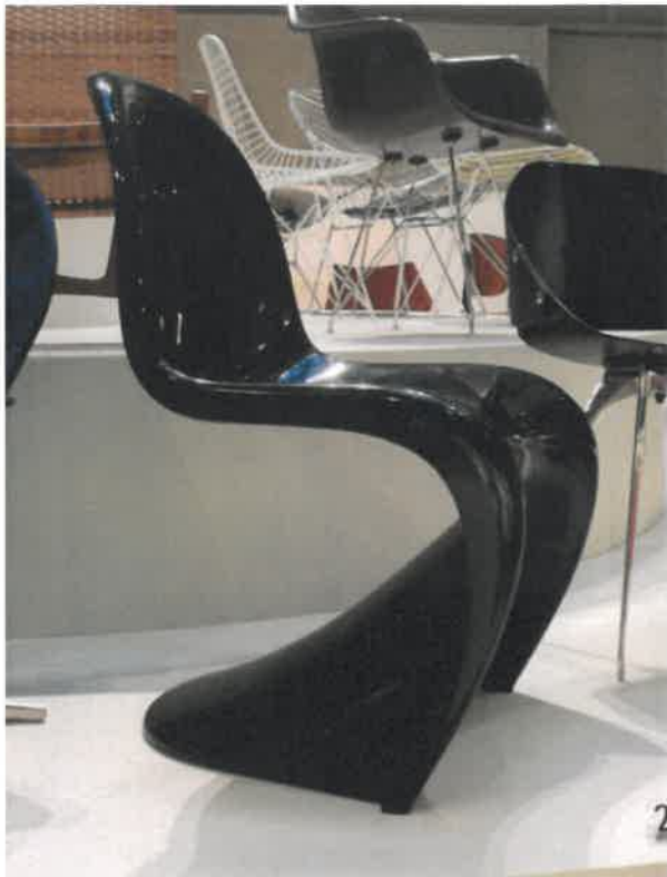
Fig. 3: V.Panton, Panton Chair

del materiale. Nasce in questa logica nel 1950 la Plastic Chair con scocca in materiale sintetico disponibile in una vasta gamma di colori nelle due versioni con braccioli -tipo A- e poco più tardi quella più semplice -tipo S- su telaio strutturale in tubolare metallico cromato o in legno con appoggi a terra puntuali o nella versione a dondolo.