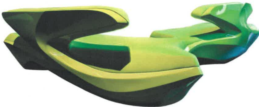
Fig. 14: Z.Hadid, divano Zephyr

Voglio terminare questa breve rassegna di mobili colorati con il divano Zephyr , disegnato nel 2013 per Cassina da Zaha Hadid, recentemente scomparsa. Il divano, come le sue architetture, risentono di concetti che sono propri delle arti visive e plastiche, reinventati a formare un oggetto unico nel suo genere. Il divano, ispirato alle rocce erose dal vento, è realizzato in fibra di vetro laccato con cuscini imbottiti rivestiti in tessuto, presentandosi così con una forma dinamica e scolpita. Gli schienali scavati e le forme sinuose delle sedute fanno sì che possa essere disposto in configurazioni sempre diverse (Fig. 14).