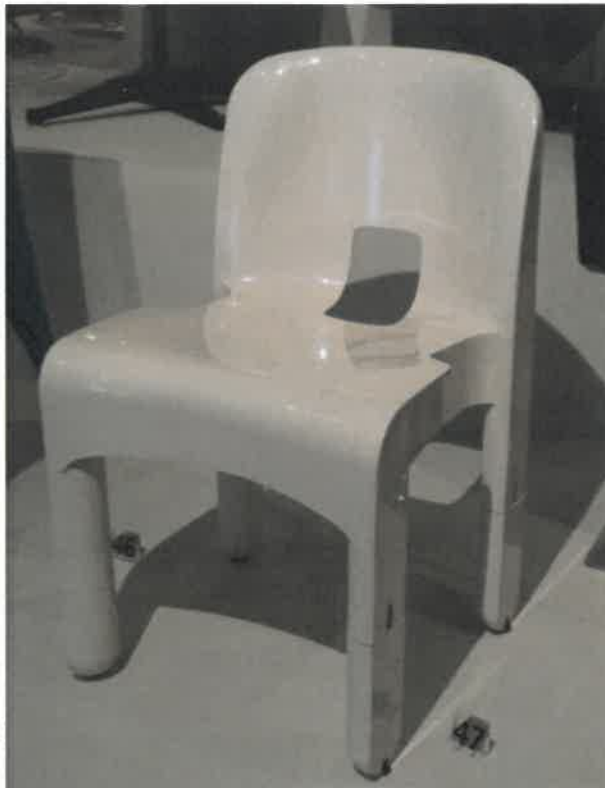
Fig. 4: J.Colombo, sedia 4867

Il lavoro di Verner Panton è quasi sempre segnato dal colore, protagonista delle sue creazioni al pari della tecnica e dell'uso delle materie plastiche. Egli lavora anni per arrivare al prototipo della sua sedia più conosciuta, la Panton Chair , messo a punto nel 1960. La produzione in serie arriva nel 1967 ed è subito un successo dovuto alla modernità del materiale e alla particolarità della forma: elastica e sinuosa, disegnata per seguire l'anatomia del corpo, il risultato della combinazione tra la struttura a sbalzo dal design antropomorfo e un materiale leggermente flessibile; inoltre è impilabile. Dal suo lancio sul mercato ha attraversato diverse fasi produttive e soltanto a partire dal 1999 è stato possibile produrre la sedia seguendo il progetto originale – stampaggio a iniezione da un unico blocco di polipropilene tinto in massa con una brillante finitura opaca (Fig. 3).