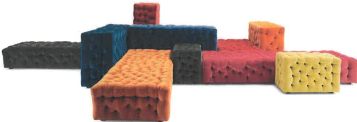
Fig. 12: G.Pesce, divano La Michetta

Gaetano Pesce disegna per Meritalia nel 2005 il divano componibile La Michetta che deriva il nome dal pane più semplice e meno costoso che si sforna a Milano.