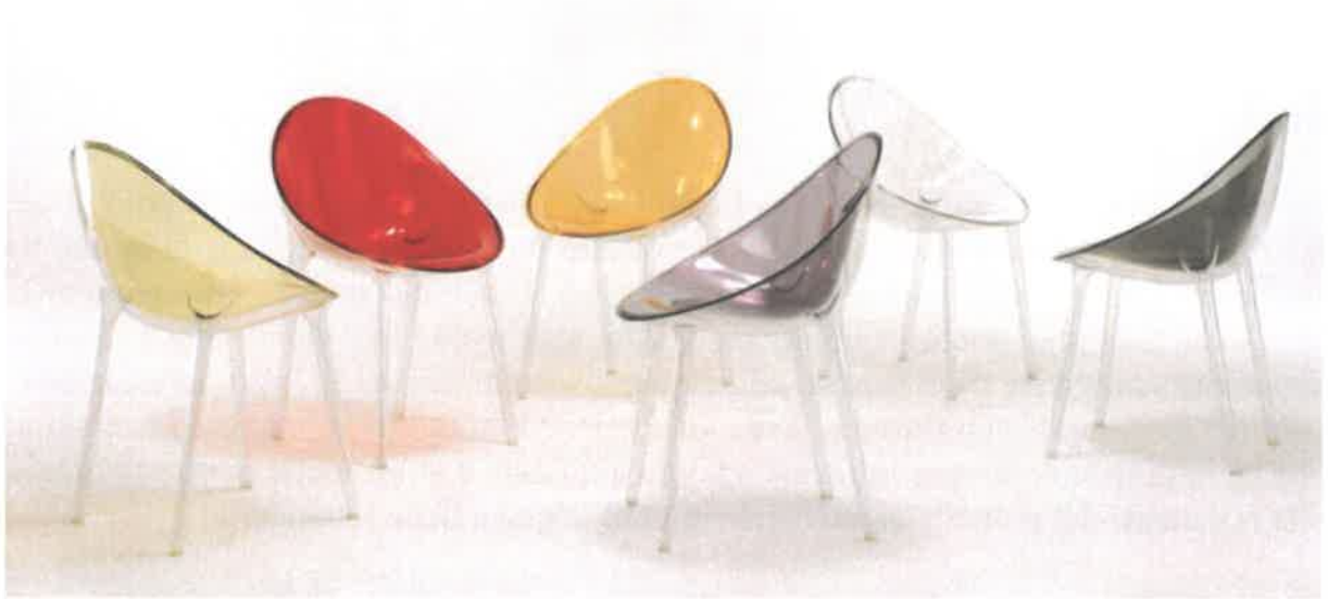
Fig. 8: P.Starck, sedia Mr. Impossible

La poltroncina Mr. Impossible del 2007 nasce dall'idea, apparentemente impossibile – da cui il nome – di unire due scocche ovali in policarbonato, una struttura trasparente e l'altra per la seduta in colore pieno, senza l'ausilio di colle. Le due scocche sono saldate a laser e conferiscono alla seduta un aspetto bicolore e al tempo stesso tridimensionale; inoltre la forma a conchiglia della seduta le conferisce un'ottima ergonomia. La sedia è disponibile con sedute in diverse colorazioni che, grazie alla doppia scocca, acquistano profondità e brillantezza. E' una seduta che invita a sedersi e che ispira comfort a prima vista grazie alla sua forma a conchiglia; sembra inoltre galleggiare grazie alle quattro gambe trasparenti dal fusto vuoto (Fig. 8).