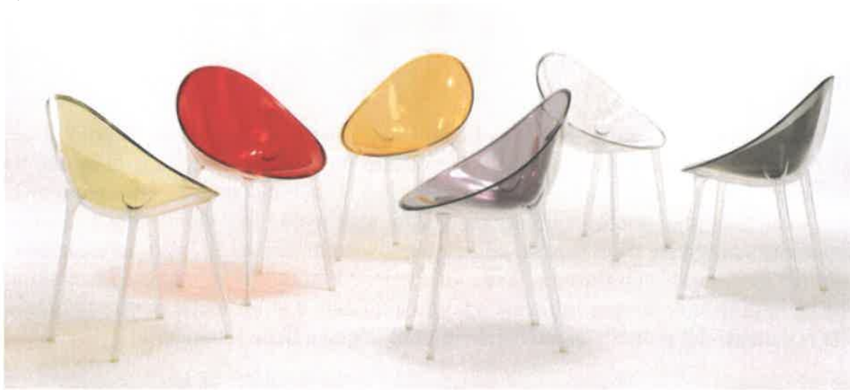
Fig. 8: P.Starck, sedia Mr. Impossible

La poltroncina Mr. Impossible del 2007 nasce dall'idea, apparentemente impossibile – da cui il nome – di unire due scocche ovali in policarbonato, una struttura trasparente e l'altra per la seduta in colore pieno, senza l'ausilio di colle. Le due scocche sono saldate a laser e conferiscono alla seduta un aspetto bicolore e al tempo stesso tridimensionale; inoltre la forma a conchiglia della seduta le conferisce un'ottima ergonomia. La sedia è disponibile con sedute in diverse colorazioni che, grazie alla doppia scocca, acquistano profondità e brillantezza. E' una seduta che invita a sedersi e che ispira comfort a prima vista grazie alla sua forma a conchiglia; sembra inoltre galleggiare grazie alle quattro gambe trasparenti dal fusto vuoto (Fig. 8).