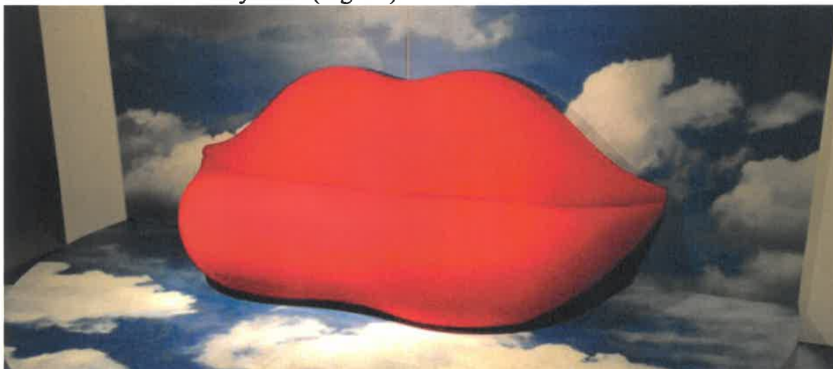
Fig. 11: F.Audrito, Studio 65, divano Bocca

Il divano Bocca è un divano a forma di labbra giganti lanciato da Gufram nel 1970 su progetto di Studio 65, nel colore rosso fuoco. Il divano trae ispirazione dal quadro di Salvador Dalì del 1935, "Il volto di Mae West" e in generale dalle labbra rosso fuoco delle dive di Hollywood (Fig. 11).