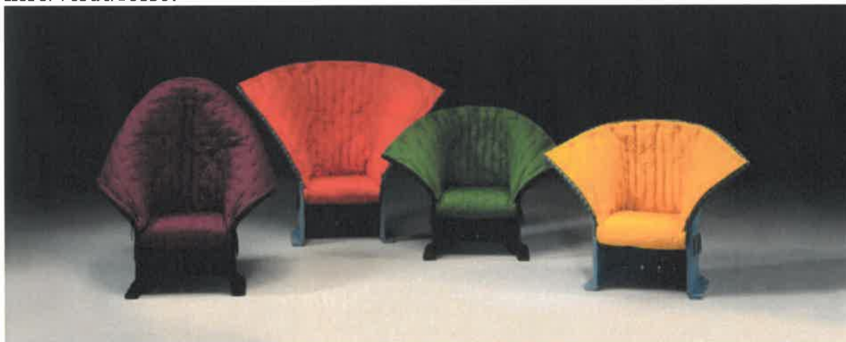
Fig. 13: G.Pesce, poltrone 357 Feltri

Alessandro Mendini nel 1976 pensa di realizzare un tessuto e una poltrona di Proust andando a visitare i luoghi dove aveva vissuto lo scrittore francese per trarne ispirazione. Nasce così nel 1978 con la collaborazione di Cappellini una poltrona in legno intagliato e dipinto a mano in colori acrilici con rivestimento fisso in tessuto multicolore ispirato all'impressionismo, al divisionismo e al puntinismo che riprende il decoro della struttura. Nel 1993 viene proposta una nuova versione della poltrona, la Proust Geometrica , dove sono mantenute le forme originali e la lavorazione a mano, ma il tessuto è rinnovato nella decorazione e nei colori, ottenendo due versioni cromatiche, multicolore azzurro/grigio/giallo e multicolore nero/verde/rosso.