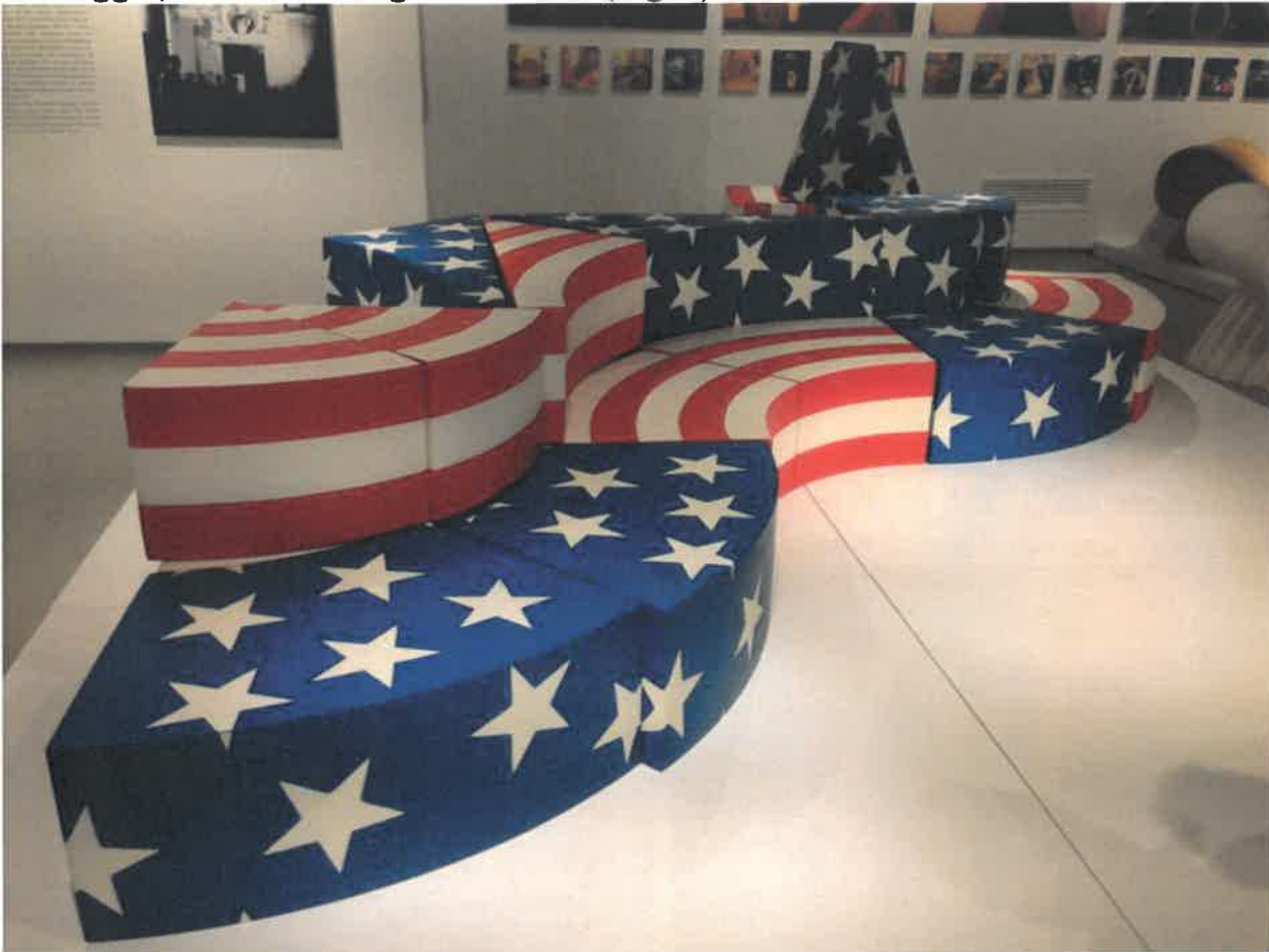
Fig. 7: F.Audrito, divano Leonardo

pensato che in qualunque modo uno lo compone, comunica sempre lo stesso messaggio, la bandiera degli Stati Uniti (Fig. 7).