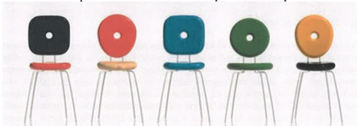
Fig. 10: P.Rizzato, sedie Ping Pong Pang

La poltroncina a dondolo Voido del 2006 per Magis, è realizzata in polietilene mediante stampaggio rotazionale che per effetto della forza centrifuga consente di realizzare forme grandi e leggere al tempo stesso. Il volume sinuoso ed ergonomico di Voido accoglie il corpo come un fluido abbraccio, ma dietro alla sua solo apparente semplicità, nasconde un complesso lavoro di ricerca ed ingegnerizzazione. Voido è disponibile con finitura lucida, in versione bianco e nero, oppure in versione opaca, in diversi colori per intonarsi ad ogni ambiente e stile, anche in esterni grazie alla resistenza del polietilene nei confronti dell'acqua e delle intemperie.