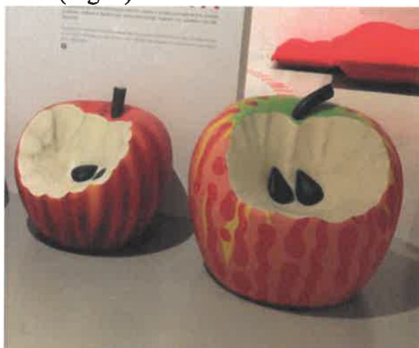
Fig. 5: G.Ceretti, P.Derossi, R.Rosso: seduta Pratone Fig. 6: F.Audrito, seduta Mela Morsicata

Pur essendo stato concepito con una precisa attitudine seriale tanto da essere modulabile e componibile per ricreare un intero campo verde tra le grigie mura domestiche, Pratone a tutti gli effetti è un progetto radicale, icona della rivoluzione culturale dell'anti-design. Si tratta di un oggetto per il riposo singolo e collettivo, momentaneo, instabile, sempre da conquistare per l'elasticità del materiale. Partendo da due misteri contrapposti, l'erba come riferimento biologico e il materiale di produzione industriale come presenza artificiale, questa seduta, si pone nell'ambito delle ricerche formali volte a liberare la gente da alcuni condizionamenti del suo comportamento abituale.