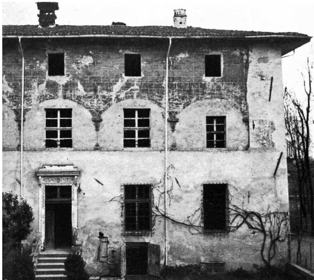
Fig. 8-9 Castello di Villanova Solaro, Cuneo. Il loggiato verso la corte del castello, lato nord: foto del palinsesto murario negli anni Venti del novecento (da Olivero, Il castello cit., 1928) e dettaglio attuale di uno dei sostegni, dopo i recenti restauri.

Tra civiltà cavalleresca e imprenditorialità rurale: appunti sui castelli subalpini nell'autunno del Medioevo Andrea Longhi