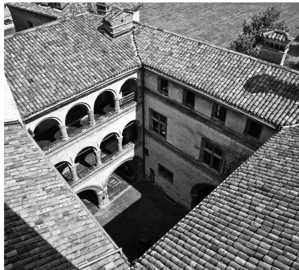
Figg. 10 Castello di Gaglianico, Biella. La corte del castello, interventi dell'ultimo quarto del XV secolo (da L. Spina, I castelli biellesi , Cinisello Balsamo 2001).

Sebbene il tema principale del presente contributo non sia l'adozione di modelli e soluzioni all'antica centroitaliani in un contesto cavalleresco alpino e internazionale, può essere utile proporre alla riflessione due casi di intrigante giustapposizione di scelte cortesi e di addizioni rinascimentali, che potrebbero significativamente aggiungersi alle prime esplorazioni sul tema della penetrazione della classicità in Piemonte, prevalentemente riferite al tema religioso e alla committenza roveresca 81 . Il castello di Roddi (fig. 12) è un palinsesto di straordinaria complessità 82 : attorno a una torre cilindrica – posta sulla sommità di un'altura, in un castrum attestato documentalmente dal X secolo – si aggrega un complesso a blocco con tor-