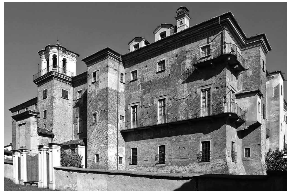
Fig. 3 Castello di Moretta, Cuneo. Castello di Filippo Savoia-Acaia (dal 1322), poi della famiglia Solaro (dal 1362).

potere (palazzi reali e ducali) necessariamente seguono codici linguistici consolidati 13 , ma al tempo stesso sono espressione materiale di "nuove forme di legittimazione, [...] nuovi modelli di sovranità e inedite esigenze di immagine" 14 . Le istanze formali innovative rivolte alla cultura dell'antico dovranno quindi trovare adeguate mediazioni con la costruzione simbolico/liturgica medievale dello spazio 15 e con le vivaci dinamiche radicate nella cultura comunale e nelle tradizioni municipali italiane 16 . Come nota Enrico Lusso, l'apparente "schizofrenia" tra alcune scelte artistiche innovative e altre soluzioni architettoniche schiettamente tradizionali, riscontrabile nei due marchesati subalpini nel travagliato primo quarto del Cinquecento, è il risultato di "scelte ideologiche consapevoli, la principale delle quali parrebbe essere il riconoscimento di una maggiore auctoritas a linguaggi architettonici più tradizionali, quasi che l'aderenza a modelli consolidati e ampiamente diffusi nelle corti padane tardomedievali meglio si addicesse ai principi, costituendo, di per sé, una sorta di consacrazione dinastica" 17 . Scelte