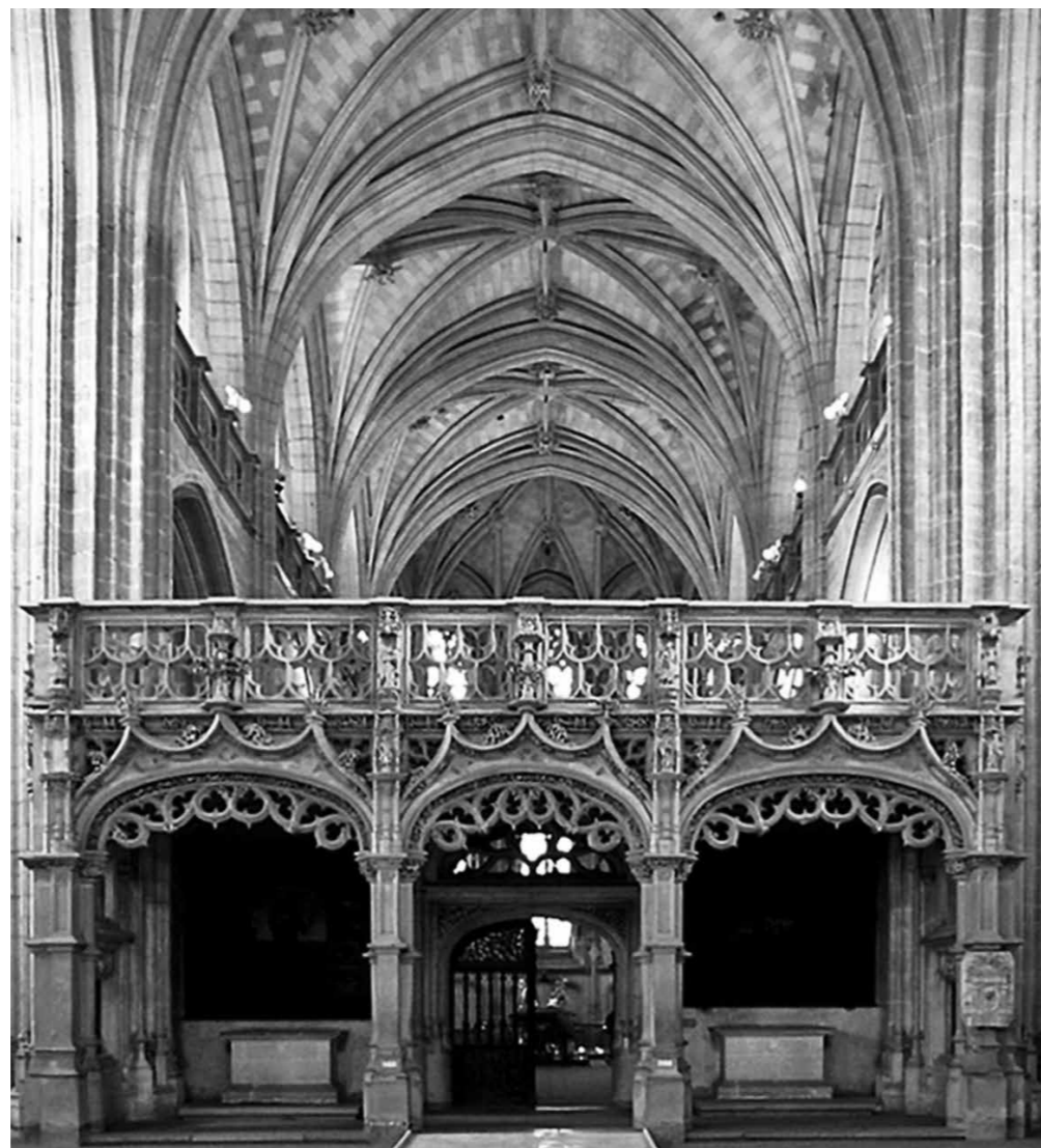
Fig. 2 Monastero reale di Brou, Bourg-en-Bresse, Ain. Tramezzo e coro, primo quarto del XVI secolo.