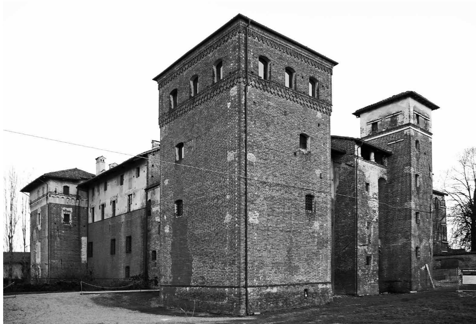
Fig. 6 Castello dei Tapparelli, Lagnasco, Cuneo. Interventi della seconda metà del XV secolo.

Tra civiltà cavalleresca e imprenditorialità rurale: appunti sui castelli subalpini nell'autunno del Medioevo Andrea Longhi