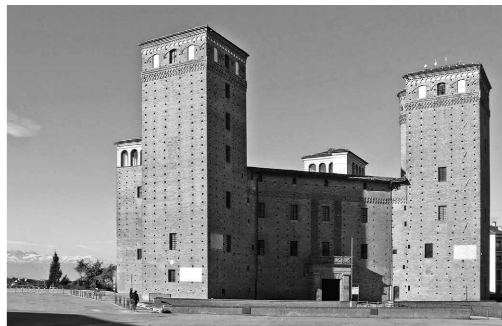
Fig. 4 Castello sabaudo di Fossano, Cuneo. Esterno del castello (cortine dal 1324).

analoghe di legittimazione e di radicamento in un'incontestata cultura giuridica imperiale centroeuropea sono probabilmente alla base della più importante committenza sabauda di primo Cinquecento, il monastero-sacriario dinastico di Brou (fig. 2) presso Bourg-en-Bresse – promosso dalla duchessa di Savoia Margherita d'Asburgo, figlia dell'imperatore Massimiliano I e vedova di Filiberto di Savoia – complesso monumentale realizzato da maestranze fiamminghe in elaboratissimo linguaggio gotico, a partire dal 1506 18 . In sintesi, nel Quattrocento alpino e pedemontano il fascino del cavaliere 19 prevale ancora – e prevarrà a lungo – su quello del letterato umanista: ne discende che i caratteri ostentatamente castellani delle dimore extraurbane avranno