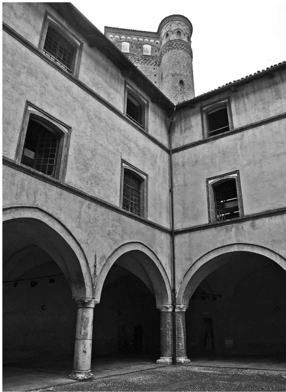
Fig. 5 Castello sabauda di Fossano, Cuneo. Palatium nella corte (ultimo quarto del XV secolo).

vanni, 2013 2 ; al tema è dedicato il recentemente istituito Museo della Civiltà Cavalleresca, allestito nella Castiglia di Saluzzo, curato da Rinaldo Comba e Massimiliano Caldera, per il quale si rimanda alla Guida al Museo della Civiltà Cavalleresca. Il Marchesato di Saluzzo e l'Europa, a cura di R. Comba, M. Caldera, Cuneo 2014.